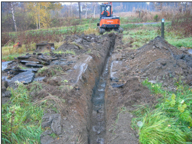
Kaapelioiden kaivuuta viemäriinjasta länteen.