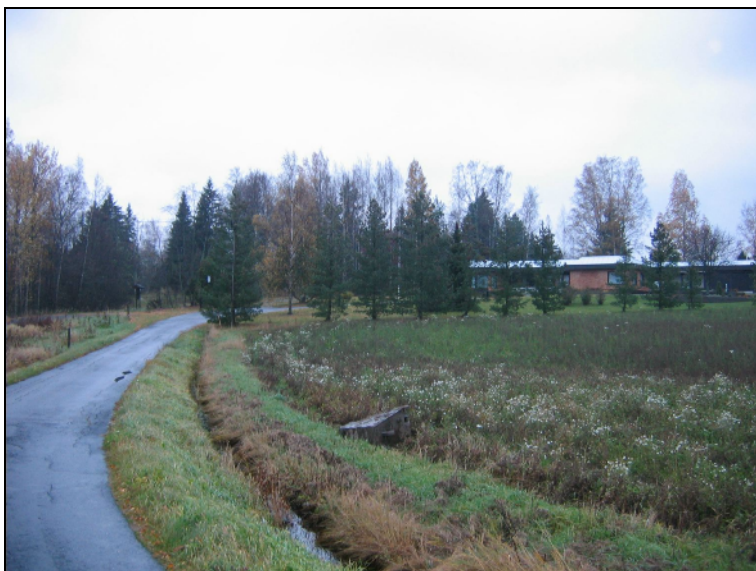
Pelto ennen ojan kaivuuta, pohjoiseen.