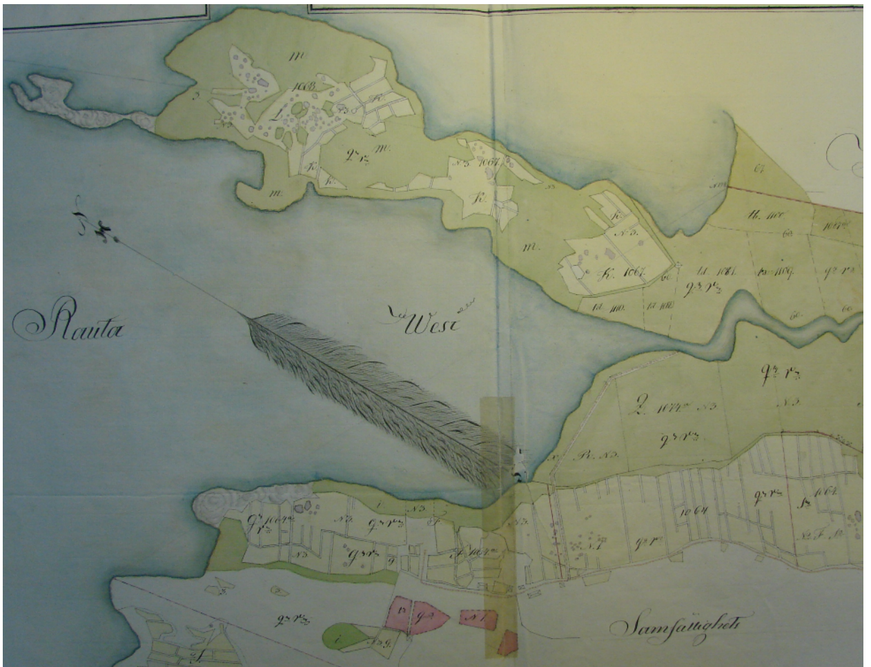
Toinen kartta Vehmaanniemen alueesta 1790-luvulta (A108-12-22b)