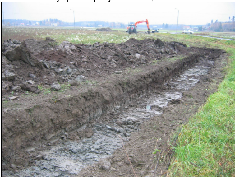
Oja pellon pohjoisosassa, etelään.