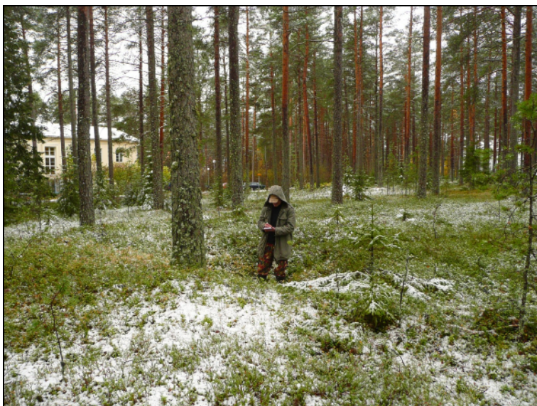
Eräs selkeimmistä alueella olevista kuopista. J. Kinnunen dokumentoi.