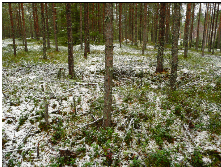
resenti maakuoppa kohdassa N 7195588 E 446843