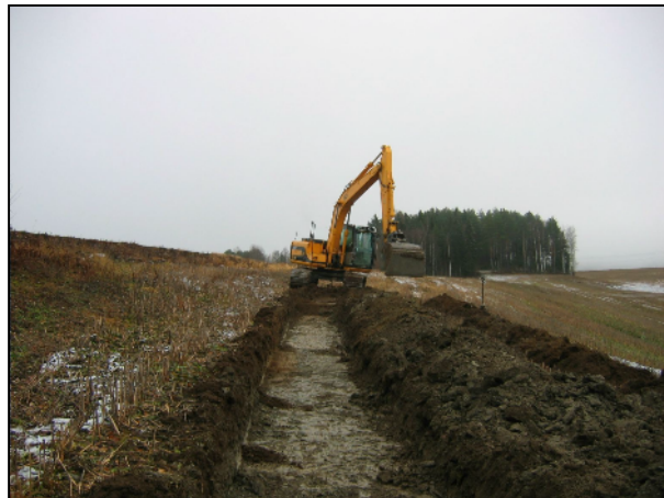
Alla: linja tien varressa, Hiekkalinssin itäpuolelta länteen.