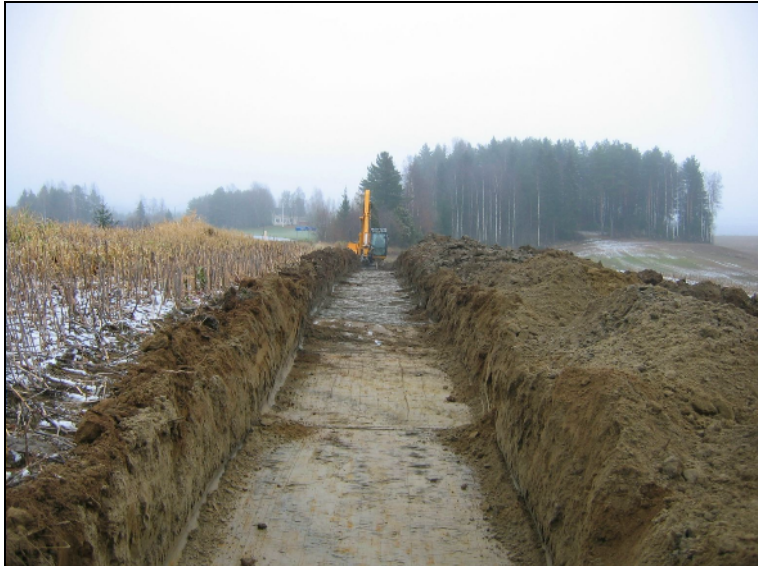
Hiekkamaaperäisen alueen itäpää on asuinpaikan 100 länsiosassa. Kuva itään.