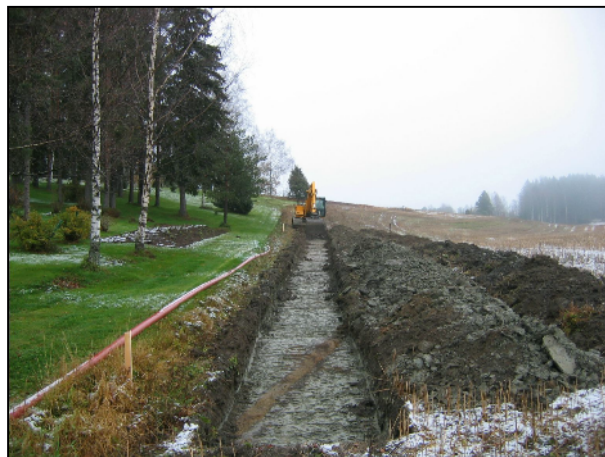
Linian länsipäätä. Alla: nousee tien varteen

Valvottu ja 25.10. kaivettu viemäriinjan osuus vaalean vihreiden palkkien välillä.