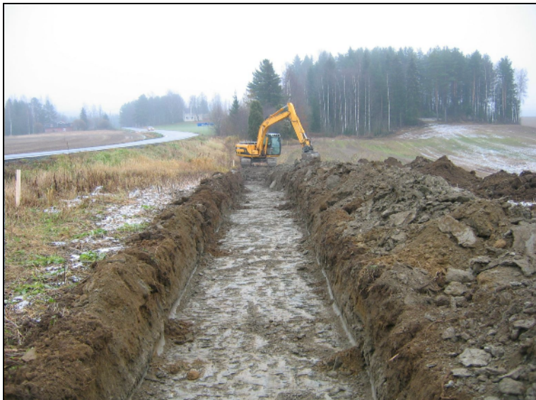
Linja oletetun asuinpaikan (nro 100) itäpäässä. Kuva itään.