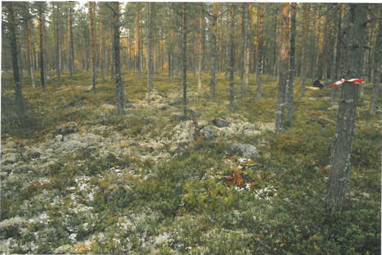
Kuva 5. Kohde 678010046 Laivavaara 2. Mahdollinen rökkiö. Kuvattu eteläkaakosta. Kiveyksen yli ajettu metsäkoneella. Kuvan oikeassa laidassa kohteen reunamerkintää.

Kohteesta ilmoitettujen koordinaattien osoittamalta paikalta tavattiin epämääräisesti kiviä halkaisijaltaan noin nelimetriseltä alueelta. Kyseinen ilmiö oletettiin tulkitun rökkiöksi. Tästä noin 30 metriä etelälounaaseen havaittiin kiveystä, jonka yli oli vasta ajettu metsäkoneella, ja joka on saattanut aiemmin olla tulkittavissa rökkiöksi. Ainuttakaan mahdollista asuinpaikkavallia ei havaittu. Hakkuuaukolla noin sata metriä mahdollisista rökkiöistä länteen oli havaittavissa mahdollinen rakkakuoppa, mutta kyseinen kuoppa voi olla myös metsänhoitotöissä syntynyt. Kaikkiaan kohde oli hyvin vaikeasti havaittavissa ja ainakin osittain metsänhoitotöiden yhteydessä tuhoutunut. Kohteesta rajattiin eläviin puihin soiduilla punavalkoisilla merkintänauhoilla noin 15 m x 30 m laajuinen alue, jolle kohteen molemmat mahdolliset rökkiöiden jäännökset sisältyivät. Alueen lyhyempien sivujen keskikohtien koordinaatit ovat p = 7163 712 ja i = 3384 244 ja p = 7163 746 / i = 3384 266.