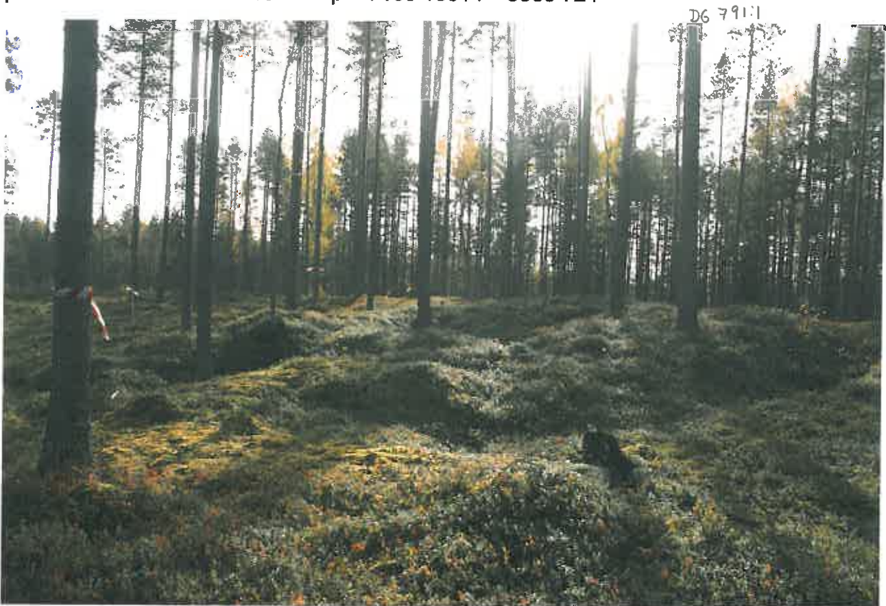
Kuva 4. Kohde 1000007565 Pirttivaara 4. Tervahauta merkittynä. Kuvattu pohjoisesta. Tervanlaskuoja ja alueen reunamerkinnyt erottuvat selvästi kuvan vasemmassa laidassa.

p = 7163 164 / i = 3384 740 p = 7163 168 / i = 3383 724