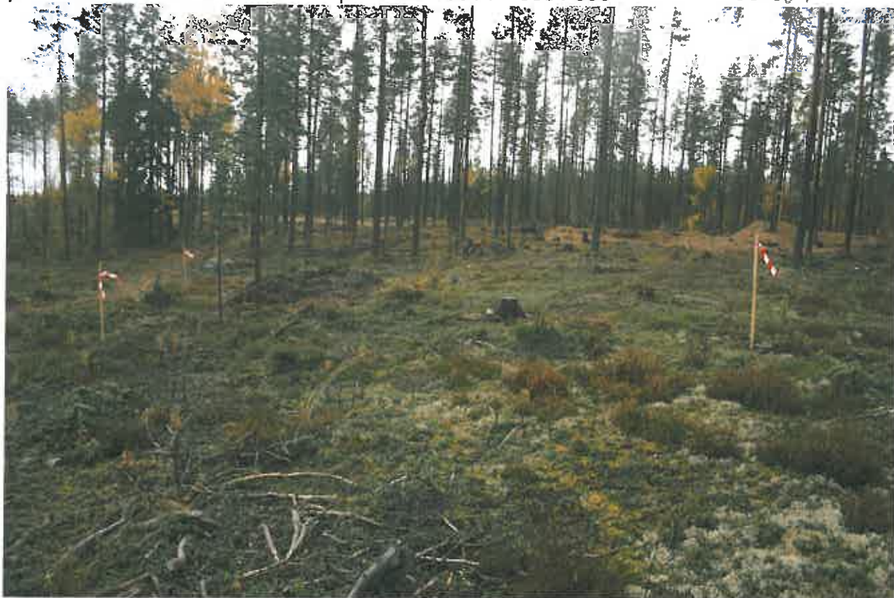
Kuva 11. Kohde 1000007636 Kauniinmetsänniitty 1. Kuvattu eteläkaakosta. Asuinpaikan lounaisosaa. Hiekkakasat kuvan oikeassa laidassa vuoden 2007 kaivausalueen vieressä.