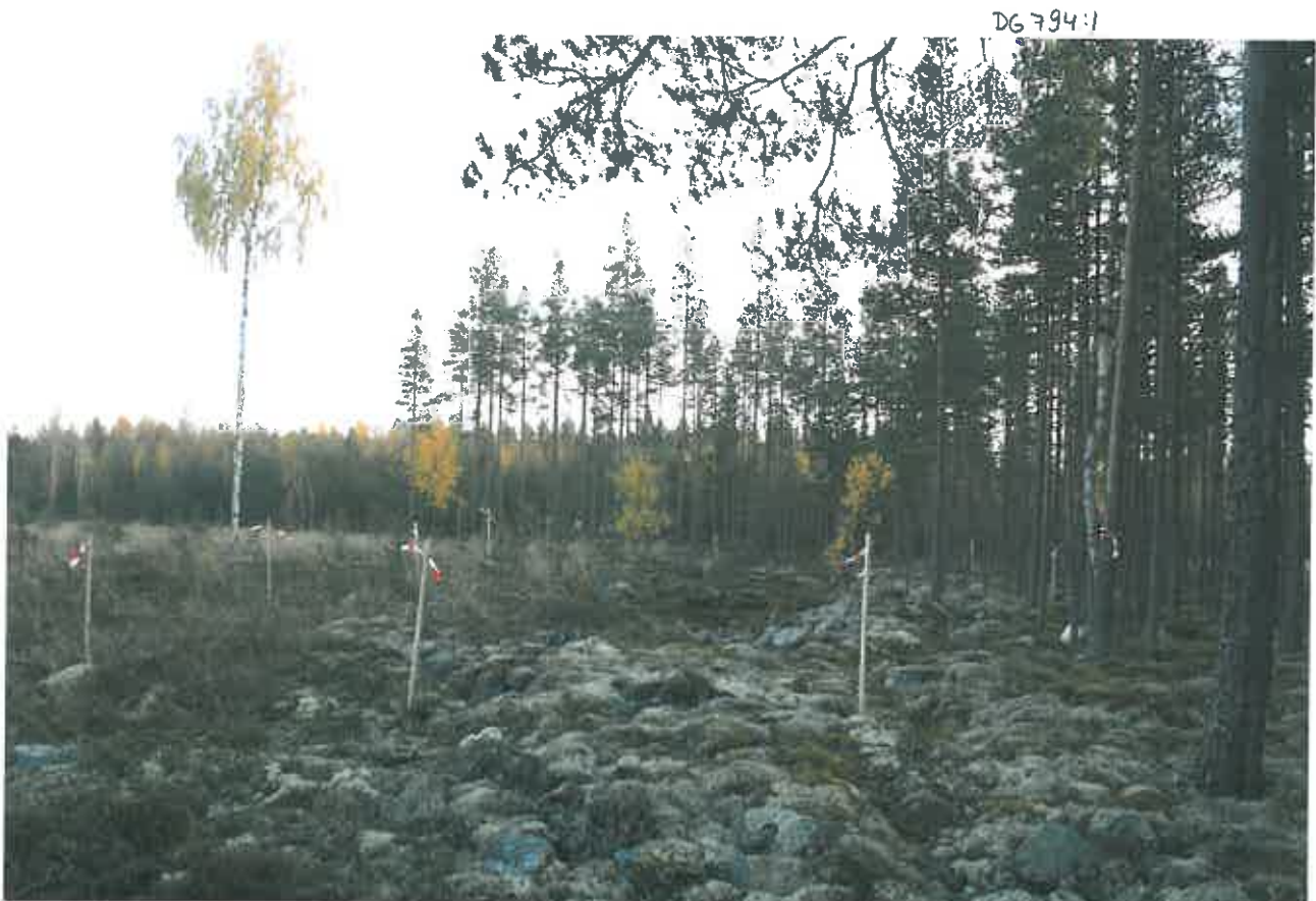
Kuva 7. Kohde 1000007613 Laivavaara 5. Pohjoisempi kohteen kahdesta asumuspainanteesta tai kehävallista merkinnän jälkeen. Kuvattu pohjoisluoteesta. Asumuspainanne tai kehävalli on osittain vaurioitunut metsänaurauksessa.