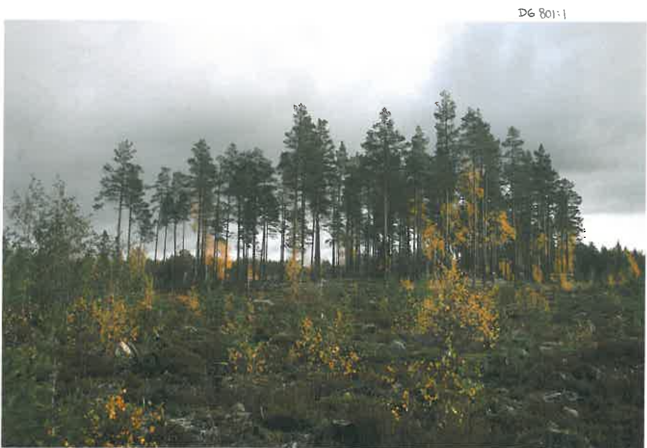
Kuva 14. Kohde 678010018 Pirttihaudankangas. Kuvattu länsilounaasta. Jätinkirkko sijaitsee Pirttihaudankankaan laella, männikössä hakkuuaukean keskellä.

p = 7162 394 / i = 3383 983 p = 7162 366 / i = 3383 976