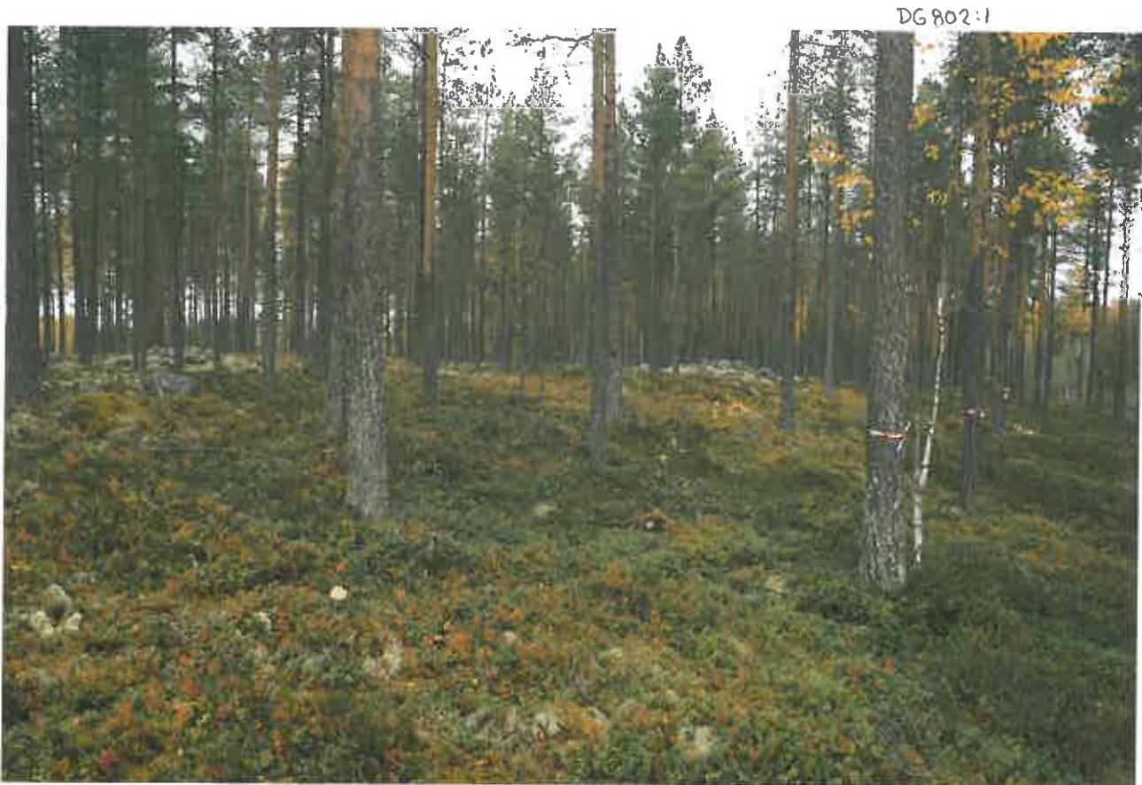
Kuva 15. Kohde 1000007521 Pirttihaudankangas 2. Kuvattu kaakosta. Röykkiöalueen itäosaa ja kuvan vasemmassa laidassa muinaisjäännösalueen reunamerkitöjä.

p = 7162 583 / i = 3383 813 p = 7162 452 / i = 3383 820