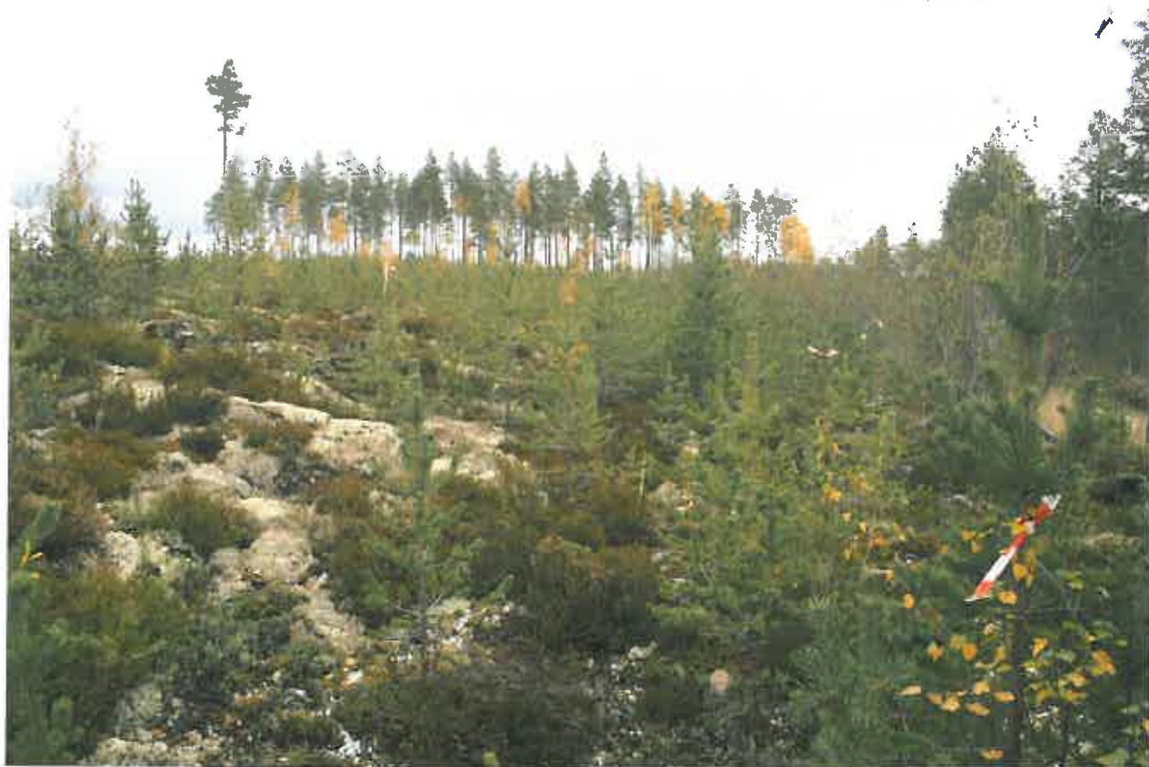
Kuva 16. Kohde 1000007569 Pirttihaudankangas 3. Kuvattu etelästä. Asuinpaikan itäosan rinnettä ja reunamerkintöjä. Taustalla metsäsaarekkeessa Pirttihaudankankaan jätinkirkko.