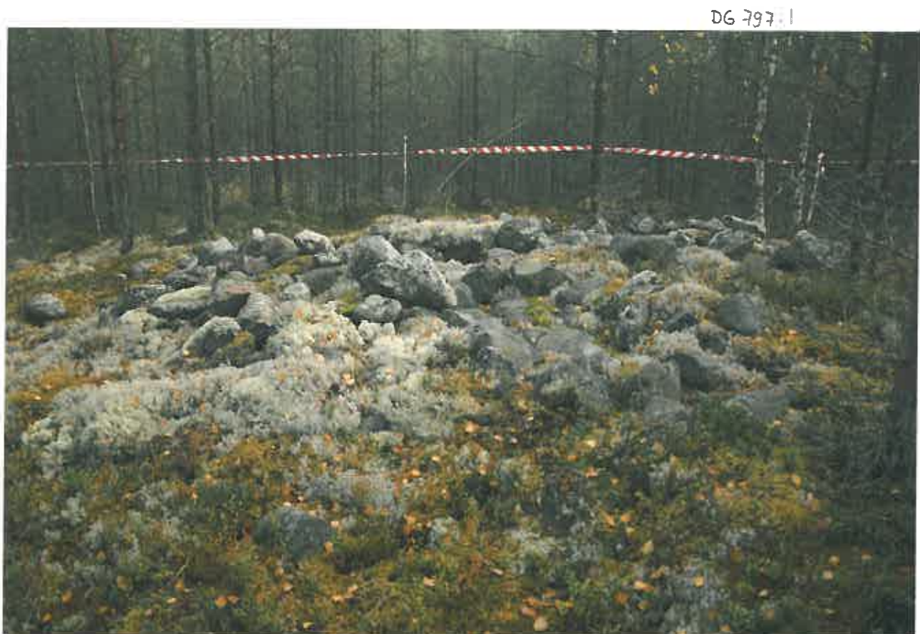
Kuva 10. Kohde 678010019 Kauniinmetsänkangas. Kiviröykkiö. Kuvattu luoteesta. Taustalla näkyy merkintää kohteen suoja-alueen kaakkoisreunalla.

Halkaisijaltaan vähintään viisimetrinen komea kiviröykkiö sijaitsee kapealla kankaalla aivan itä-länsi-suuntaisen ajo-uran pohjoispuolella. Röykkiö merkittiin yhtenäisellä puna-valkoisella merkintänauhalla, ja röykkiön ympärille rajattiin suoja-alue, jonka leveys on keskimäärin noin neljä metriä. Röykkiön ympärille rajattu alue on siis muodoltaan jokseenkin pyöreä ja läpimitaltaan hieman alle 15-metrinen.