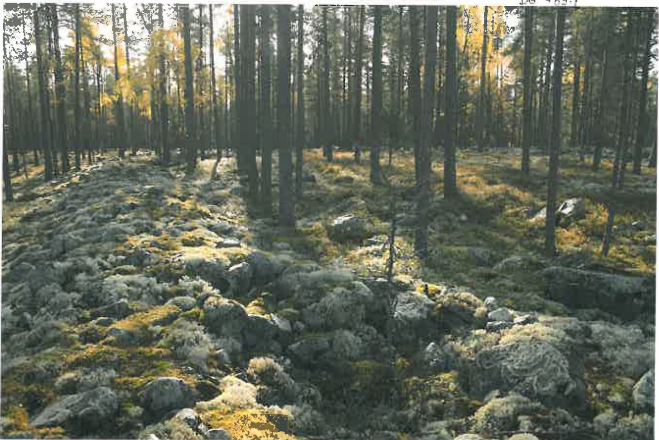
Kuva 2. Kohde 678010001 Pirttivaara. Jätinkirkon itäreunan vallia. Kuvattu pohjoisesta.