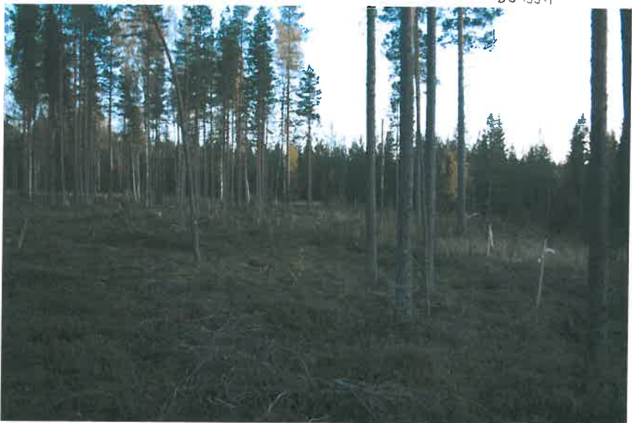
Kuva 12. Kohde 1000007637 Kauniinmetsänniitty 2. Kuvattu pohjoisesta, alueen luoteisnurkalta. Asuinpaikka sijoittuu länteen laskevan rinteän hiekkaiselle tasanteelle.