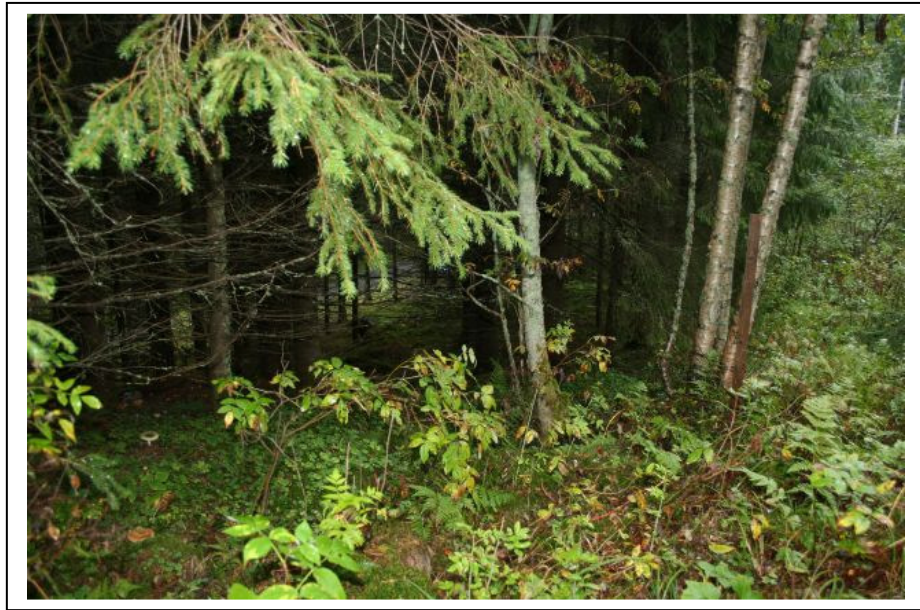
DG2232:2 Uusi linjaus oikaisee pienen mutkan jyrkässä rinteessä. Idästä.