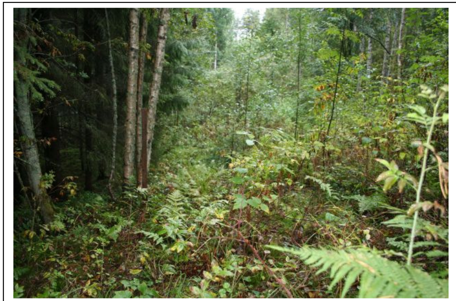
DG2232:3 Koekuoppia kaivettiin pienelle tasanteelle rinteessä, rinne nousee edelleen itään. Eteläkaakosta.