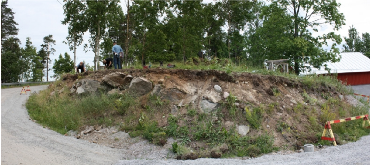
DG1141:7 Panoraamakuva vuosien 2009 ja 2010 kaivausalueen huoltotien törmällä.