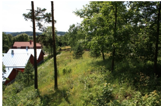
Vasemmalla DG1141:1 Näkymä pohjoisesta kirkolta päin huoltotielle. Taustalla Rikala. Kuva Ville Rohiola/Museovirasto 2009, oikealla DG1141:2 Kirkkomäen itärinnettä, jossa kaivettiin vuonna 2008 polttokalmistoa. Pohjoisesta. Kuva Ville Rohiola/Museovirasto 2009.