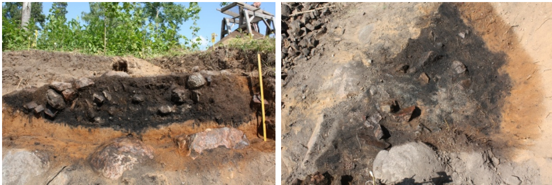
Vasemmalla DG1141:64. Huoltotien penkassa roikkuneen liedän profiili turve- ja peltomultakerroksen poiston jälkeen. Länneestä. Kuva Satu O'Ceallacháin/Museovirasto. Oikealla DG1141:72. Kuoppaliesi tasossa 5 kaivausalueella 2 vuonna 2009. Etelästä. Kuva Satu O'Ceallacháin/Museovirasto

uudemman ajan maankäytöstä kertova osin savensekaisella maalla täytetty jätekuoppa tai muu kaivanto. Liedestä ei saatu talteen ajoittavaa esineistöä, mutta sen etelälaidalta löytyi poikkileikkauksestaan pyöreä, hiukan toisesta päästä levenevä metallilevystä taivutettu onttola, jonka sisällä oli puuta (KM 38083:434). Rakenteesta on otettu kaksi radiohiiliajoitusnäytettä, mutta niitä ei ole varojen puutteen vuoksi analysoitu kuten ei myöskään kaivauksilta otettuja makrofossiilinäytteitä.