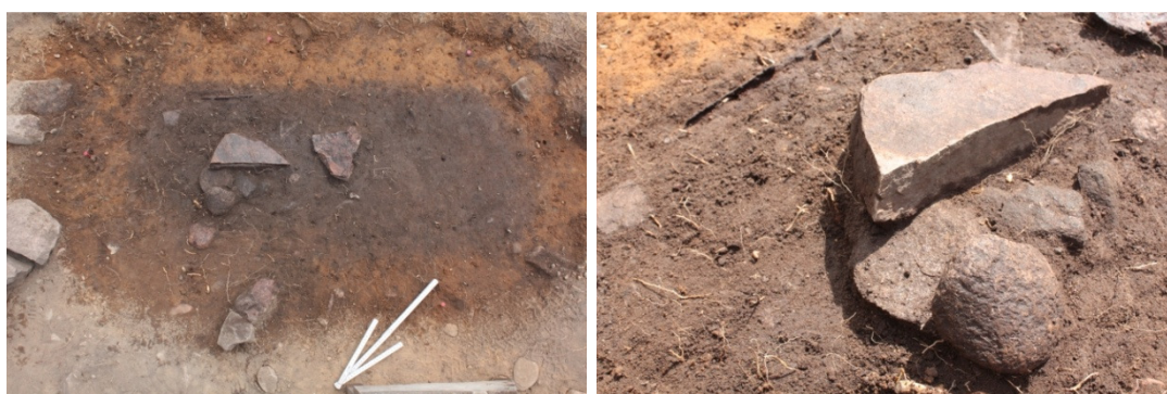
Vasemmalla DG2102:73. Hauta D tasossa 4. Luoteesta. Kuva Ville Rohiola/Museovirasto. Oikealla DG2102:78. Kuvassa veitsimäinen heittokeihäänkärki KM 38540:234 in situ haudan D koillispäädyssä tasossa 4. Kuvattu pohjoisesta. Kuva Ville Rohiola/Museovirasto.

Hauta D sijaitsi koordinaattiruutujen 4986-4987/980-981 alueella. Sen maksimipituus oli vain 135 cm ja leveys 40 cm. Hautakuopan maksimisyvyys oli noin 70 cm. Hauta D tuli osittain esille dokumentointitasossa 4 vuoden 2009 kaivausalueen pohjoisosasta. Vuonna 2010 avatun alueen dokumentointitasossa 3 hautaa D ympäröivässä harvassa kiveyksessä oli selvä suorakaiteen muotoinen aukko eli hauta lienee kaivettu kiveyksen läpi. Haudan D pituus akseli kulki lounaasta kaakkoon eli se poikkeaa hieman hautojen A, B ja C pituus akselista. Haudan koillispäässä oli selvä kiveys, jossa oli lähes kolmionmuotoinen heikosti punertavaa hiekkakiveä oleva laakakivi. Haudassa oli lisäksi kaksi muuta laakakiveä.