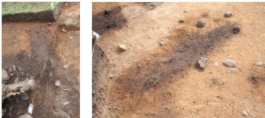
Vasemmalla DG2102:69. Haudan C koillispää tasossa 3, lounaispää tasossa 4. Lännestä. Oikealla DG2102:70. Hauta C tasossa 5. Pohjoiskoillisesta.

Hauta D sijaitsi koordinaattiruutujen 4986-4987/980-981 alueella. Sen maksimipituus oli vain 135 cm ja leveys 40 cm. Hautakuopan maksimisyvyys oli noin 70 cm. Hauta D tuli osittain esille dokumentointitasossa 4 vuoden 2009 kaivausalueen pohjoisosasta. Vuonna 2010 avatun alueen dokumentointitasossa 3 hautaa D ympäröivässä harvassa kiveyksessä oli selvä suorakaiteen muotoinen aukko eli hauta lienee kaivettu kiveyksen läpi. Haudan D pituus akseli kulki lounaasta kaakkoon eli se poikkeaa hieman hautojen A, B ja C pituus akselista. Haudan koillispäässä oli selvä kiveys, jossa oli lähes kolmionmuotoinen heikosti punertavaa hiekkakiveä oleva laakakivi. Haudassa oli lisäksi kaksi muuta laakakiveä.