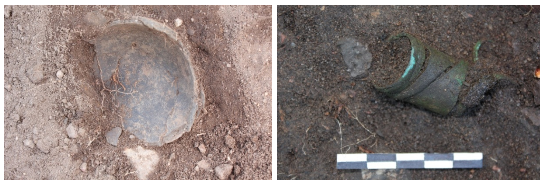
Vasemmalla DG2102:80. Saviastian pohja haudan D lounaispuolella. Koillisesta. Kuva Ville Rohioli/Museovirasto. Oikealla DG2102:87. Pronssisormus KM38540:232 in situ haudan D lounaispuolella. Kuvattu luoteesta. Kuva Ville Rohioli/Museovirasto.