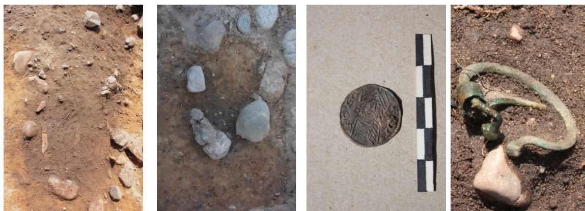
Vasemmalta oikealle DG2102:104. Hauta E:n lounaisosa tasossa 5. Koillisesta. DG2102:113. Kivikehä haudan E jalkopäässä. Pohjoisesta. DG2102:117 Tanskalainen hopearaha KM38540:250. DG2102:107 Hevoskenkäsolkki KM38540:251 haudan E kaakkoisreunasta. Kuvattu idästä.