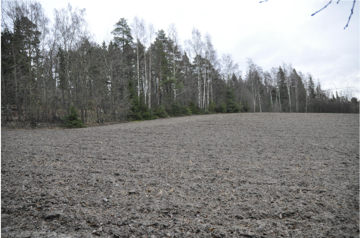
Kuva 1. Norrbergetin eteläpuolisen pellon kivikautinen asuinpaikka.