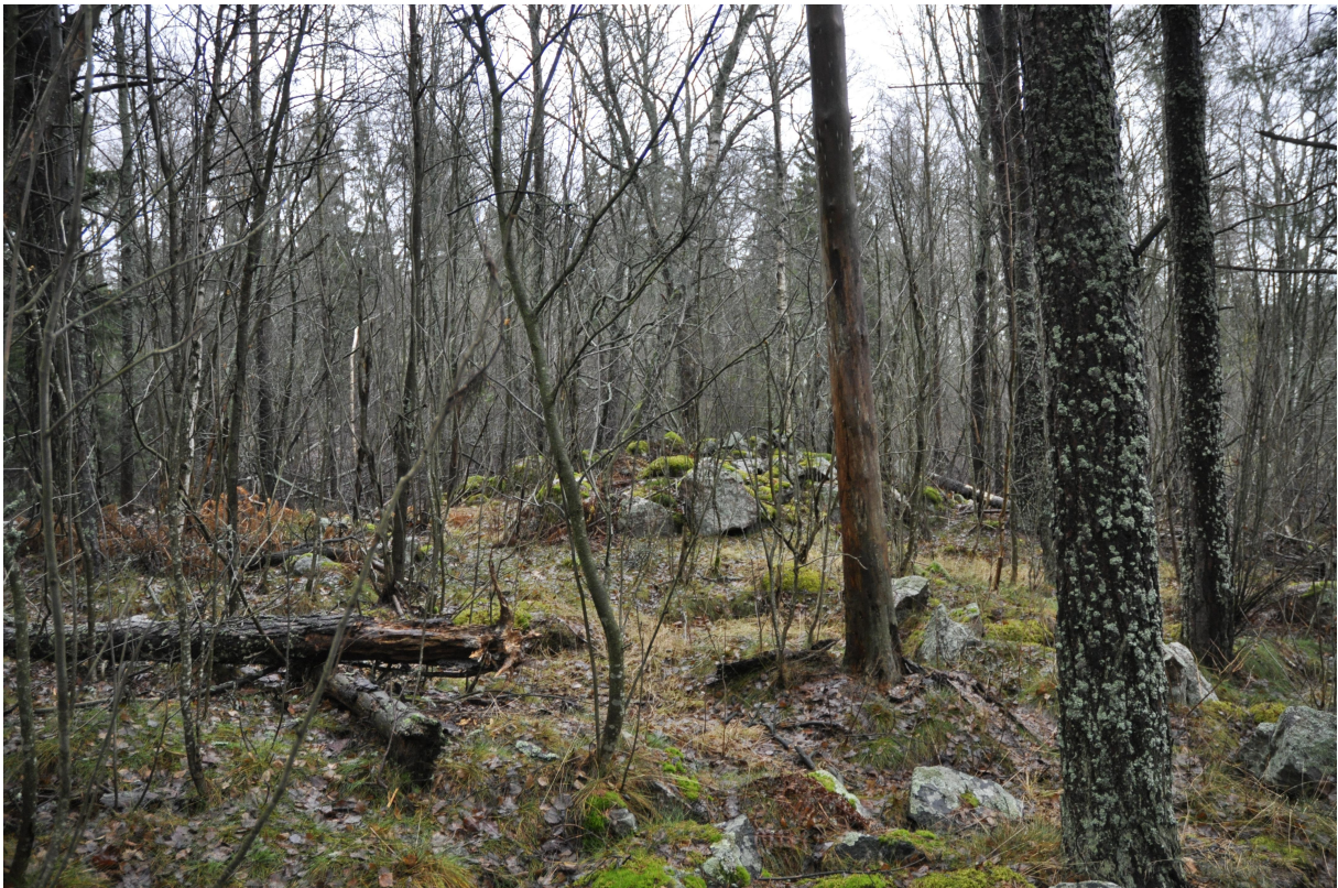
Kuva 2. Norrbergetin etelärinteessä sijainnut kivirakennelma.