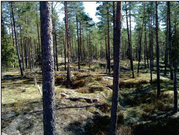
Voimalan 1:n huoltotien maastoa