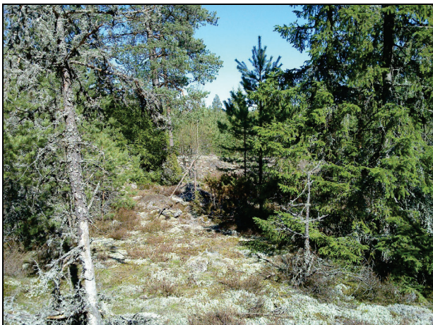
Voimalapaikka 4:n maastoa