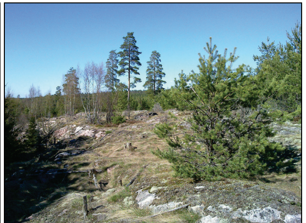
Voimalapaikka 5:n maastoa