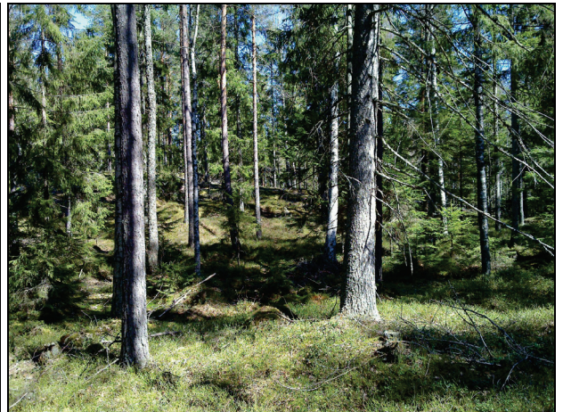
Voimalapaikka 2 taustan kumpareella