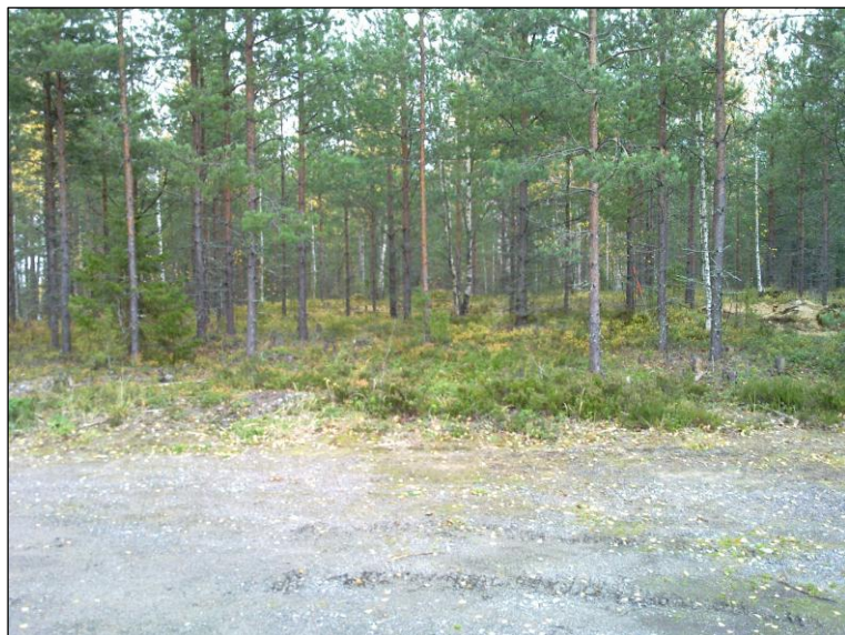
Asuinpaikka sijaitsee kuvan keskellä tien levennyksen takana.