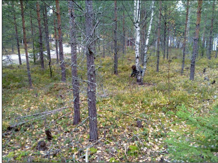
Asuinpaikkaa koilliseen, alla itään