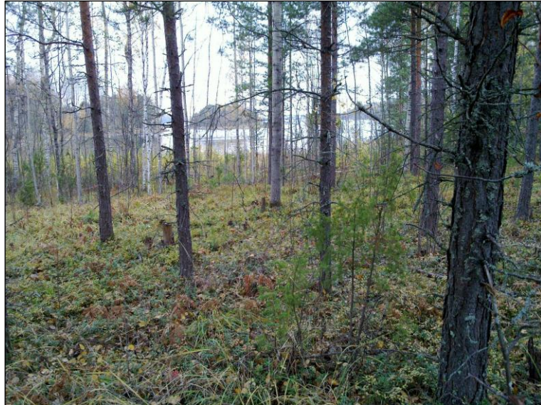
Asuinpaikkaa etualalla, taaempänä matala törmä ennen nykyistä rantatasannetta.