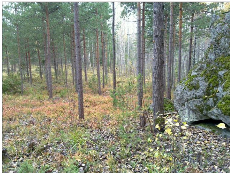
Asuinpaikka taustalla alemmalla tasolla, koillispäästä etelä-lounaaseen.