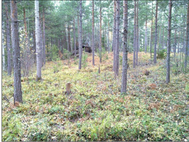
Asuinpaikkaa kuvan alalla, Marjolan suuntaan pohjois-koilliseen.