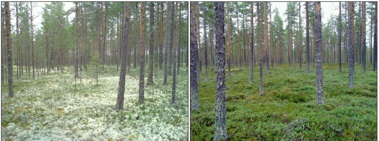
Linjan eteläosan dyynikentän maastoa Kiviharjun maastoa linjan kohdalla, pohjoiseen