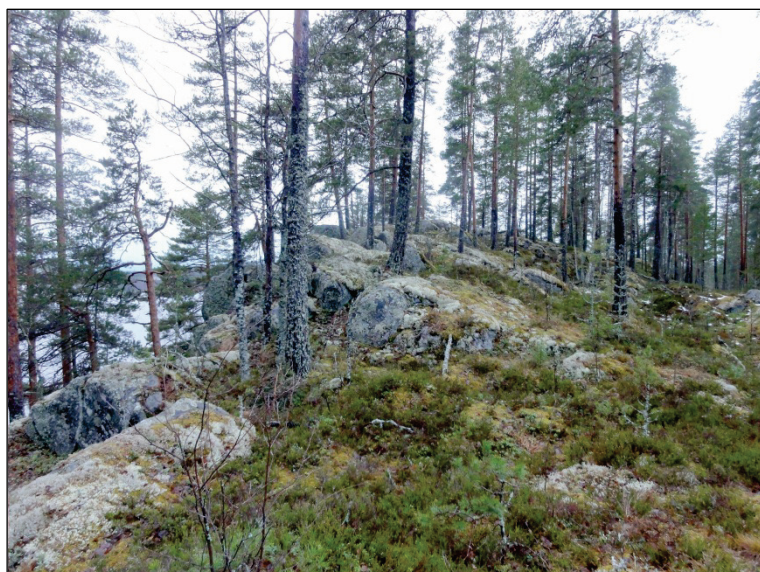
Pitkä-Pekanniemen kärjen kalliota