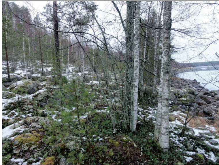
Valkeislahden länsipuolista rantaa