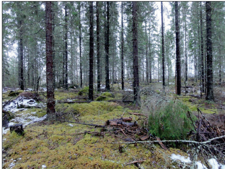
Pitkä-Pekanniemen kärjen kallion itä-kaakkoispuolista lakitasannetta