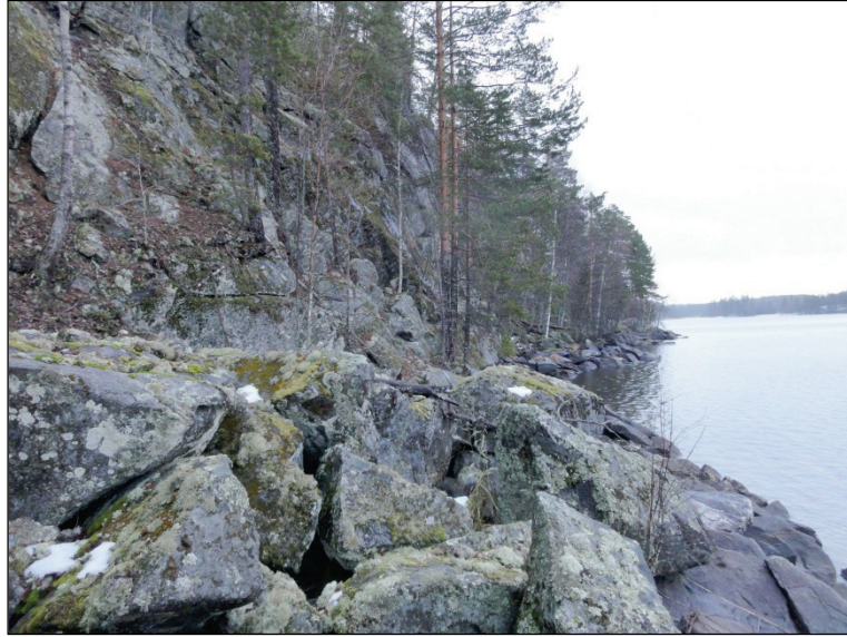
Pitkä-Pekanniemen kärjen kalliota