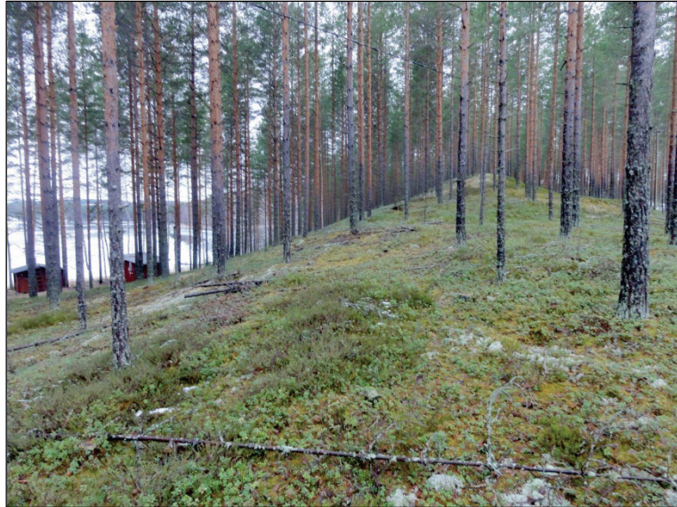
Käkötaipaleen länsipuolisen rannan harjannetta