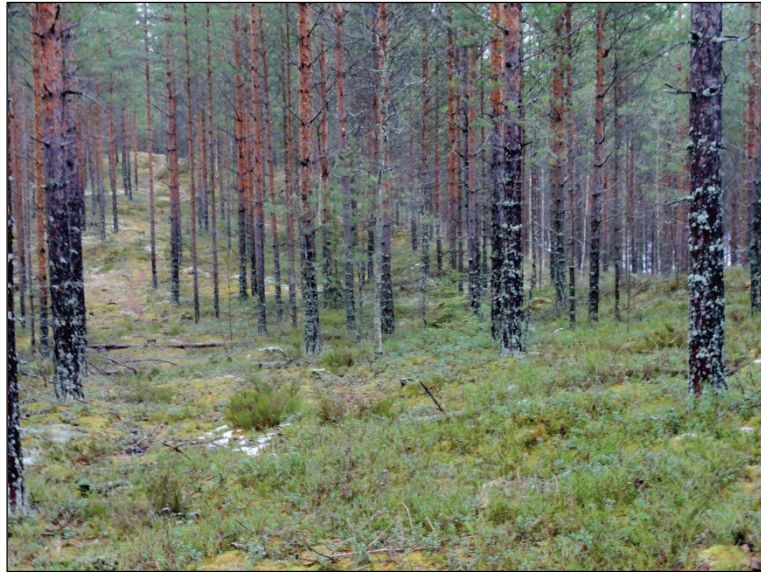
Alueen länsipäässä rantaharjanteessa oleva leventymä