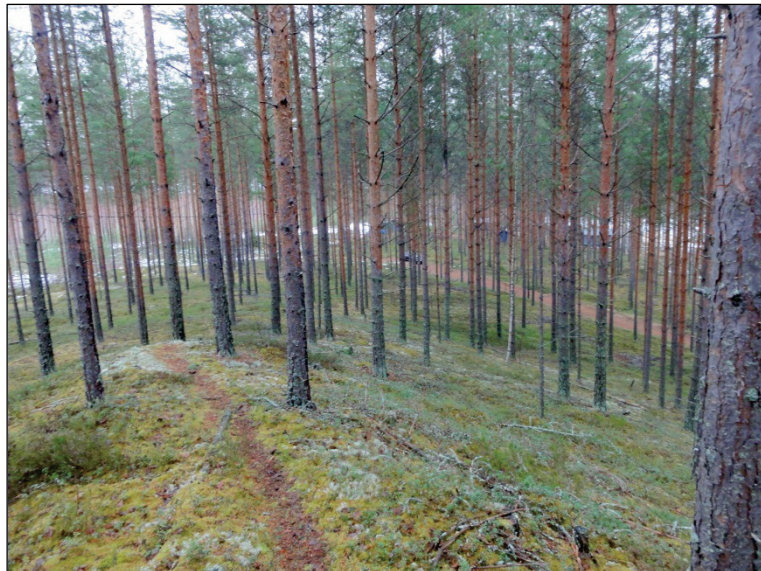
Harjanteen itäpuolista maastoa