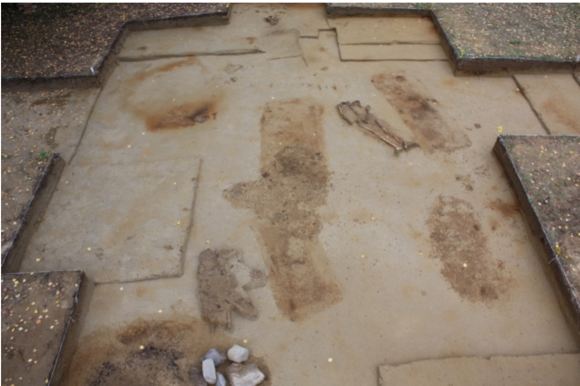
DG1450:149, Hauta 9 kuvan oikeassa alalaidassa. Idästä (ylhäältä kuvaustornista).

Hauta 9 tuli esille tasossa 3 (kartta 17). Hautakuoppa oli aluksi melko selkeä suorakaide, jonka länsipäässä ja keskivaiheilla oli kolmionmuotoiset sekoittuneen maan alueet. Tasossa 4 hautakuopan muoto muuttui