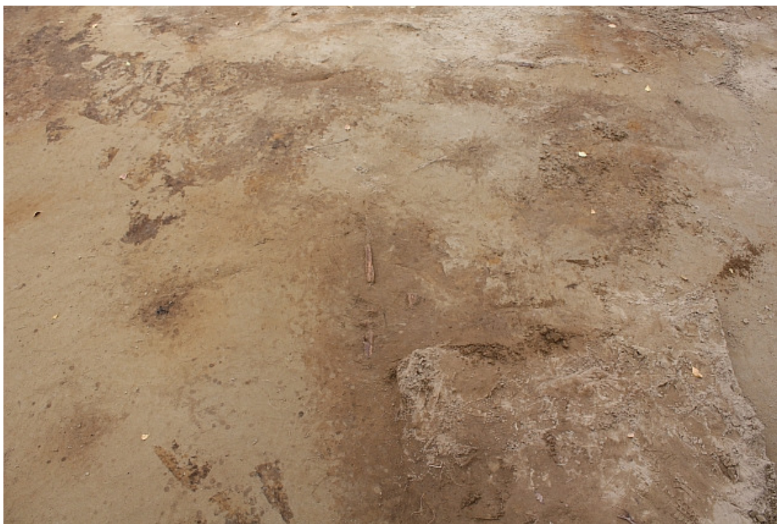
DG1450:301. Haudan 4 hahmo haudan 5 jalkopäässä tasossa 2. Kuvattu lännestä.

Hauta 4:n kuvio tuli esille tasossa 2 (kartta 16), peltomullan läikkien täyttämänä suorakaiteena. Ilmiön tulkinta haudaksi perustuu täysin läikän kokoon ja muotoon. Todennäköisesti vuonna heinäkuussa 1886 tuhotun haudan kuoppa.