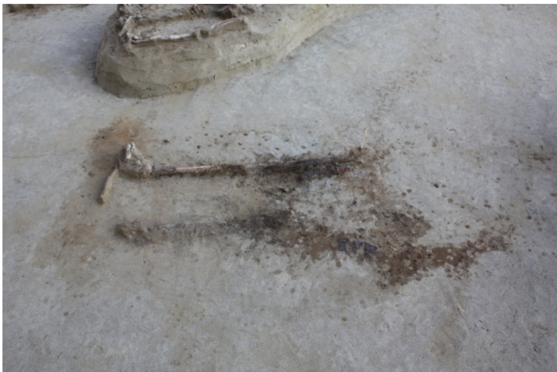
DG1450:223. Hauta 2 tasossa 7. Kuvattu etelästä. Takana hauta 1 korkeella.

Hauta 2 tuli esille tasossa 2 (kartta 16), jossa sen länsipää erottuu selvästi punertavan vaaleanruskeana likamaana vaaleasta pohjahiekasta. Koko haudan itäpää oli peltomullasta, orgaanisesta aineesta sekä keltaisesta ja harmaasta hiekasta muodostuneen kerroksen alla. Myöhemmin kävi ilmi sekoittuneen alueen tuhonneen haudan pääpuolen eli itäpään kokonaan. Vainajasta oli säilyneenä oikean jalan reisi- ja sääriluut sekä nilkan ja jalkapöydän luita sekä vasemmasta jalasta sääri- ja nilkkaluita. Luut ovat pääsääntöisesti