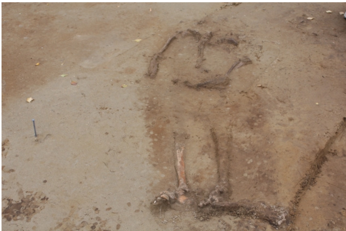
DG1450:175. Hauta 1 tasossa 3. Kuvattu koillisesta.

Kuvat: DG1450:122-133, 136, 138-146, 148-150, 153-157, 160-216 ja 669-670 Muuta: DNA-näyte