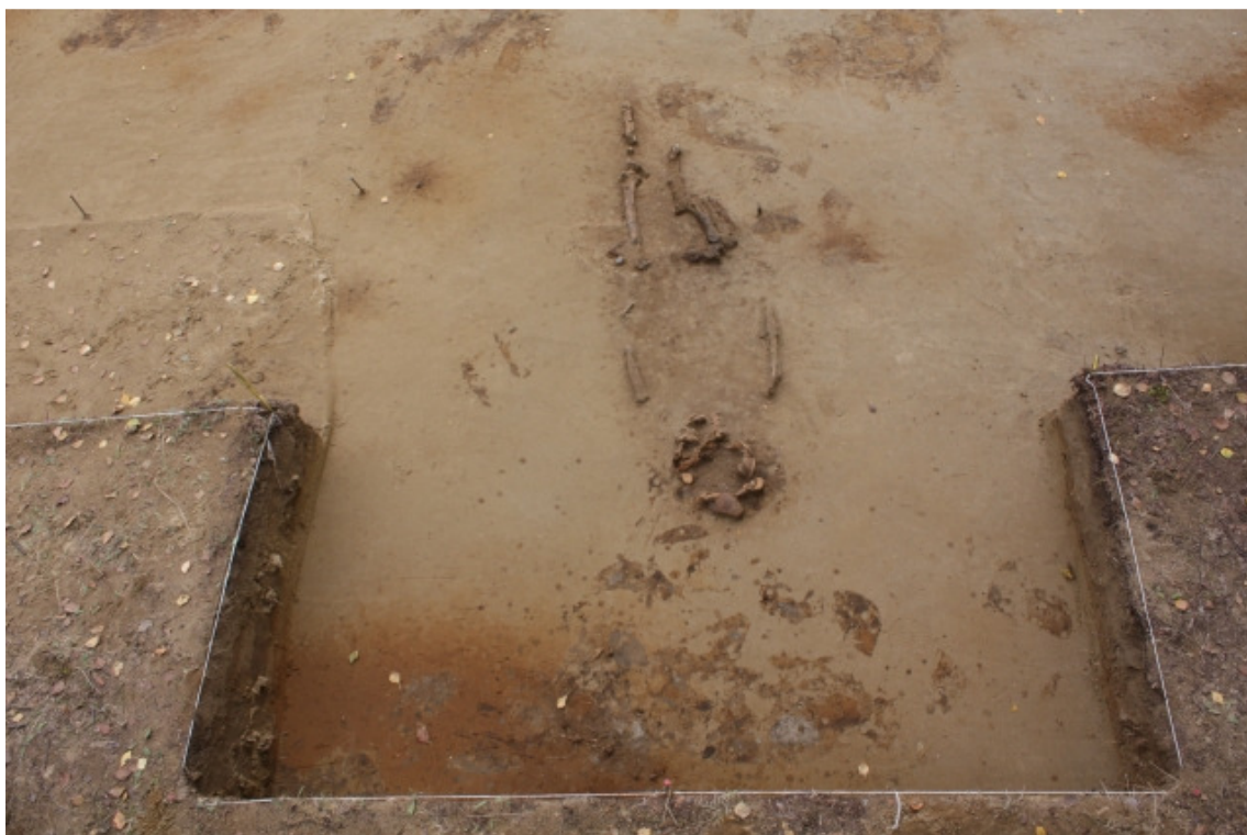
DG1450:315. Hauta 5 tasossa 3. Kuvattu lännestä.

Hauta 5 tuli esille tasossa 2 (kartta 16) pienen hiekkakumpareen alta alle 20 cm syvyydestä nykyisestä maanpinnasta. Haudan 5 osa meni länsiprofiiliin ja aluetta laajennettiin länteen haudan kokonaan esiin saamiseksi (kartta 36). Hautakuoppa oli lähes täysin länsi - itä –suuntainen ja vainajan pää oli lännessä. Kallo oli murskattu lapiolla ilmeisesti vuonna 1886 (kartat 39 ja 40). Vainaja on ilmeisesti asetettu haudan kasvat kohti pohjoista. Luurangosta oli säilynyt pääkallon lisäksi käsivarsien luita sekä reisiluut. Myös oikea sääriluu oli säilynyt. Haudan 5 vainajalla oli oikeassa reisiluussa on paha vamma. Reisiluu on mennyt kokonaan poikki ja luun päät ovat luutuneet kiinni toisiinsa rinnakkain. Vainaja oli menettänyt kuusi poskihammasta elämänsä aikana. Vain yhdessä hampaista oli reikä.