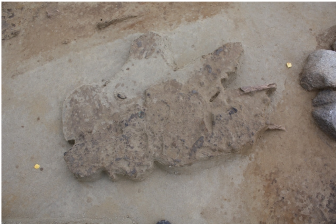
DG1450:418. Hauta 8 tasossa 4. Kuvattu etelästä. Kuva Esa Mikkola 2009, Museovirasto.

Kuvat: DG1450:124-125, 127, 129, 130-131, 134-137, 140, 142-146, 148-150, 152-159, 161-164, 410-446 Muuta: hiekka poistettiin vesisuihkua apuna käyttäen, orgaaninen aines otettiin talteen; poikkeuksellisen huonosti säilynyt verrattuna muihin 2009 löydettyihin esineellisiin hautoihin, DNA-näyte