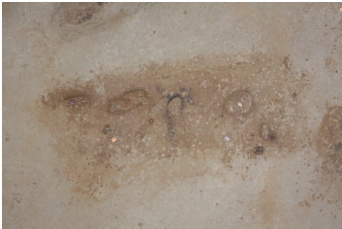
DG1450:357. Hauta 7 tasossa 5. Kuvattu pohjoisesta.