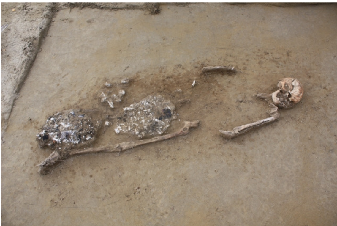
DG1450:284. Hauta 3/10/12 tasossa 9. Kuvattu pohjoisesta. Kuva Esa Mikkola 2009, Museovirasto.

Hauta 3/10/12 tuli esille tasossa 2 (kartta 16), jossa sen länsipää erottuu selvästi vaaleanruskeana likamaana vaaleasta pohjahiekasta. Koko haudan itäpää oli peltomultakerroksen peittämä. Tasossa kolme haudan pinnassa oli siellä täällä pieniä peltomultaläikkiä. Haudan keskivaiheilta sen itäpäähän täytemaa oli sekoittuneempaa kuin länsipäässä. Tasossa 5 haudan 3 arkun puut alkavat hahmottua ja tasossa 7 korkeudelta 93, 11 m mpy tuli haudan länsipäästä esille polttohauta H10. Polttohautaus oli tehty H3 vainajan jalkaterin väliin ja osittain oikean sääriluun päälle. Tasossa 9 korkeudelta 93,04 tuli esille toinen polttohauta H12. Se oli tehty H3 vainajan reisiluiden väliin. Isoja palaneen luun paloja oli myös H3:n vainajan oikean polven eteläpuolella. Hauta oli muuten löydötön lukuun ottamatta kallon sisältä löydettyä pientä pronssilevyn palaa, joka lienee täytemaalöytö. Osa hautojen 10 ja 12 palaneista luista on luetteloitu puhdistusvaiheen virheellisen merkinnän vuoksi tasolöytöjen joukkoon.