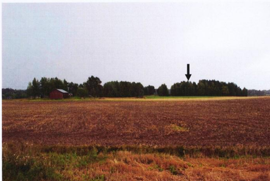
Kuva 1. Yleiskuva Ristimäestä. Oikealla oleva metsäsaareke on Särvän Ristimäki, jossa nyt löydetty kuppikivi sijaitsee. Kuppikiven sijainti saarekkeessa merkitty kuvaan nuolella. Kuvattu Särväntieltä kohti etelää.