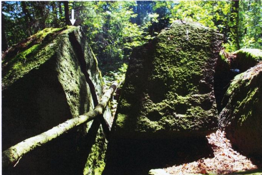
Kuva 2. Lähikuva Ristimäen kuppikivistä. Kivistä lohjenneessa, nyt lähes pystysuoraan olevassa osassa havaittavissa paririvissä yhteensä kahdeksan kuppia. Kaksi kuppia samoin vierekkäin alkuperäisessä asemassa säilyneen kiven laella (osoitettu kuvassa nuolella). Kuvattu etelään. Kuva J. Ruohonen.

Kuppikivi sijaitsee Särvän Ristimäellä, sen itäpuolelta olevalta pellolta mäen keskiosaan kulkevan metsätien läheisyydessä, noin 20 m etäisyydellä pellosta. Kivi on mäen laelle kulkevan polun varrella, siitä noin 3-4 metriä pohjoiseen, loivasti koilliseen viettävällä tasanteella.