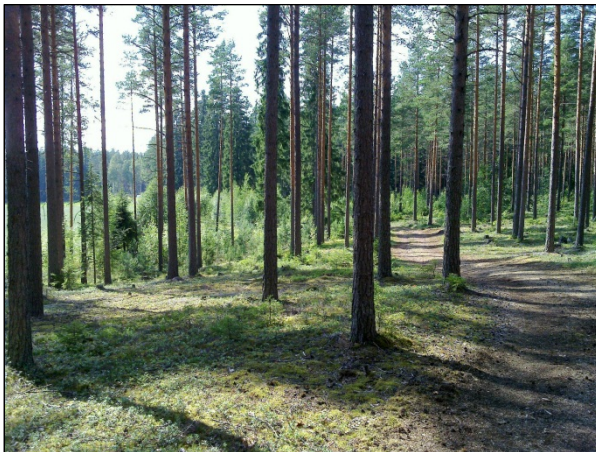
Alueen luoteisosaa luoteeseen

Alue hoidettua kangasmetsää. Ei uusia havaintoja. Vaikuttaa olevan kunnossa. Rajaus lienee arvio hyvällä varmuustoleranssilla. Muualla alueella en havainnut muinaisjäännöstä.