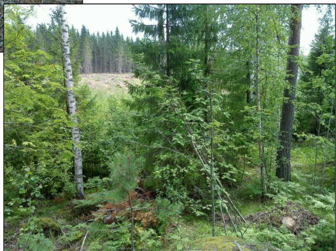
Asuinpaikkaa kalliolta Kaakkoon.