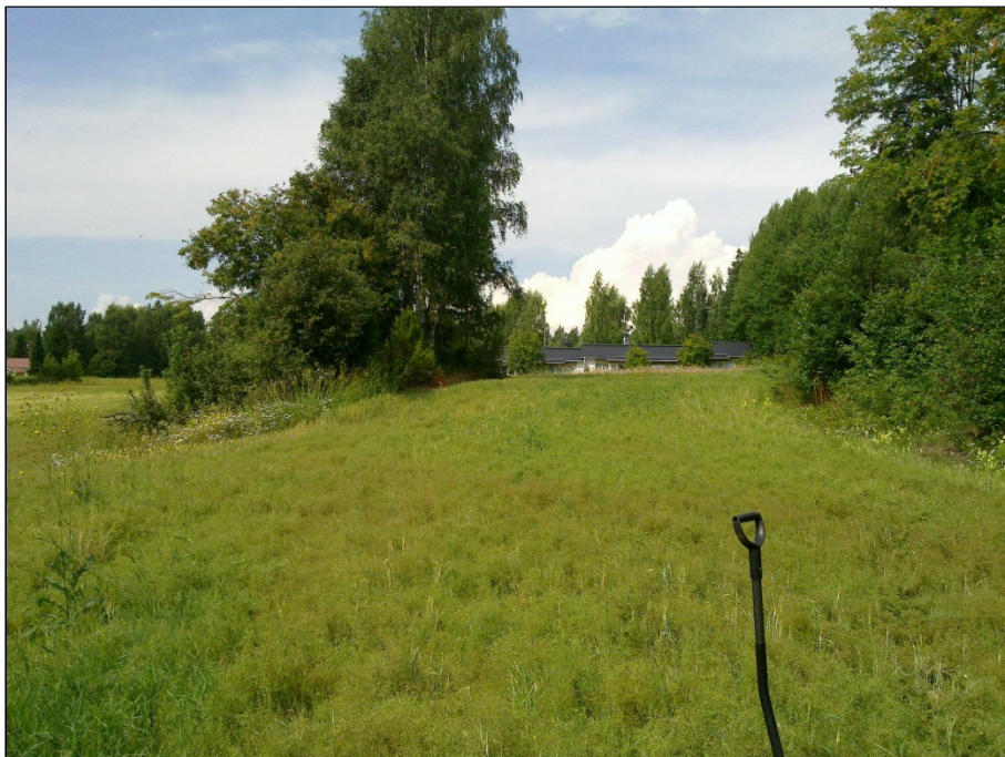
Löydöt peltosaarekkeen ja metsän väliltä. Kuvattu luoteeseen

Paikalla käydessäni pelto harvalla oraalla. Saattoi havainnoida kohtuullisesti. Mitään esihistoriaan viittaavaa en alueella havainnut. Alueen rajaus hyvin epäselvä.