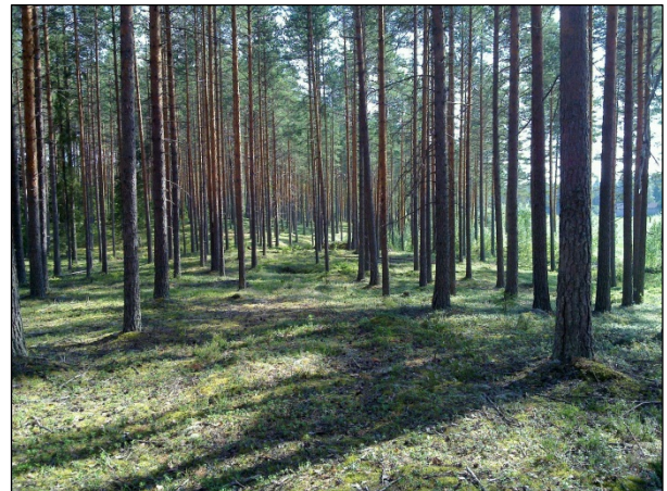
Alueen eteläosaa etelään