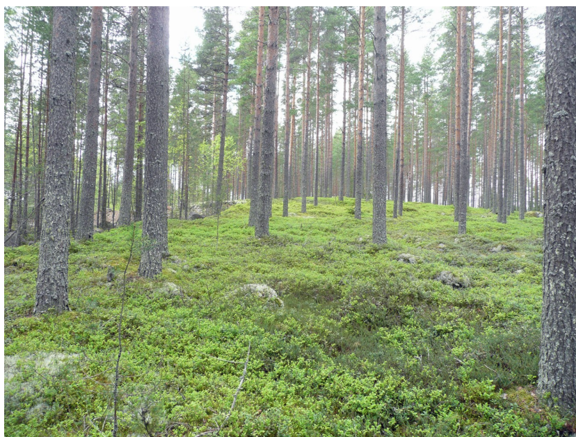
Kuva 2. Koskenkankaantien pohjoispuolella olevan hiekkakuopan reunaa. Kuopan reunalle tehdyissä koekaivannoissa ei esiintynyt merkkejä kivikautisesta asuinpaikasta. Kuva kaakosta.