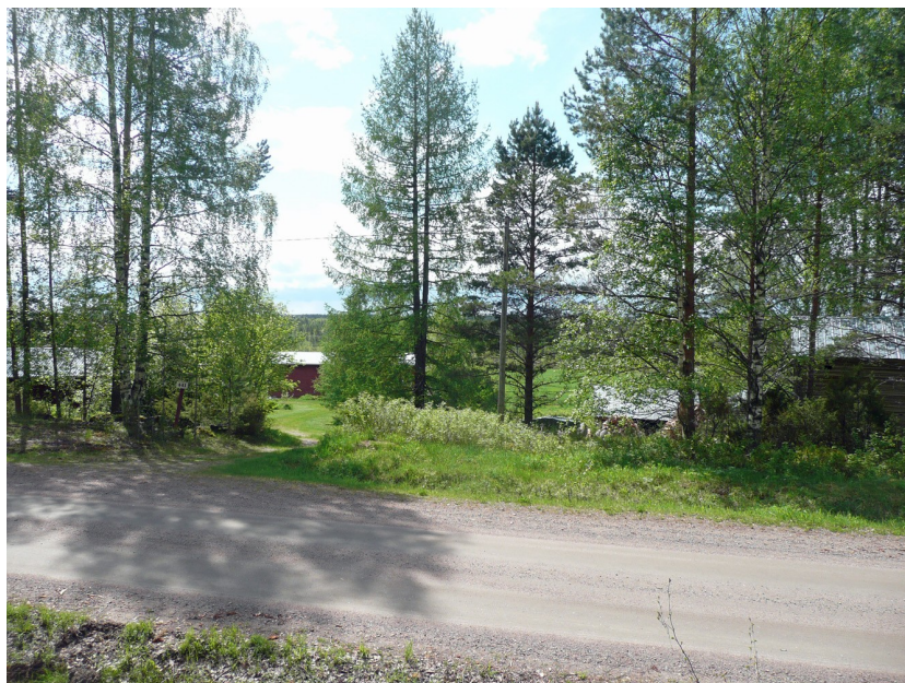
Kuva 1. Koskenkankaan kivikautisen asuinpaikan alue on mahdollisesti yltänyt nykyisten tilarakennusten alueelle. Kuva tilalle päin Koskenkankaantieltä pohjoisesta.

Ehdotus suoja-alueeksi: Tien eteläpuolella aiemman rajauksen mukaisesti. Tien pohjoispuolella muinaisjäännös on tuhoutunut maa-aineksen oton seurauksena ja suojavyöhykettä ei ehdota. Sähköjohtolinjauksen rakentamisella ei ole vaikutusta muinaisjäännökseen.