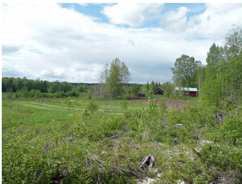
Kuva 3. Hautakankaan kohteessa on havaittu kvartseja talon eteläpuolelta kuvassa näkyvän kynnetyn alueen edestä. Kuva kaakosta.

Ehdotus suoja-alueeksi: Aiemman rajauksen mukaisesti. Sähkölinjan rakentamisella ei ole vaikutusta kohteeseen.