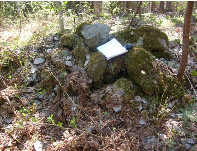
Kuva 644. Röykkiö 10. Etelään.