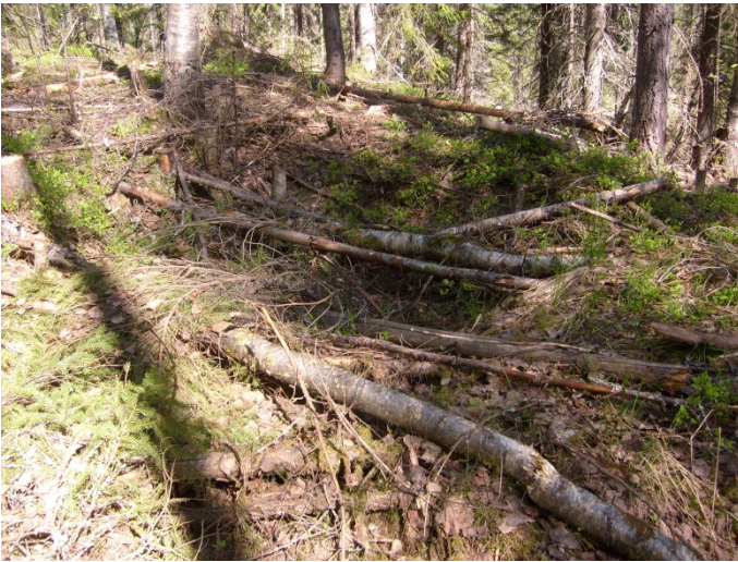
Kuva 613. Kuoppajäännös 1. Itään.