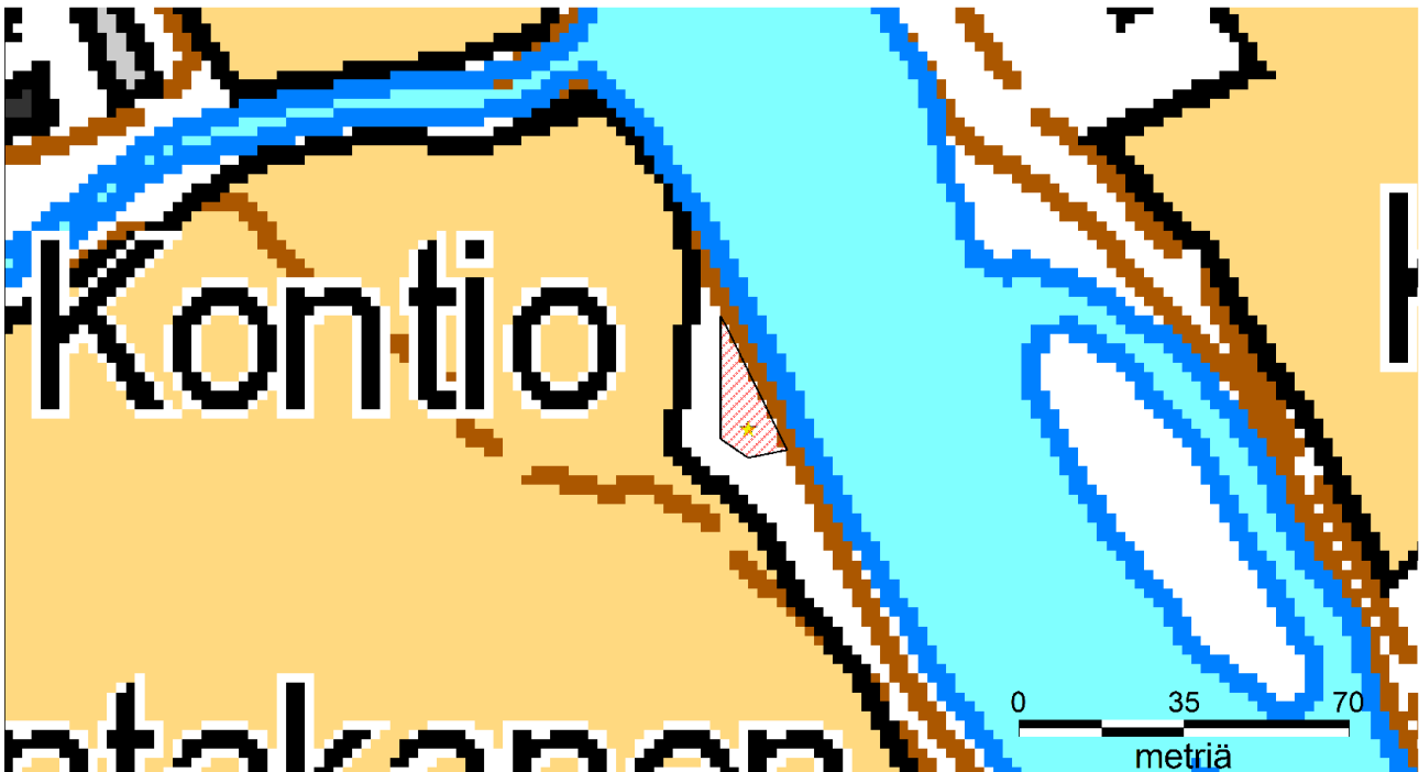
Kartta 2. Kontion myllynpaikan rajaus.