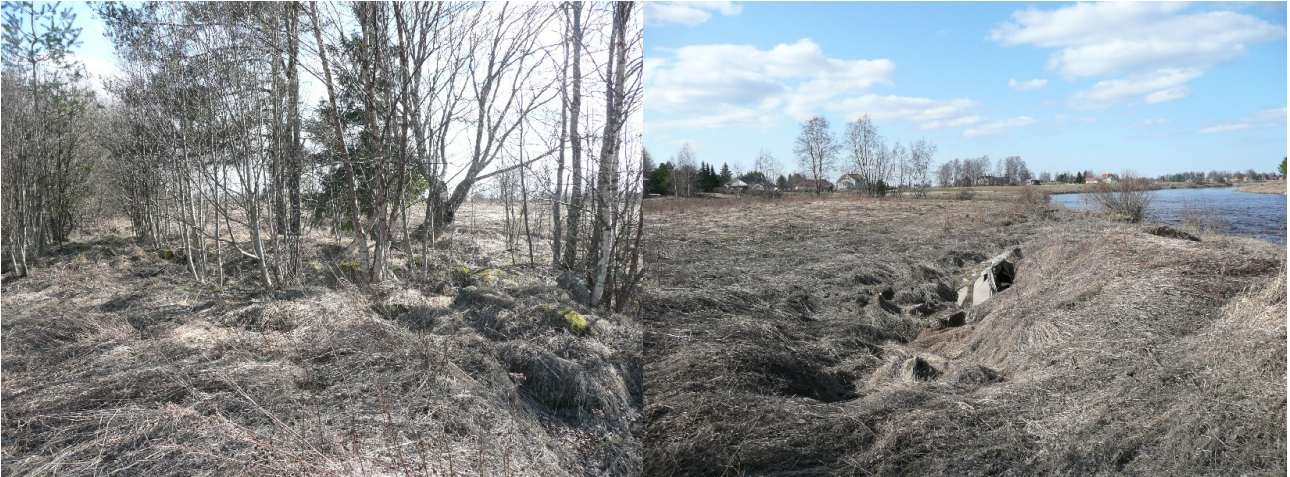
Kuva 1. Myllyn perustan kiveystä kuvattuna pohjoisesta. Kuva 2. Myllyn perustan länsipuolitse kulkeva entinen myllynoja. Kuva etelästä.