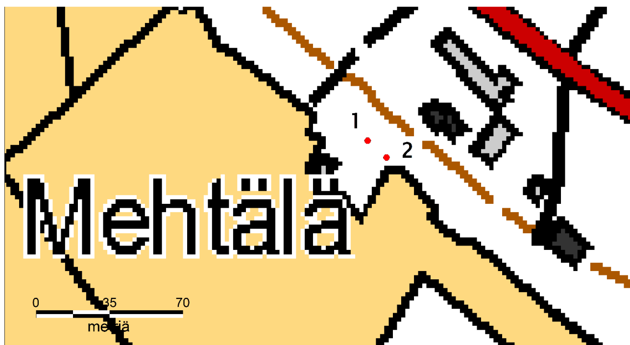
Kartta 3. 1. Pajan perusta 2. Kivikautinen nuolenkärkilöytö.