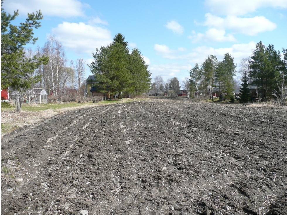
Kuva 5. Kuva lounaasta taltan löytöpaikalle. Taltan löytökohta talon eteläpuolella pellon reunassa.