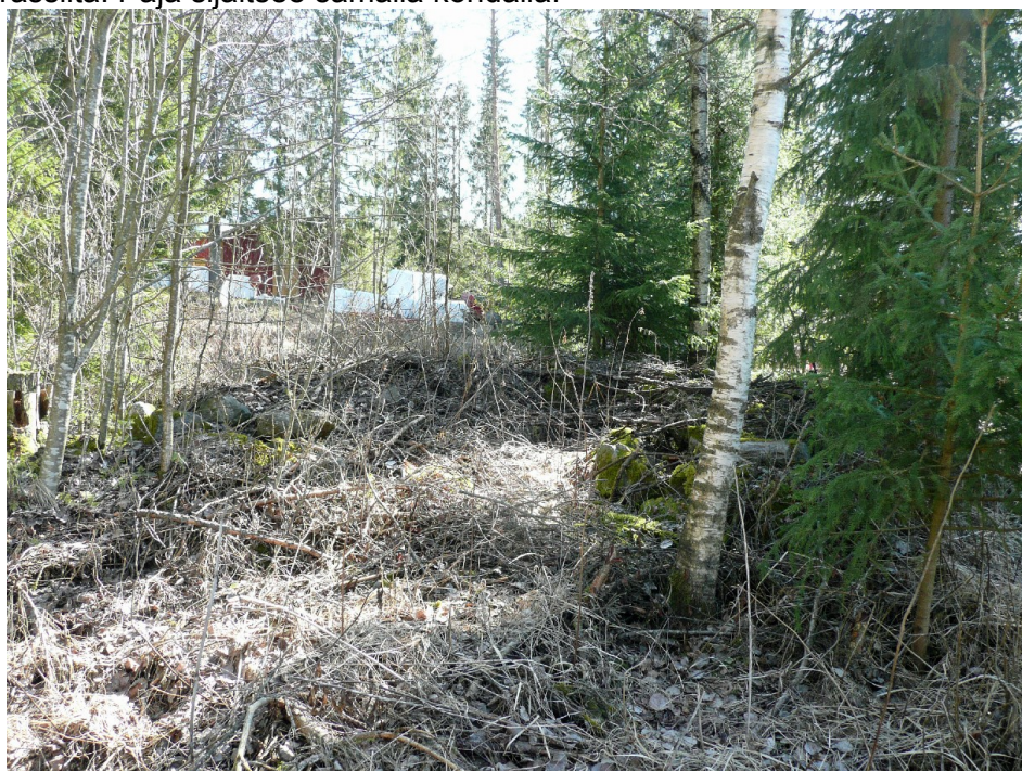
Kuva 8. Pajan perusta lännestä.