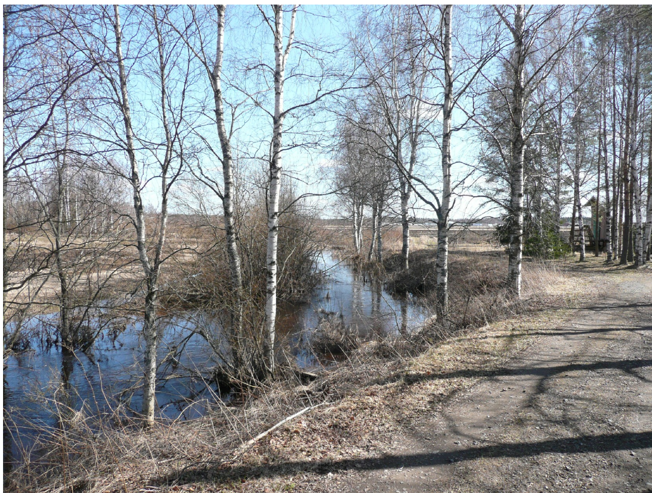
Kuva 4. Ojahaan löytöpaikka jokuoman takana olevalla pellolla. Kuva lännestä.

2011: Tarkastushetkellä alueen pelto oli kynnöksellä ja havaintomahdollisuudet hyvät. Havainnot esihistoriallisesta toiminnasta ei tehty. Topografian perusteella paikalla ei olettaisi olleen pitempikaista esihistoriallista toimintaa.