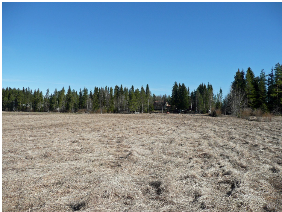
Kuva 7. Kuva Salonkankaan kohteeseen etelästä. Nuolenkärkilöytö talon lounaispuolelta pellolle laskevalta terassilta. Paja sijaitsee samalla kohdalla.

Ehdotus suoja-alueeksi: Kohteessa olevan pajan perustan ikä on alle sata vuotta. Ylivieskasta ei tunneta muita pajan jäänteitä ja siksi sille ehdotetaan 2 metrin suojavyöhykettä.