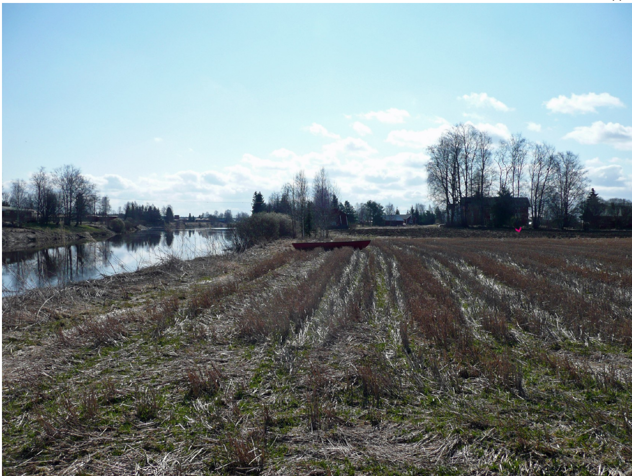
Kuva 3. Kvartsin löytöpaikka osoitettu nuolella. Kuva luoteesta.