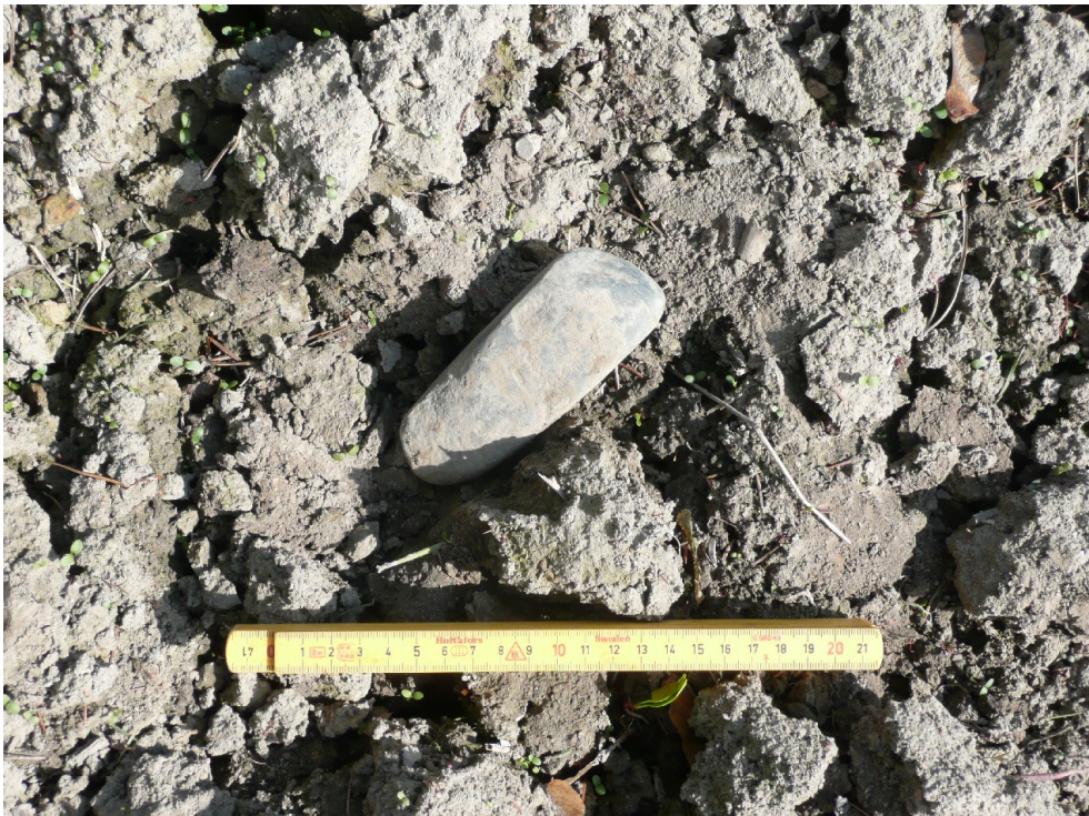
Kuva 6. Talttalöytö in situ.