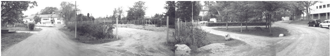
Kuva 5: Opettajien asuntolan koillispuolelta otettu panoraama suuntiin länsi-pohjoinen-itä (MV/RHO 125488:2-5). Kuvan vasemmassa reunassa, tien vasemmalla puolella Alueet 2 ja 3; aidan ympäröimänä urheilukenttä, jossa Alue 1; teiden rajaamalla nurmialueella Alue 4 ja oikeassa laidassa näkyvän Lagstadin koulun edustalla Koekuoppa 1.

Tutkittavalle alueelle tehtiin yhteensä 44 m 2 kaivantoja. Koeajat avattiin kaivinkoneella 2.6.2004 Museoviraston tutkijan valvoessa kaivamista. Ojat kaivettiin puhtaaseen pohjasaveen asti, lukuun ottamatta Alueen 1 Ojaa A. Kaivetut koeajat puhdistettiin lapiolla ja kaivauslastoilla, jonka jälkeen ne valokuvattiin ja tehdyt havainnot kirjattiin ylös. Koulun edustalle kaivettiin 7.6. lapioin ja lastoin 1 m x 1 m kokoinen koekuoppa, joka dokumentoitiin koeajien tavoin.