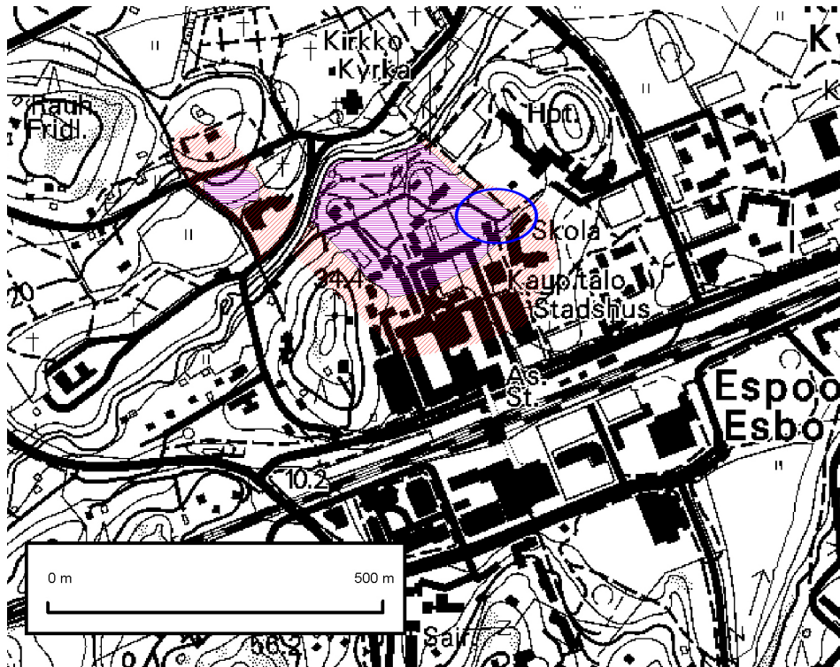
Kuva 4: Peruskarttaote, jossa näkyvät rasteroituina Espoon kaupunginmuseon tekemät Södrikin kylätontin ja sen suoja-alueen rajaukset sekä ympäröitynä koekaivauksissa 2004 tutkittu alue (PerusCD 2002: 203212; EKM 2000: MapInfo-tietokanta).

tarkoittaa tontin lähialuetta, jossa saattaa olla keskiaikaisia kerrostumia. (EKM 2000; Lindholm 2002:34.)