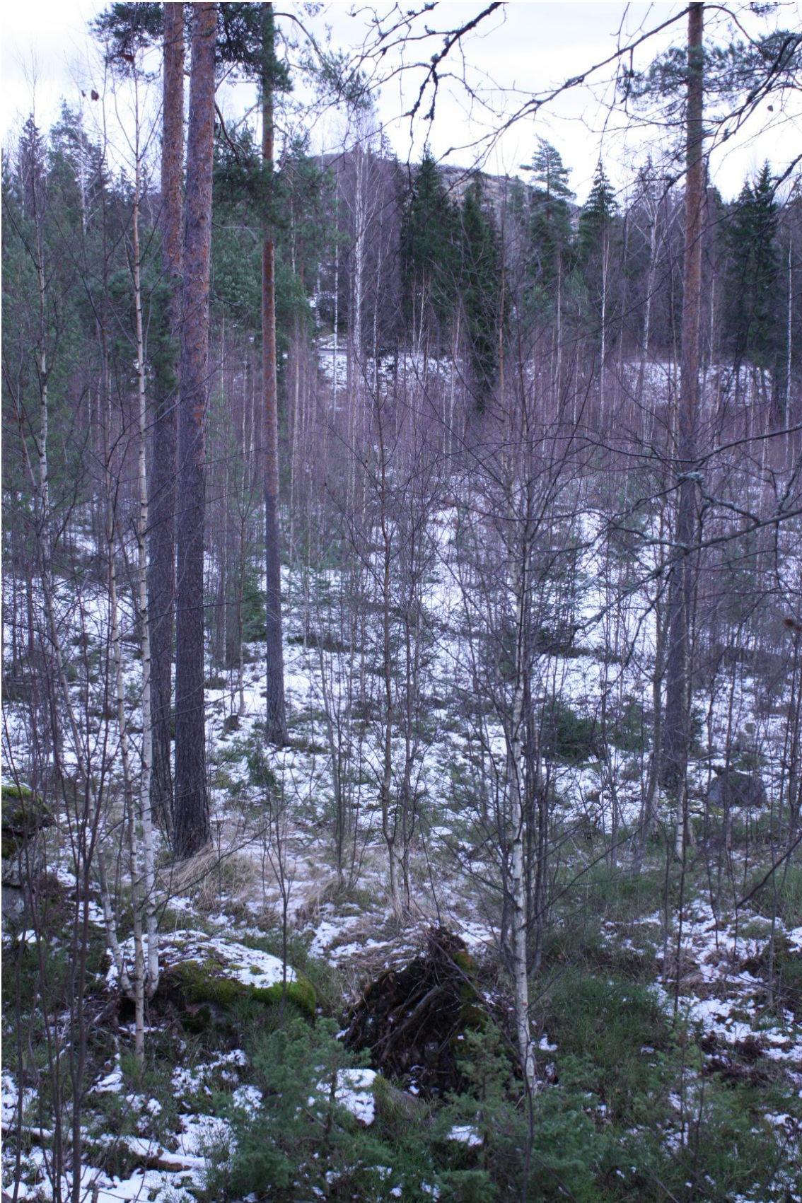
DG 2736:4. Harjun ja Loviisiantien välissä oleva alue, jossa on ehjää maastoa, taustalla Loviisiantie ja Kolaberget.