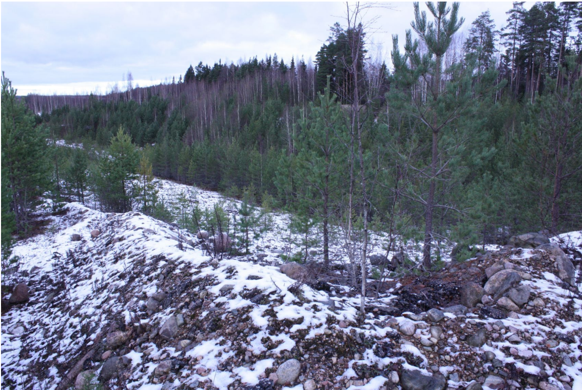
DG 2736:2. Suunnittelualueen pohjoisreunassa oleva hiekkakuoppa.