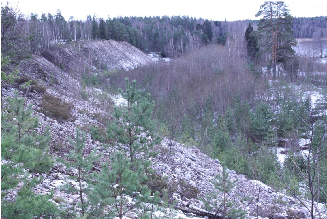
DG 2736:3. Suunnittelualueen lounaisosassa oleva suuri hiekkakuoppa.