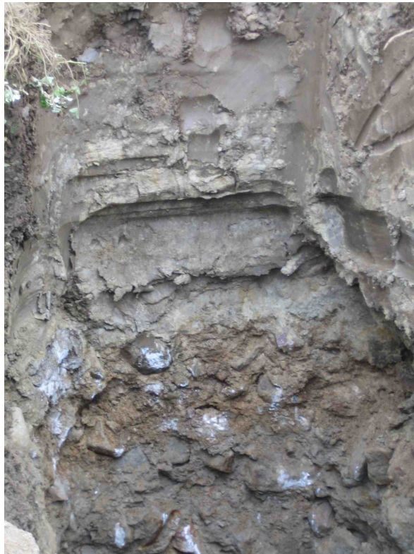
Kuva 2. Pylvään 2033 haruskuopan vanhoja tiekerroksia. Kerrokset erottuvat kuvan alaosassa ruskeana ja harmaana soramaana.

Nyt valvottu alue käsittää Tipurintien mutkan Vanhan Tipurin tilan kohdalla. Alueelle asennettiin kaikkiaan 3 valaistuspylvästä. Pylväiden 2032 ja 2033 paikat olivat aivan muinaisjäännösalueen reunalla. Pylväs 2032 sijaitsi Vanhan Tipurin tilan navetan kulmalla. Ainakin metrin syvyyteen paikalla oli selvästi modernia täyttömaata, jossa oli tiiltä, kiveä ja muovia. Tämän kerroksen alta alkoi multamaa. Pylvään 2033 haruskuopassa näkyi vanhemman, aikanaan Tipurin tilan pihan poikki kulkeneen tien kerroksia. Molempien noin puolen metrin syvyydestä esiin tulleiden sorakerrosten paksuus oli n. 15 cm. Niiden alta alkoi savimaa. Nykyisin tie viereiselle uimarannalle kulkee Tipurin kivi-navetan takaa. Pylvään 2034 paikka poikkesi hiukan alkuperäisestä suunnitelmasta. Kuopassa oli pelkkää savista multamaata.