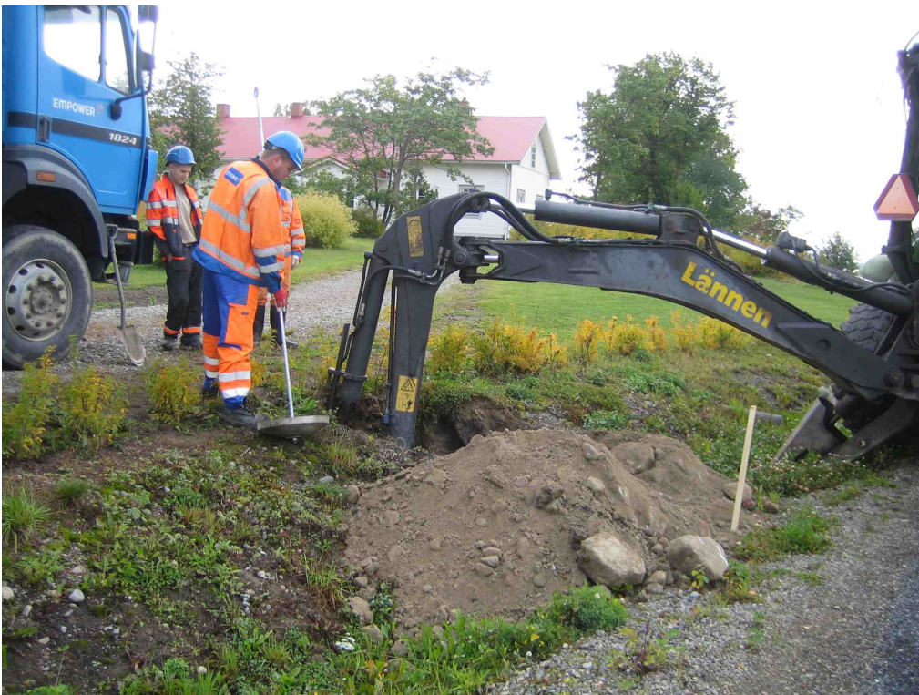
Kuva 1. Pylvään 2033 haruskuopan kaivamista. Taustalla Tipurin päärakennus.

Alueella oli suoritettu marraskuussa 2008 arkeologinen inventointi koskien Tipurin asuntoalueen asemakaavan laajennusta. Tuolloin määriteltiin muinaisjäännösalue Tipurin vanhalle kylätontille. Kurisniemen eli Tipurin kylästä nykyisellä Kylmäkoskella on ensimmäinen asiakirjamaininta vuodelta 1508. Tipuri on suuren osan historiastaan ollut yksinäistalo eli yksitaloinen kylä, mutta oli jaettuna kahtia vuosina 1734-1862. Vanhimpia karttoja, joissa nähdään Tipurin kylän alue ovat Ruotsin valtionarkistossa säilytettävä E. P. Florinin Akaan pitäjän kartta vuodelta 1750 sekä Ruotsin sota-arkistossa säilytettävät Finska Rekognosceringsverket-kokoelman sotilastopografiset kartat. Isonjaon kartta Tipurin kylästä on mitattu peltojen ja niittyjen osalta vuonna 1772, metsät 1784 ja isonjaon on toimittanut vuonna 1806 maanmittari P. G. Herkepaeus. Kylmäkoskea on aiemmin inventoinut Tampereen museoiden toimesta Timo Jussila vuonna 1996. Tipurin aluetta ei tuolloin inventoitu.