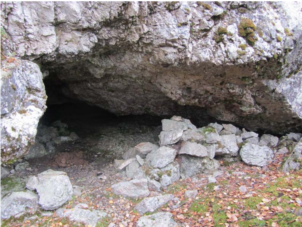
Ristikallio luolan suuaukko. Koekuoppa muurinaukon takana. Kuvattu pohjoisesta.