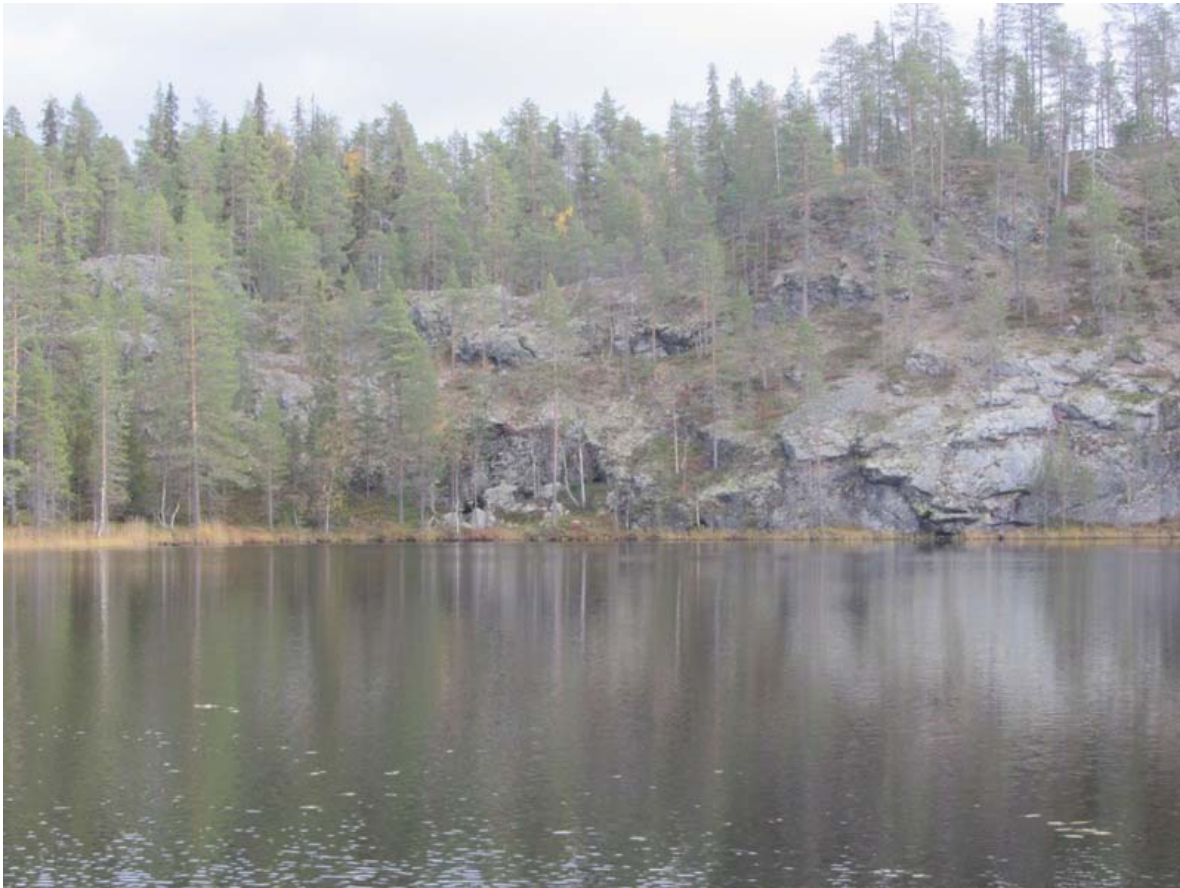
Ristikallion luolan ympäristö, kuvattu luoteesta. Luola kuvan keskilinjan vasemmalla puolella rannalla näkyvien kivenlohkareiden takana.