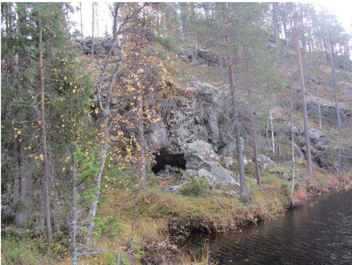
Ristikallio luolan suuaukko ja ympäristöä. Kuvattu pohjoisesta.