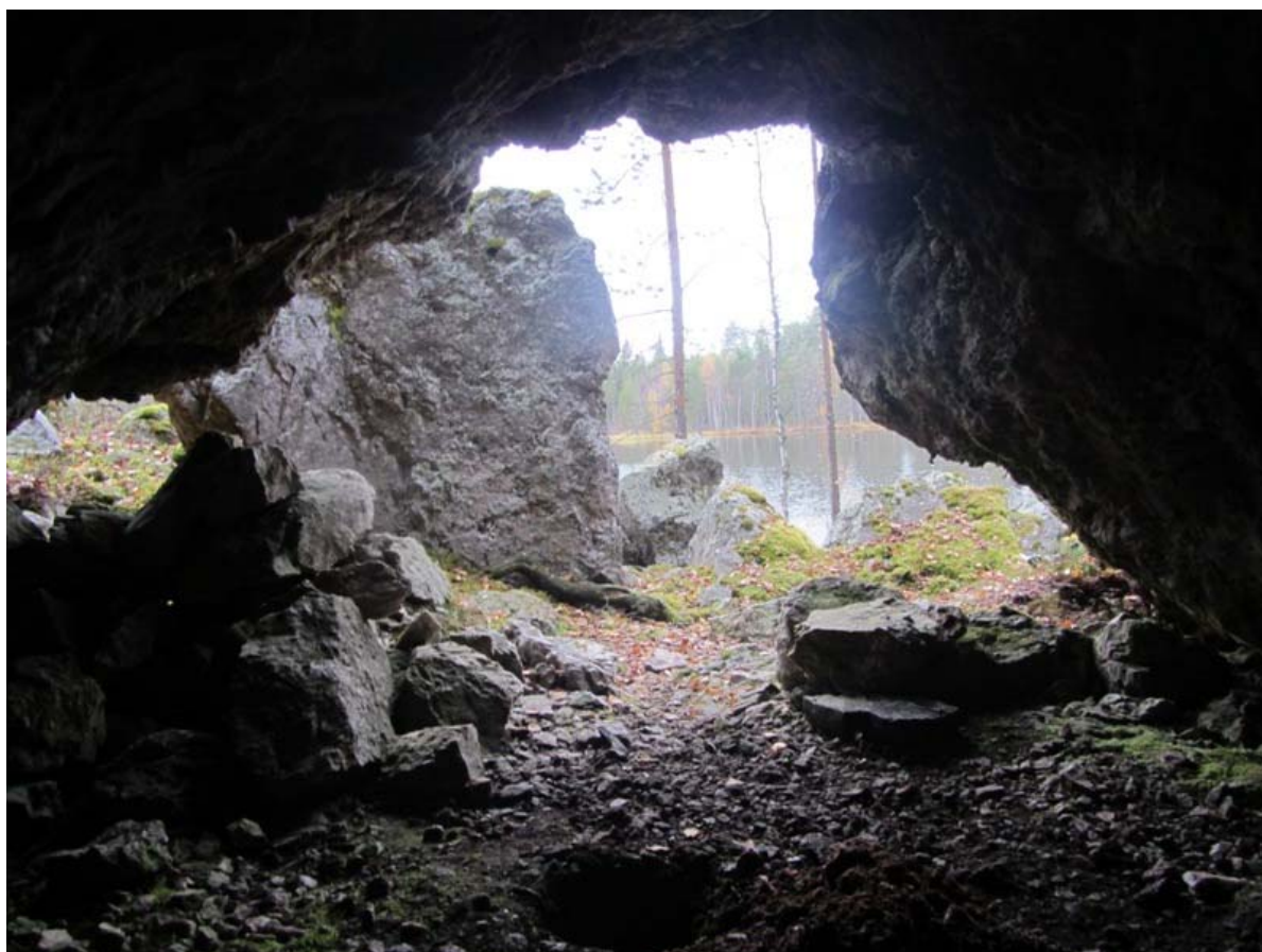
Näkymä Ristikallion luolasta. Kuvassa etualalla koekuoppa. Kuvattu kaakosta.