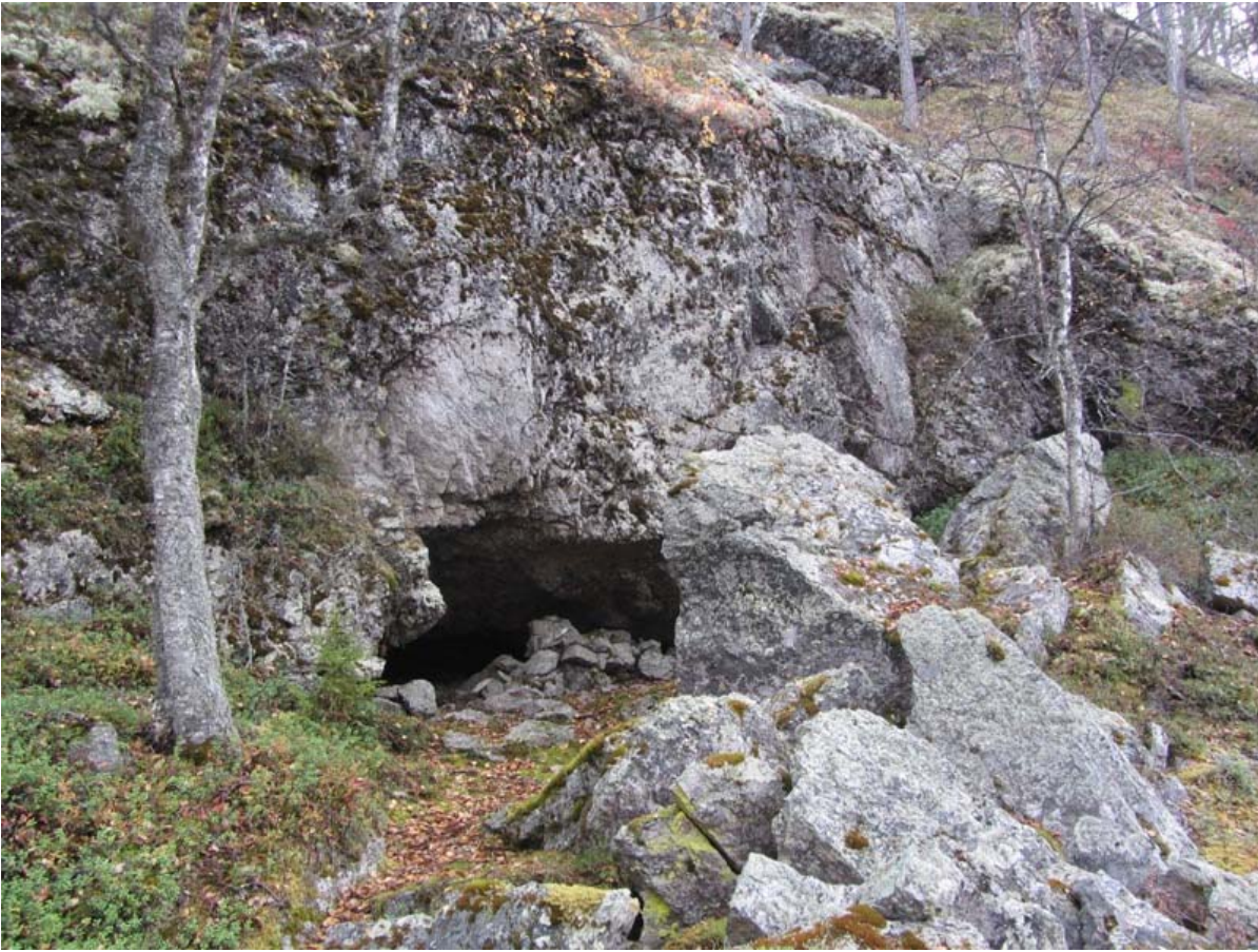
Ristikallio luolan suuaukko, kuvattu pohjoisesta.