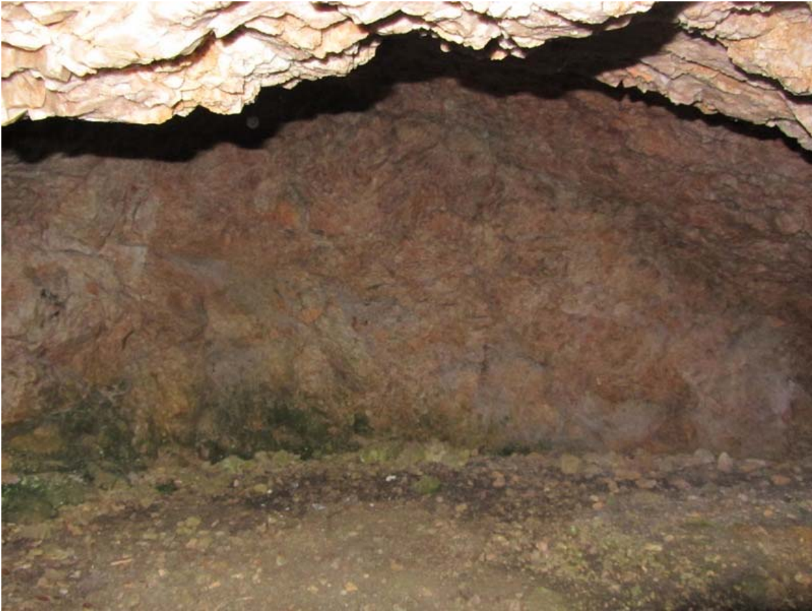
Ristikallio luola kammiomainen takaosa. Kuvattu luoteesta.