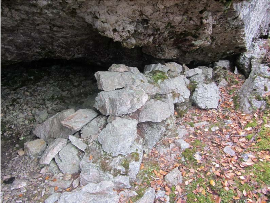
Ristikallio luolan suuaukon eteläreunan muuria. Kuvattu pohjoisesta.