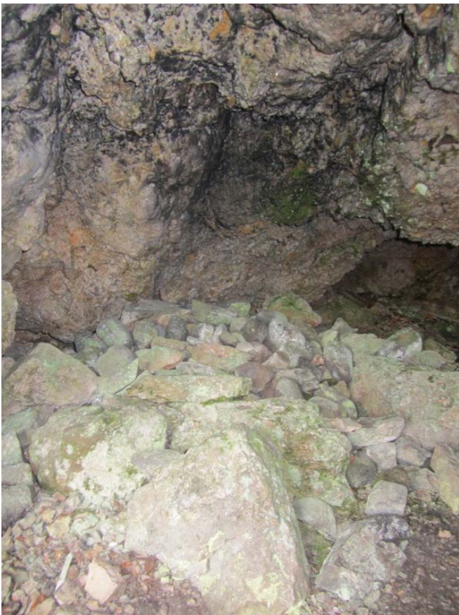
Ristikallio luolan pohjoisreunan kivikasa ja nokea katossa. Kuvattu lännestä.