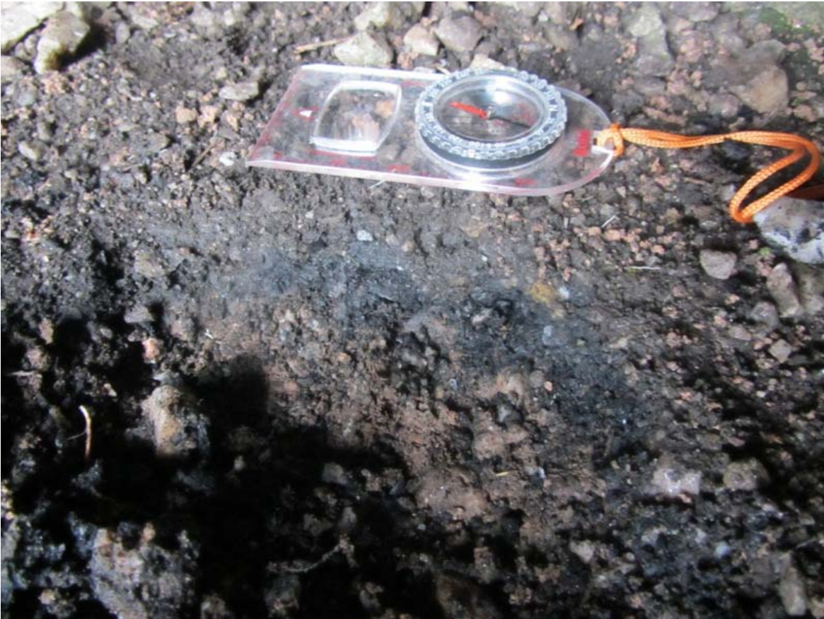
Ristikallio luola, nokikerros koekuopan takaosassa. Kuvattu lännestä.