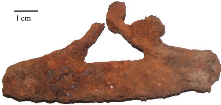
Kuva 5 Nappi