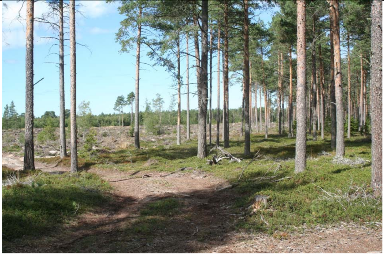
Löytöpaikan maisemaa, kuvattu länsiluoteeseen