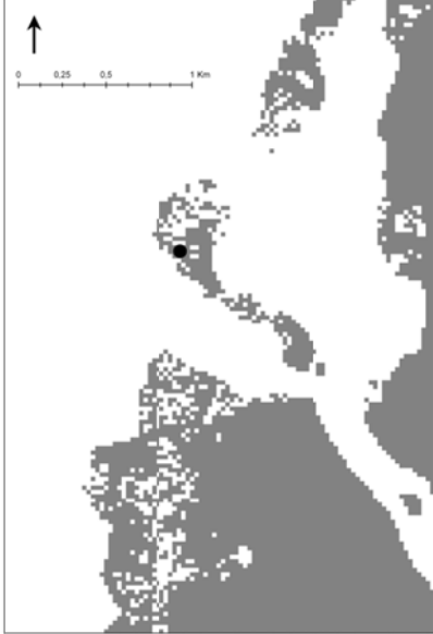
Kuva 9 Löytöpaikka noin vuonna 800 jKr.