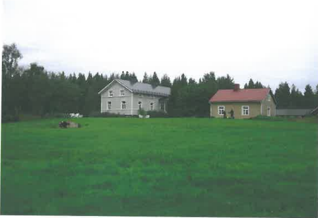
Kuva 2. Yleisnäkymä Pöckelöniemen asuinpaikalle. Vasemmalla koekuoppa ja keramiikan löytöpaikka kaivausten alla. Taustalla harmaa Alavuotungin uusi päärakennus. Oikealla keltaisen vanhan päärakennuksen luona käynnissä takymetrin pystytys. Suunta kohti pohjoista.