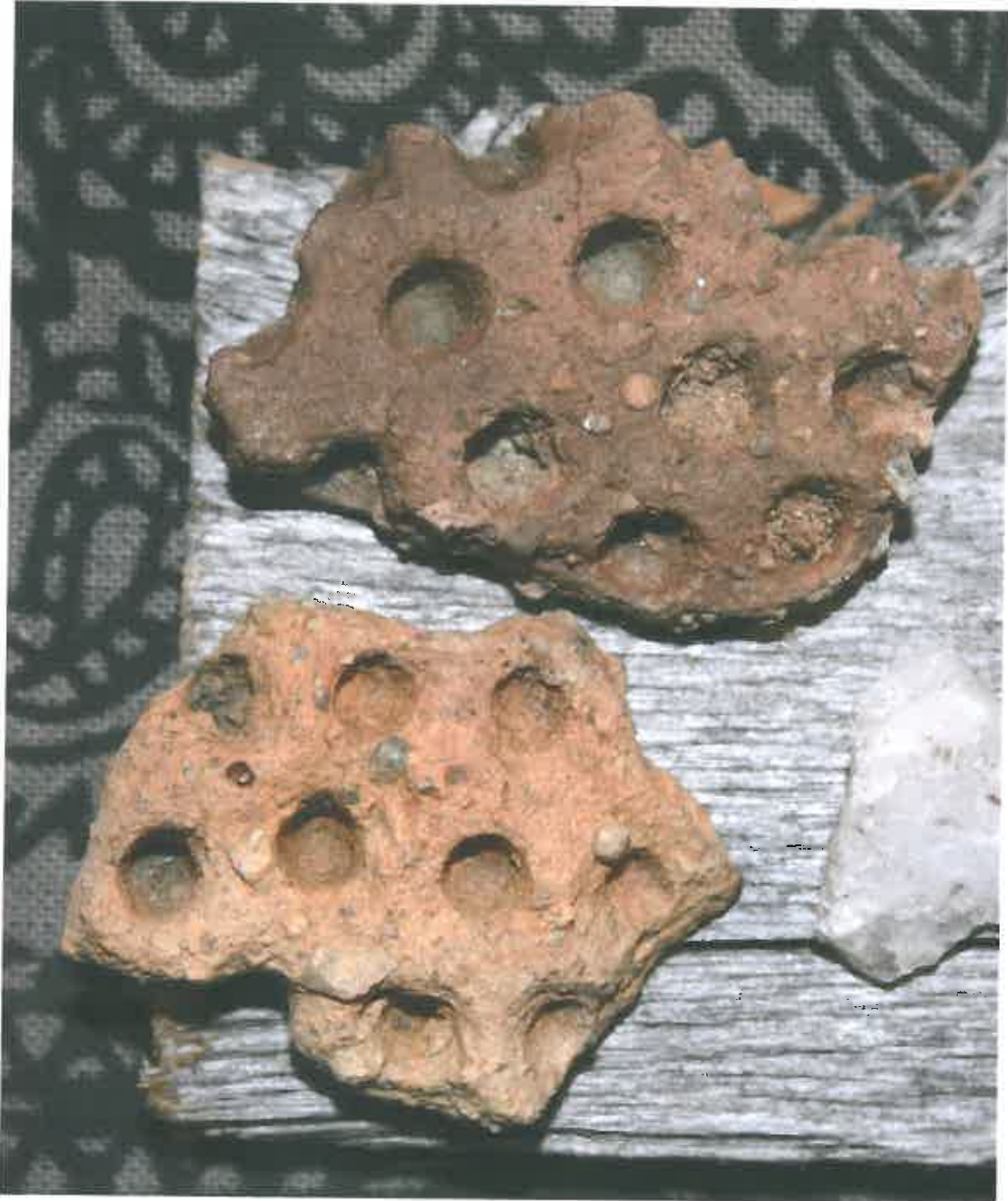
Kuva 1. Jouni Alavuotungin Pöckelöniemen pellostä löytämää esihistoriallista keramiikkaa, joka näyttäisi vastaavan itäistä kuoppakeramiikkaa. Löydöt ovat Alavuotungin hallussa.