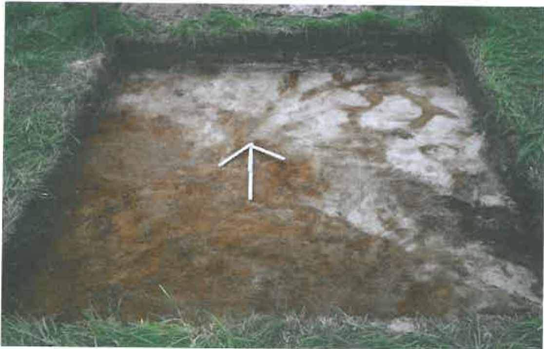
Kuva 3. Koeruutu peltomaan poiston jälkeen. Koillisosassa näkyvissä vanhaan pellonmuokkaukseen liittyviä huuhtoutumiskerrosläiskiä. Suunta pohjoiseen.