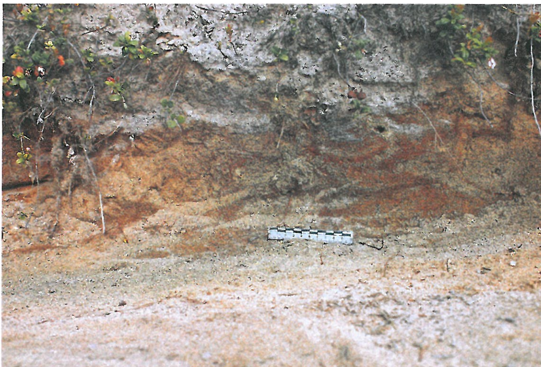
Kuva 2. Tiepenkan profiili. Tiepenkan profiilissa 10 cm mittatikun yläpuolella näkyy tummuneita maakerrostumia alueella, josta valtaosa palaneista tunnistamattomista luufragmenteista löytyi. Pieni osa materiaalista löytyi tien samalta puolelta penkalta muutamman metri pohjoiseen. Löytöaineisto on kulkeutunut alkuperäiseltä paikalta tietöiden vuoksi.

Tutkittavaksi valittu Pitkänkoskenrovan maasto on laaja mutta helppokulkuista ja topografisesti melko piirteetöntä hiekkakangasta, josta on vaikea tehdä opituilla havaintomenetelmillä päätelmiä kiviakautisten asuinsijojen sijainneista. Alueella on oletettavasti ollut useampia kiviakautisia asutuksia kuin kohde joka löytyi kesäkuussa 2011. Alue on ollut osittain vesistön ympäröimä ja näin ollen se on tarjonnut asukkailleen monipuoliset resurssit ja kulkuyhteydet.