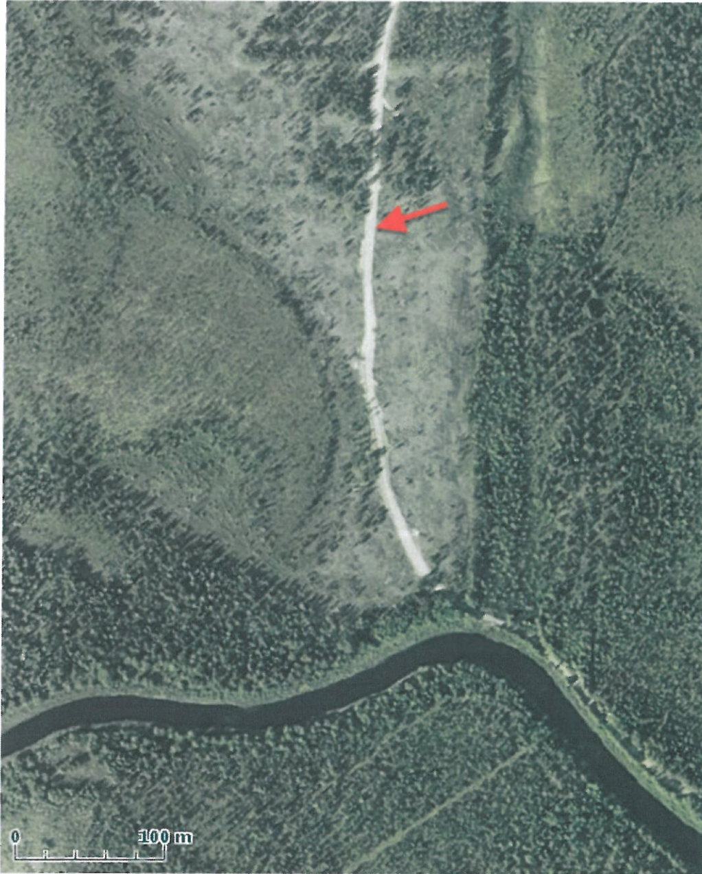
ilmakuva 1. Löytöpaikkaa osoittaa punainen nuoli.