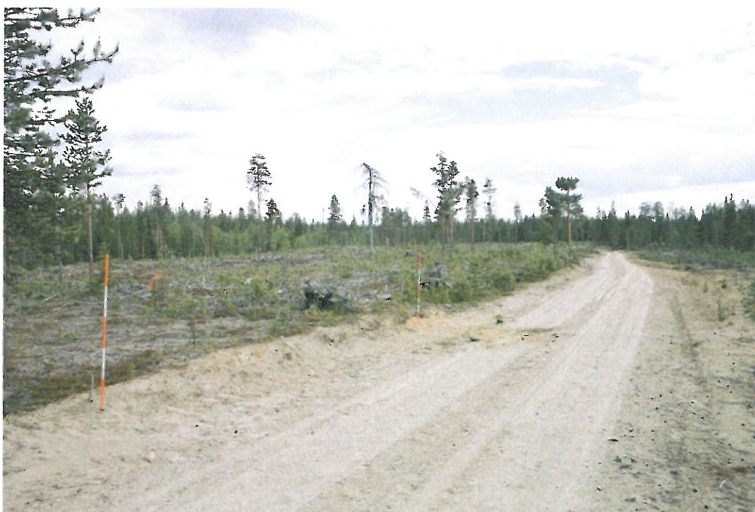
Kuva 1. Pitkänkoskenrova, kuvattu etelään. Tien vasemmassa reunassa (itäpuoli) löytöpaikka on merkitty merkkikepeillä. Kuvassa näkyvä tie alkaa laskea kaartuen vasempaan kohti Jäkälämaanojan ja Ylläsjoen yhtymäkohtaa. Tien vasemmalla puolella noin 90 metrin etäisyydellä metsän suojassa virtaa Jäkälämaanoja, jonka kuvassa oleva tie ylittää noin 270 metrin päässä löytöpaikasta. Tie seuraa Ylläsjokea kohti kaakkoa ja päättyy Ylläsjoen rantaan noin 550 päässä. Tie jatkuu joen toisella puolella etelä-kaakkoon ja yhtyy kantatie 939:n noin 460 metrin päässä. (Joen yli ei johda siltaa).

Asuinpaikka on 153 m mpy tasaisella kivettömällä hiekkakankaalla vesistön tuntumassa ja hyvät asumisolosuhteet tarjoavalla Ancyclusjärviaikaisella rantatörmällä. Asuinpaikka sijaitsee noin 80 metrin etäisyydellä itäpuolella virtaavan Ylläsjokeen laskevan Jäkälämaanojan töyräältä. Vuolaasti eteläpuolella virtaavan Ylläsjoen ja Jäkälämaanojan sekä ajotien yhtymäkohtaan on matkaa asuinpaikalta noin 280 metriä, jossa Jäkälämaanojan yli johtaa huonokuntoinen silta. Hiekkakangas viettää aluksi noin 150 metrin matkalla loivasti etelään kunnes vietto vähitellen jyrkkenee Ylläsjokea lähestyttäessä.