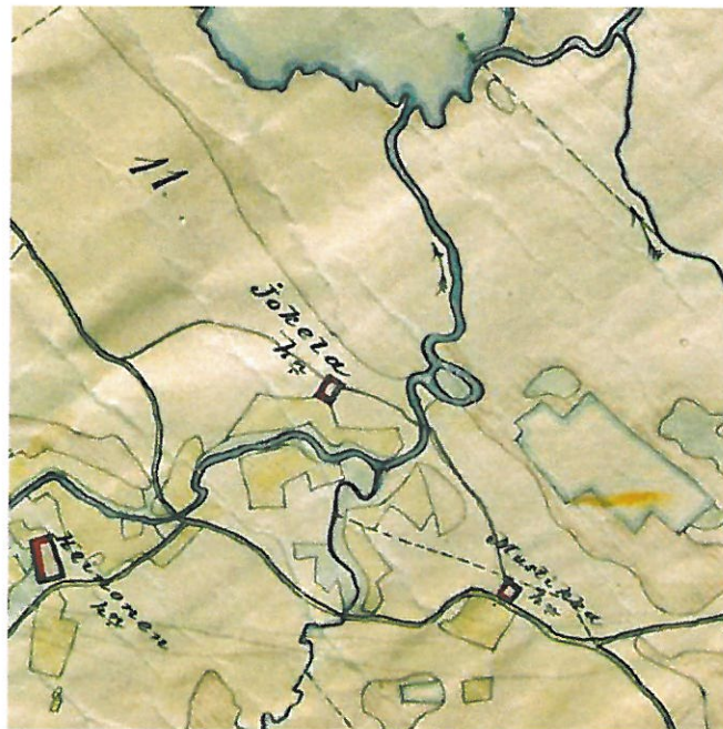
Kartta 4. Ote 1800-luvun lopulla/1900-luvun alussa laaditusta pitäjänkartasta. Kartassa esitetty mm. Yli-Lestin kylän pellot, niityt ja talot sekä Lehtosenjoki ja Mustikkapuro. Http://digi.narc.fi/digi/view.ka?kuid=6180922