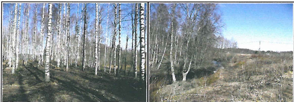
Kuva 3. Inventointialuetta entisillä pelloilla Mustikkapuron länsipuolella. Uusipaikan tunnettu löytö- alue sijaitsee puron itäpuolella alle sadan metrin etäisyydellä. Kuva etelästä.