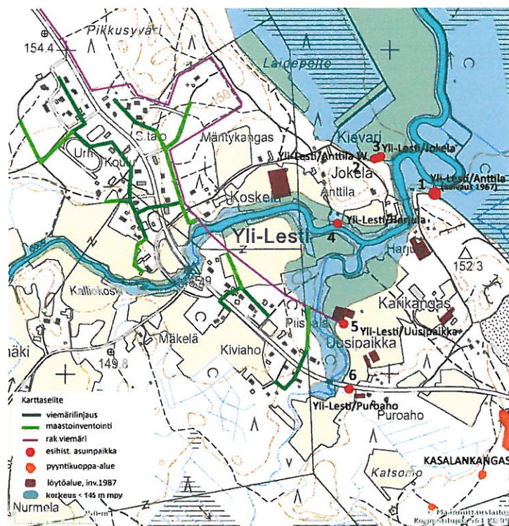
Kartta 2. Löytöpaikat, johtolinjaukset ja korkeusvyöhyke <145 m mpy.