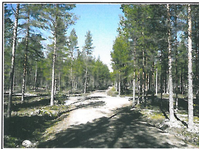
Kuva 1. Inventointialuetta hankealueen luoteisosassa. Kuva kaakosta Kumpulantieltä.