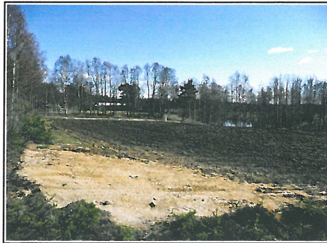
Kuva 2. Inventointialuetta Lehtosenjoen pohjoisrannalla. Kuva lounaasta.