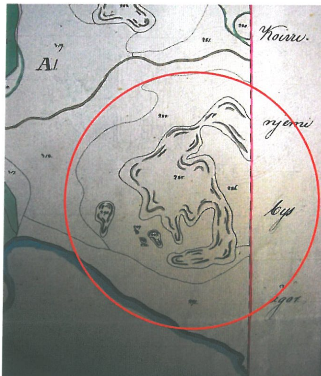
Kuva 1. Lammaskalliota kuvaava osa Alapihlajan kylän isojakokartasta (Metminoff 1850, 1852). Lammaskallion alue ympäröity punaisella.