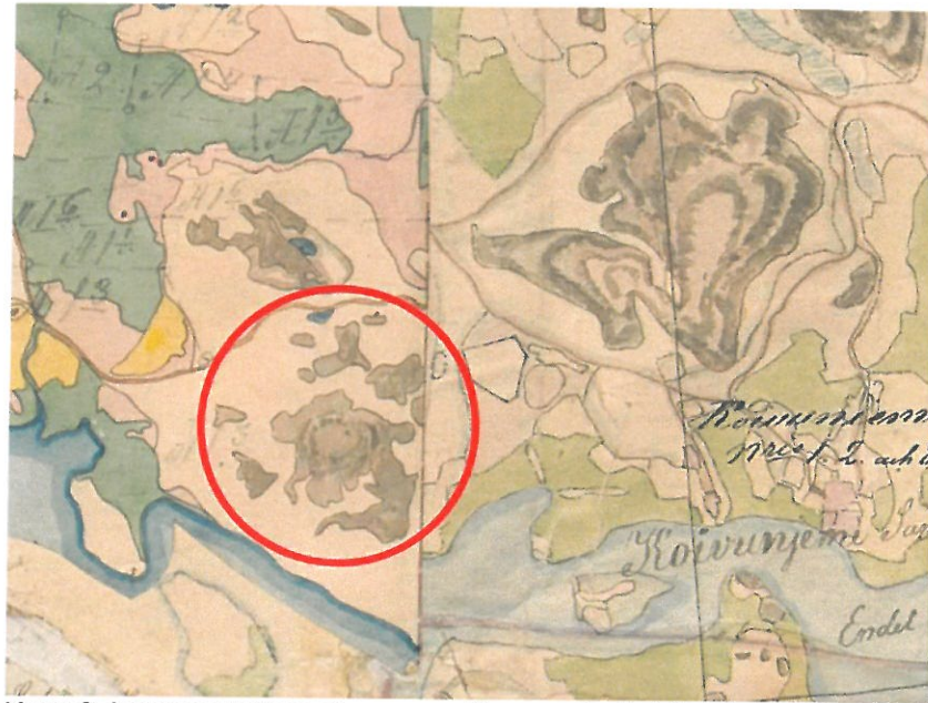
Kuva 3. Lammaskallion alue ympäröity punaisella Virolahden pitäjänkarttaan.