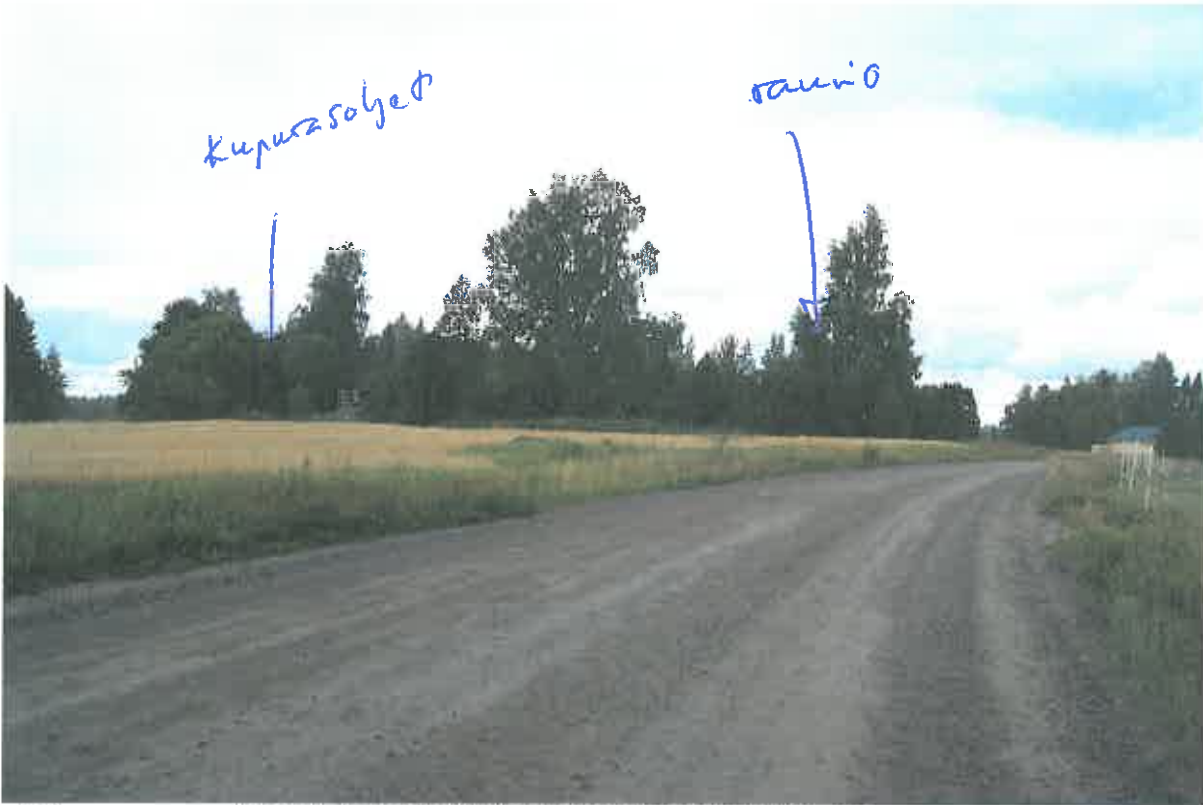
KYY 91 : 4 Keinumäen kalmistomäki kaakosta 12.08.2011