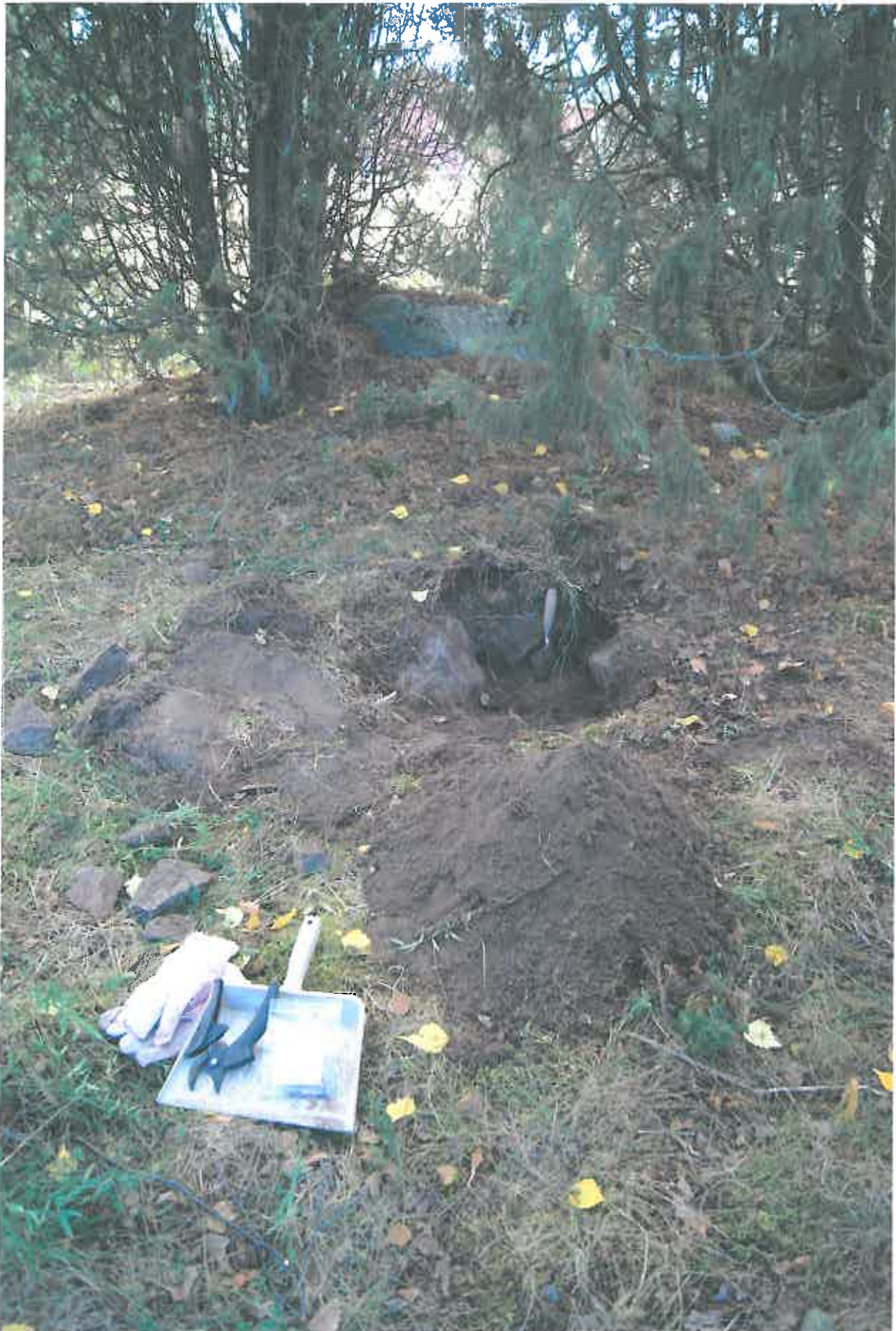
KYY 91 : 1 Koekuoppa röykkiössä 12.08.2011