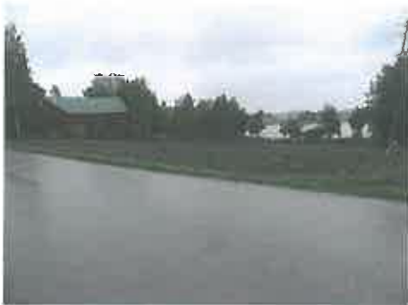
Tiihalalan kylätontin autoitunutta osaa Virolan tilan länsipuolella. Kuvattu kaakosta. 22.09.2011 00:00:00