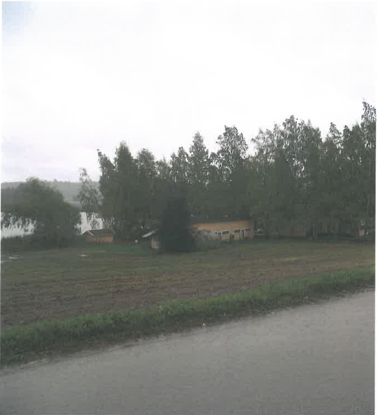
Tiihalan autioitunutta kylätontin osaa Virolan tilan koillispuolella. Kuvattu pohjoisluoteesta.