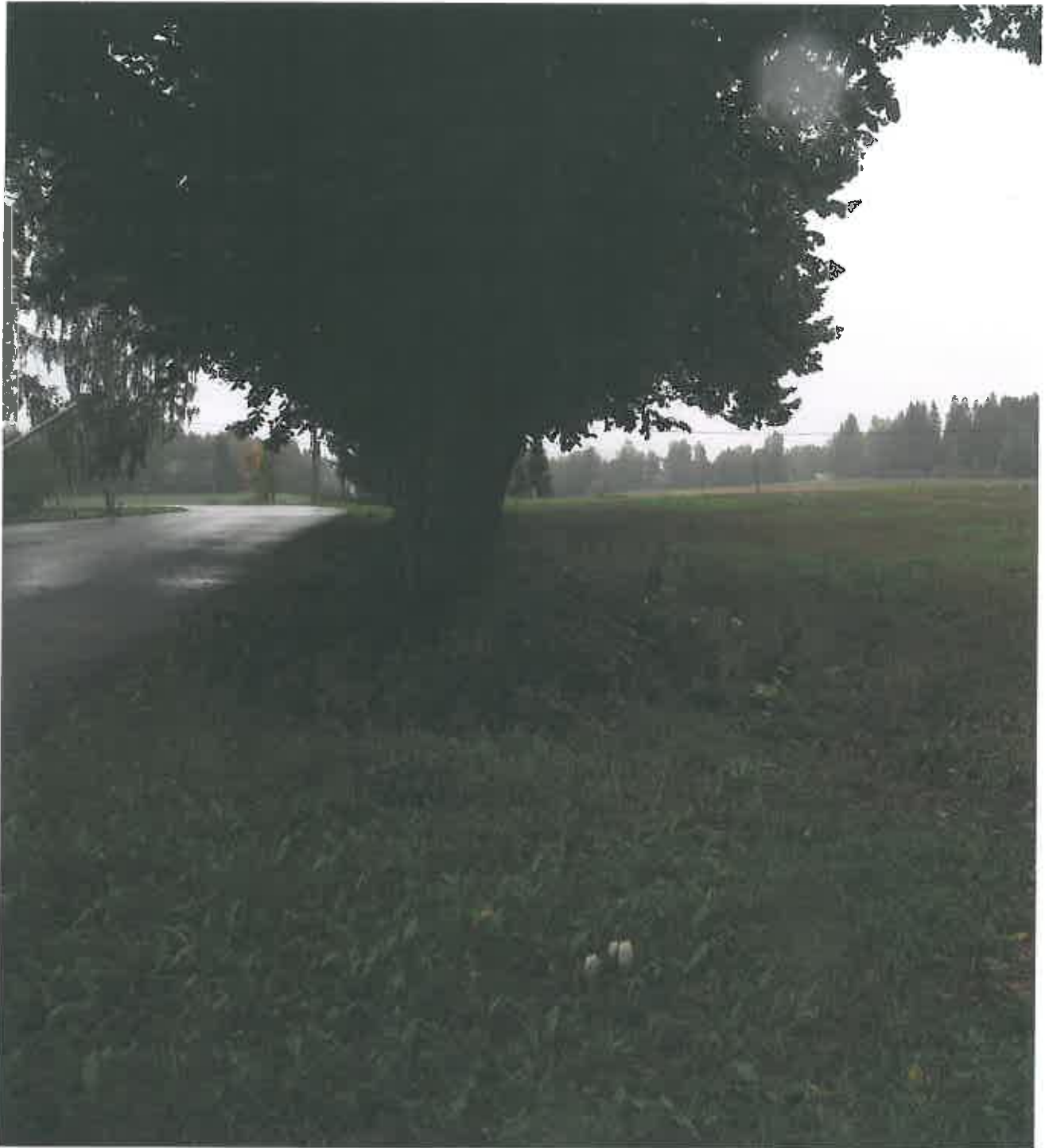
Tiihalan kylätontin autioitunutta osaa Virolan tilan kaakkoispuolella. Kuvattu luoteesta. 22.9.2011