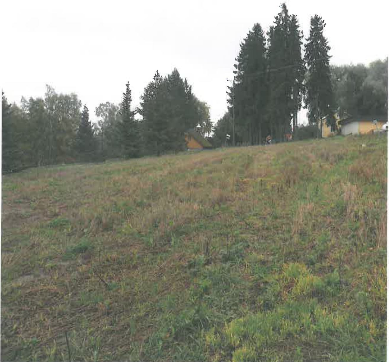
Pelto Tiialan kylänpaikan pohjoispuolella. Pellolle rakennetaan uudisrakennus. Kuvattu pohjoisesta.. 22.9.2011