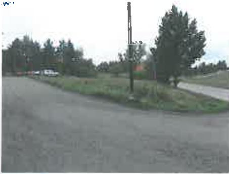
Tiihalan kylätontin pohjoisosaan ja -puolelle suunnitellun uudisrakennuksen sijaintipaikka. Kuvattu eteläkaakosta. 22.9.2011

Kangasala, Tiihala (Tihala), arkeologinen kohde Kangasala, Tiihala, alue