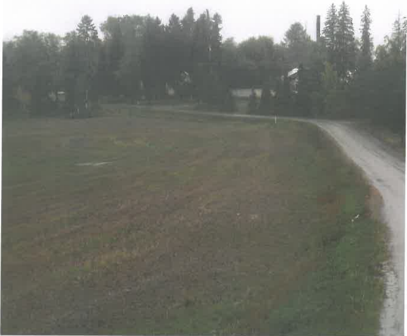
Tiihalan kylänpaikka kuvattuna pohjoisesta. Kylätontti kumpareen alessa. Uudisrakennuksen (2011) sijaintikohta näkyvien rakennusten edessä, puiden takana rinteessä olevalla pellolla. 22.9.2011