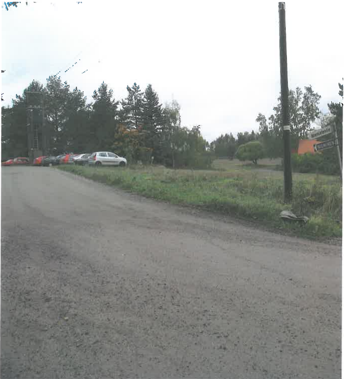
Pelto Tiihalan kylänpaikan pohjoispuolella. Pellolle rakennetaan uudisrakennus. Kuvattu eteläkaakosta.