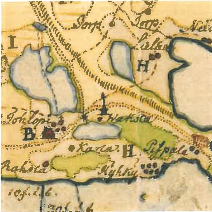
Kuva 2. Daniel Hallin maantieteellinen kartta vuodelta 1770. Lielähteen vievä tie lähtee Tammerkoski-Kokemäki -tien ja Pohjanmaalle johtavan tien haarasta Tohloppi-järven kaakkoispuolelta ja jatkuu kohti koillista.