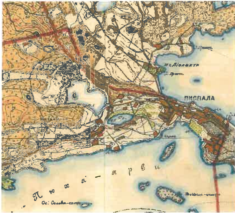
Kuva 4. Senaatinkartta vuodelta 1909.