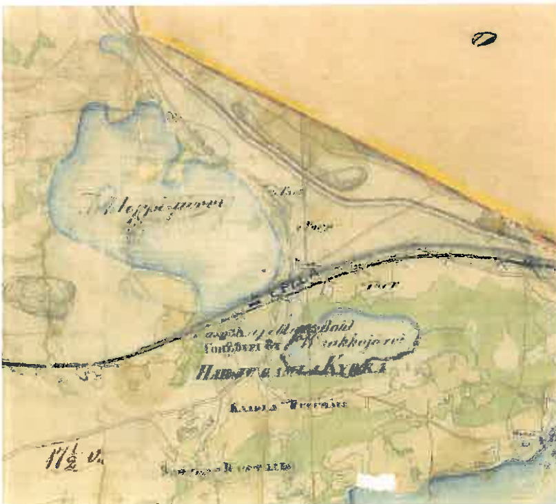
Kuva 3. Pitäjänkartta vuodelta 1847.