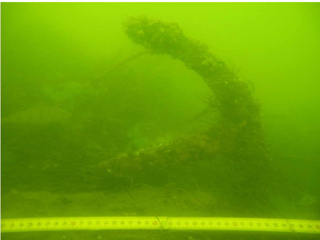
Kuva 14. Hylyn B-puolelta löytynyt ankkuri verkon poistamisen jälkeen. Kuvaussuunta N-S. VK.