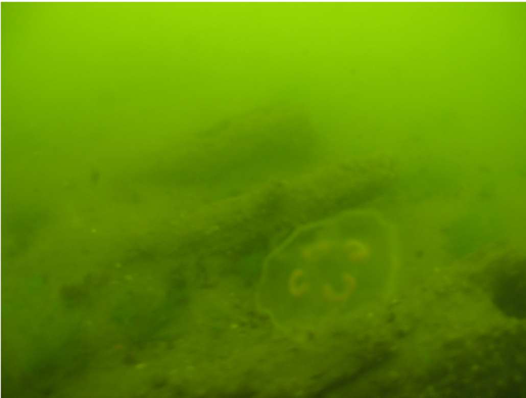
Kuva 13. Hylyn kaaria A-puolelta. Kuvaussuunta E-W. PJ.