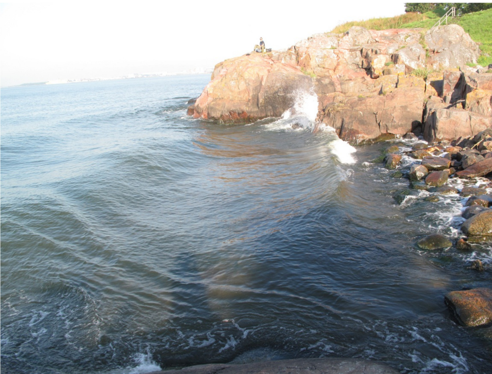
Kuva 18. Työkuva, laivaliikenteen aiheuttamia aaltoja. Kuvassa Ville Peltokorpi. VK.