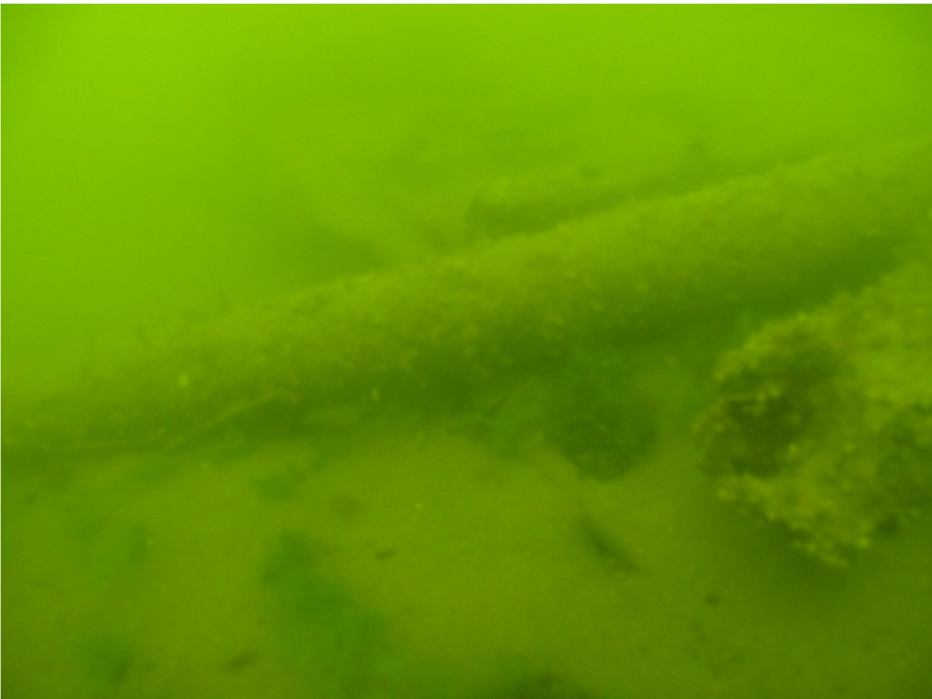
Kuva 12. Hylyn A-puolen kaaret A4-A6 ja pyöreä puu (mahdollinen masto). Kuvaussuunta N-S. PJ.