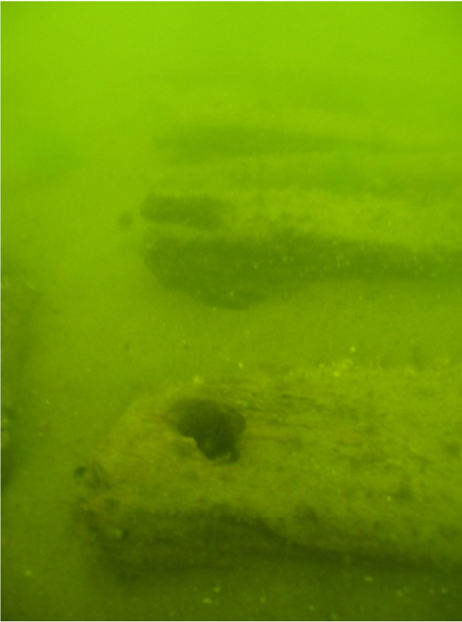
Kuva 11. Hylyn A-puolen kaaria ennen kaarien merkitsemistä nippusiteillä. Kuvaussuunta N-S. PJ.