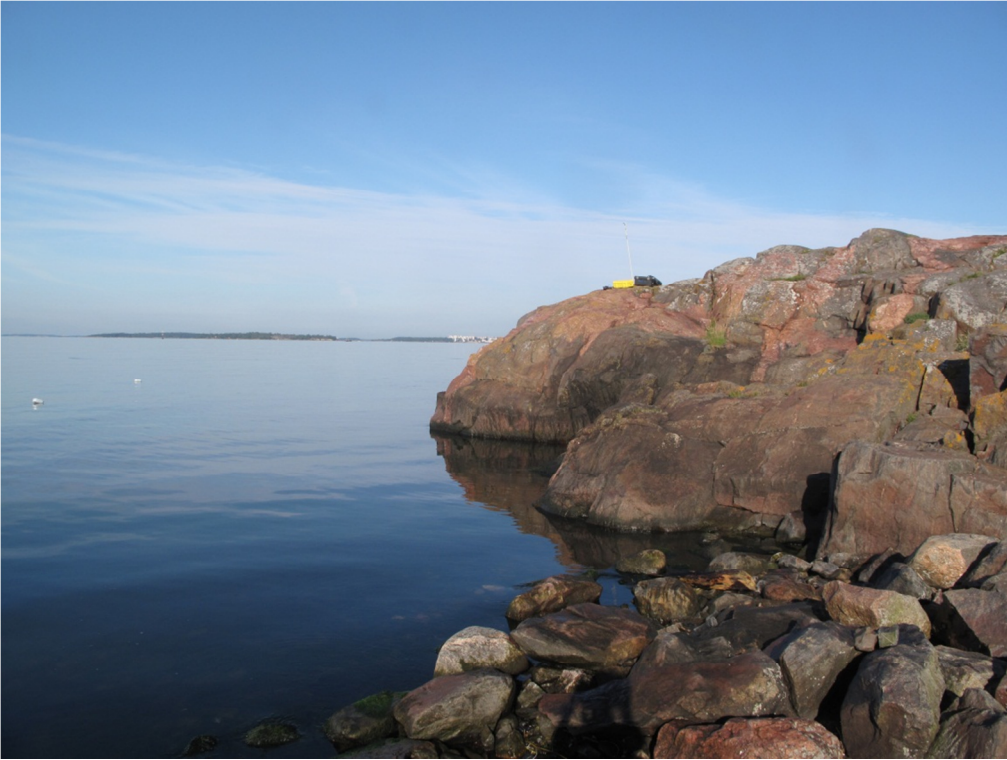
Kuva 23. Työkuva. Kuvassa vasemmalla olevat poijut näyttävät hylyn sijainnin. VP.