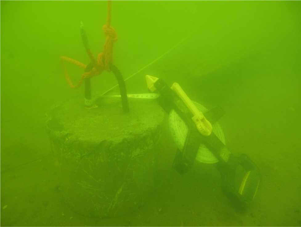
Kuva 21. Hilyn itäpään poijupaino ja hilyn keskellä kulkevan peruslinjan pää. Kuvaussuunta NE-SW. SP.