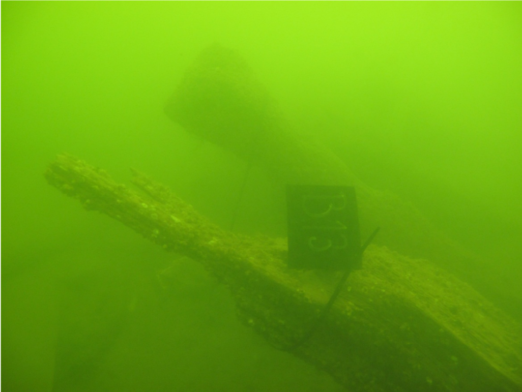
Kuva 19. B-puolen kaaret B13 ja B12. Kuvaussuunta W-E. VK.