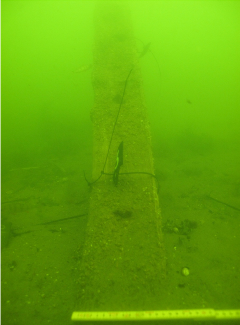
Kuva 24. Kaari B15, josta otetaan dendrokronologinen näyte E3. S-N. VP.