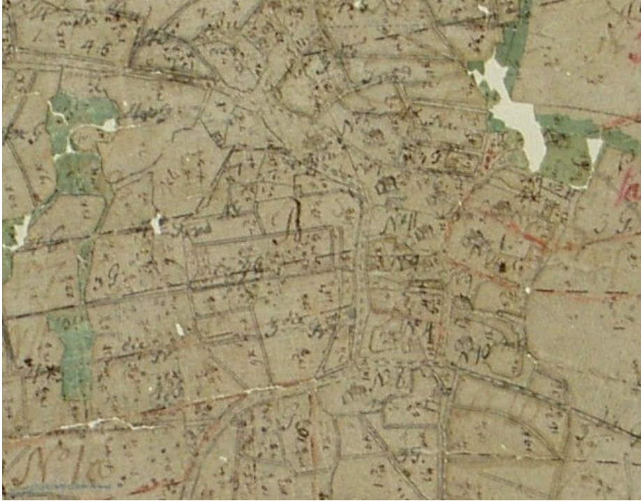
Kuva 2. Isojakokartta Orivedenkylästä v. 1778.

Historiallisen kylänpaikan alue on nykyään verrattain tiheään rakennettua taajama-aluetta. Nykyisten Eerolan, Ala-Mattilan ja Kössin tilojen maatilamaiset pihapiirit ympäristöineen ovat sen sijaan väljemmin rakennettuja. Alueella on asuttu läpi koko historiallisen ajan, talojen paikat ovat vaihdelleet ja maankäyttö ollut aktiivista. Kevyesti perustetut rakennukset eivät ole kuitenkaan välttämättä tuhonneet allaan mahdollisesti säilyneitä kulttuurikerroksia. Vuoden 2009 inventoinnin (Luoto 2009) tulosten ja alueeseen liittyvien historiallisten tietojen perusteella voitiin alueella katsoa sijaitsevan kiinteän muinaisjäänneksen (Orivedenkylä, mj. rek. nro 1000017613).