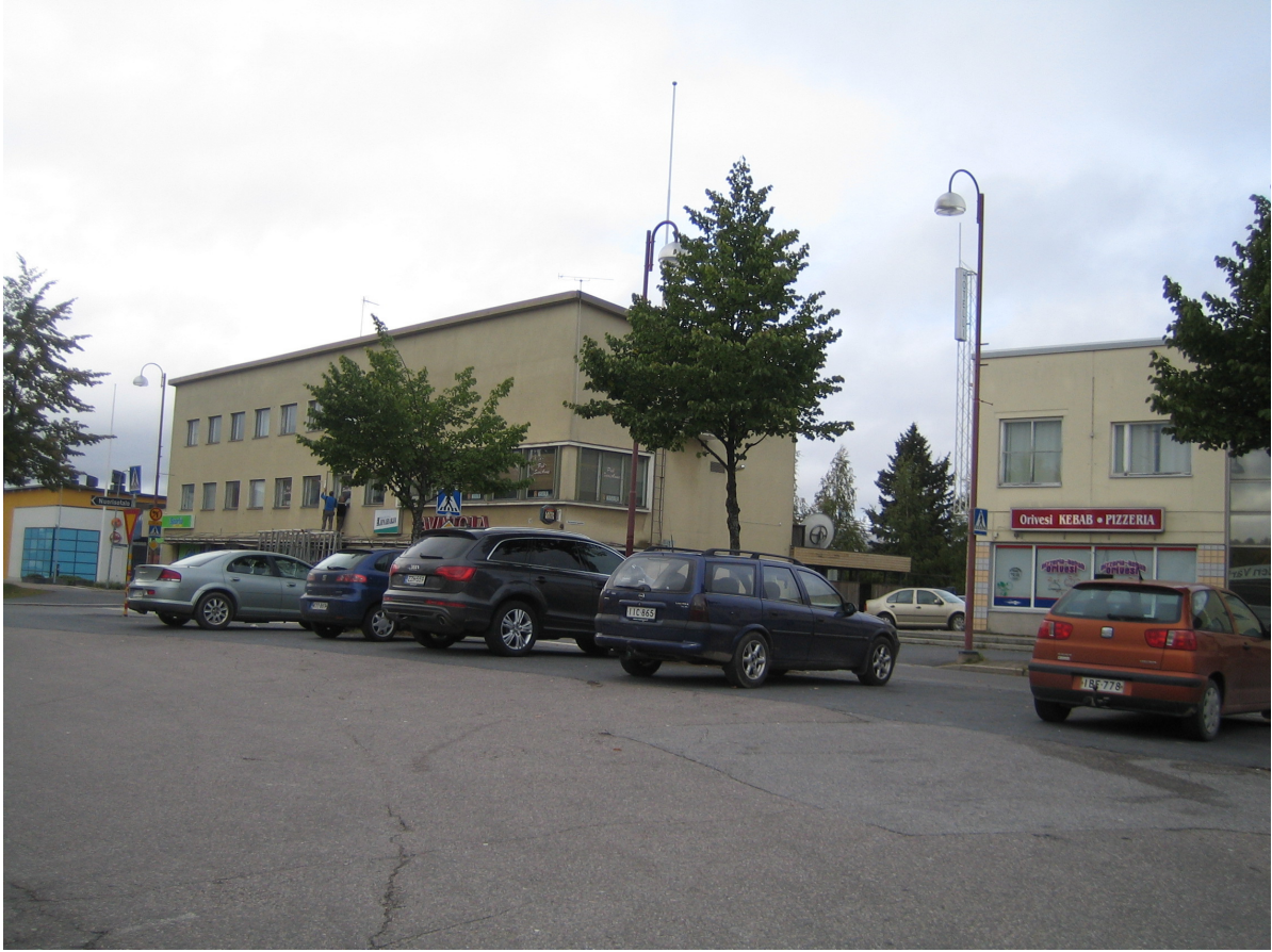
Kuva 4. Siuron tontilla nyk. Keskustiellä sijaitsee liikerakennuksia.