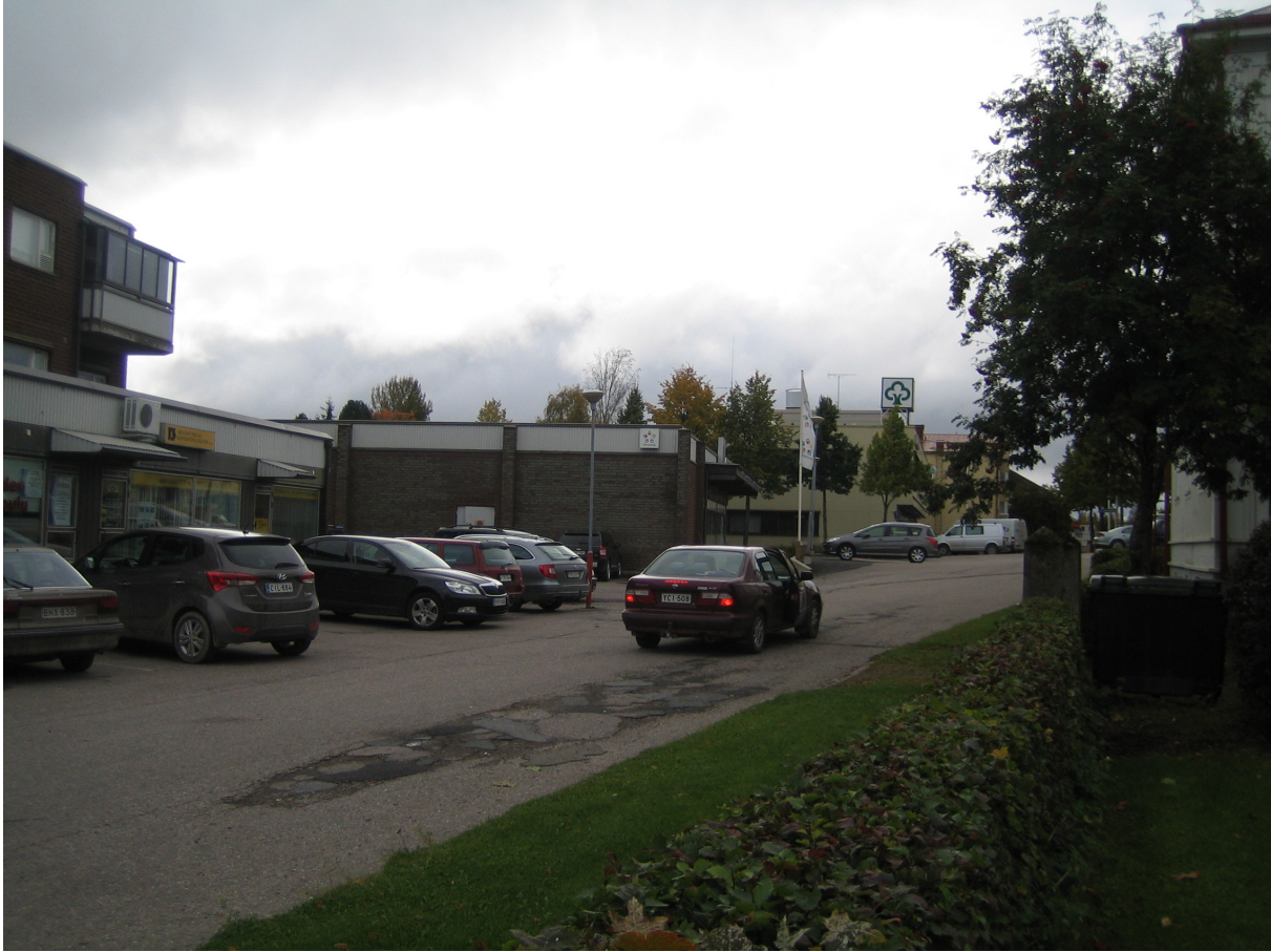
Kuva 5. Uotilan tontin kohdalla on liikerakennuksia Keskustien eteläpuolella.