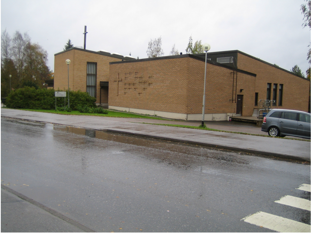
Kuva 7. Liukolan tontilla on nykyään seurakuntatalo.