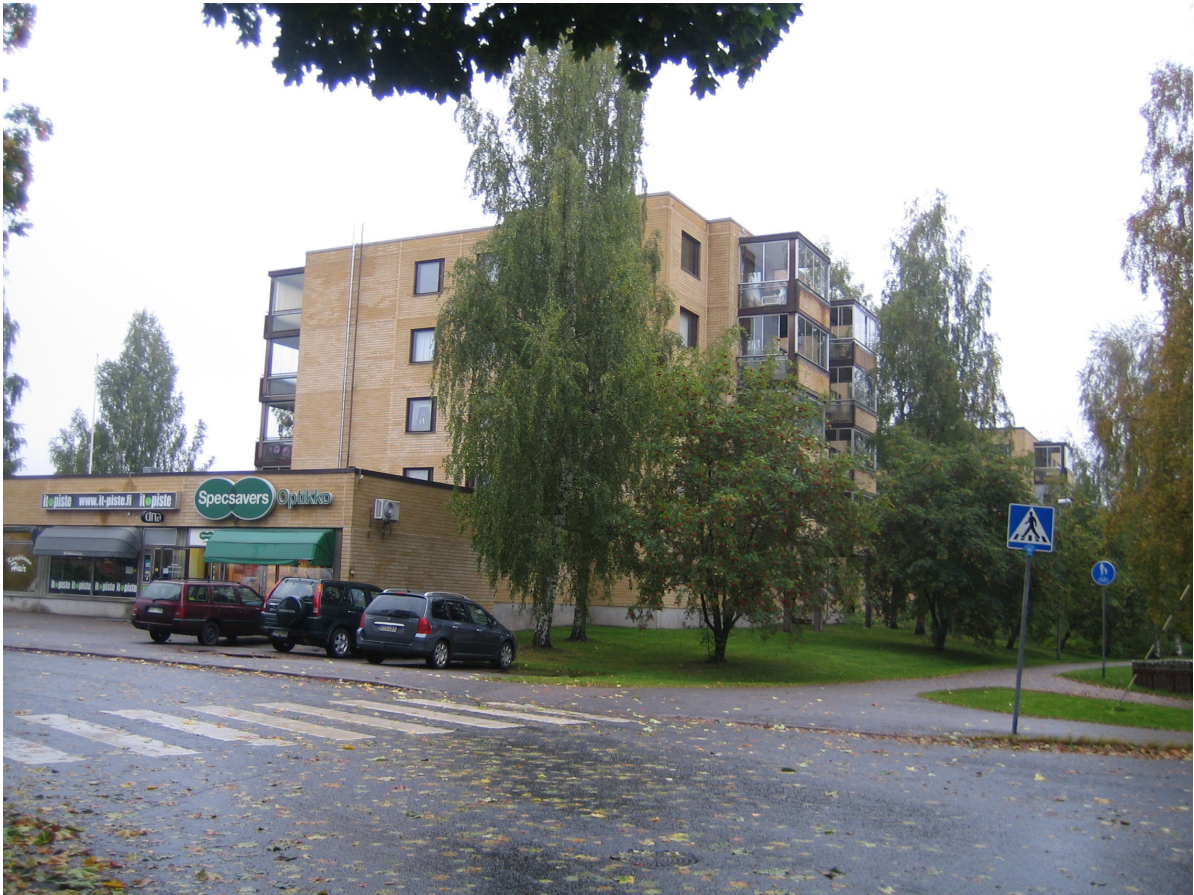
Kuva 6. Mattilan tontin kohdalla kohoavat kerrostalot.