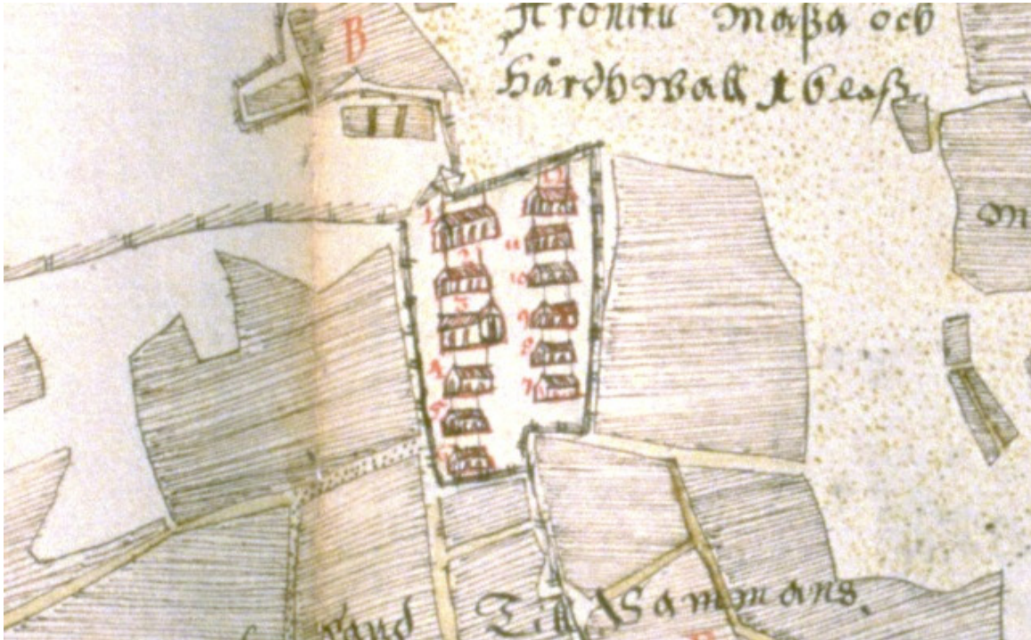
Kuva 1. Maakirjakartta Orivedenkylästä v. 1634.