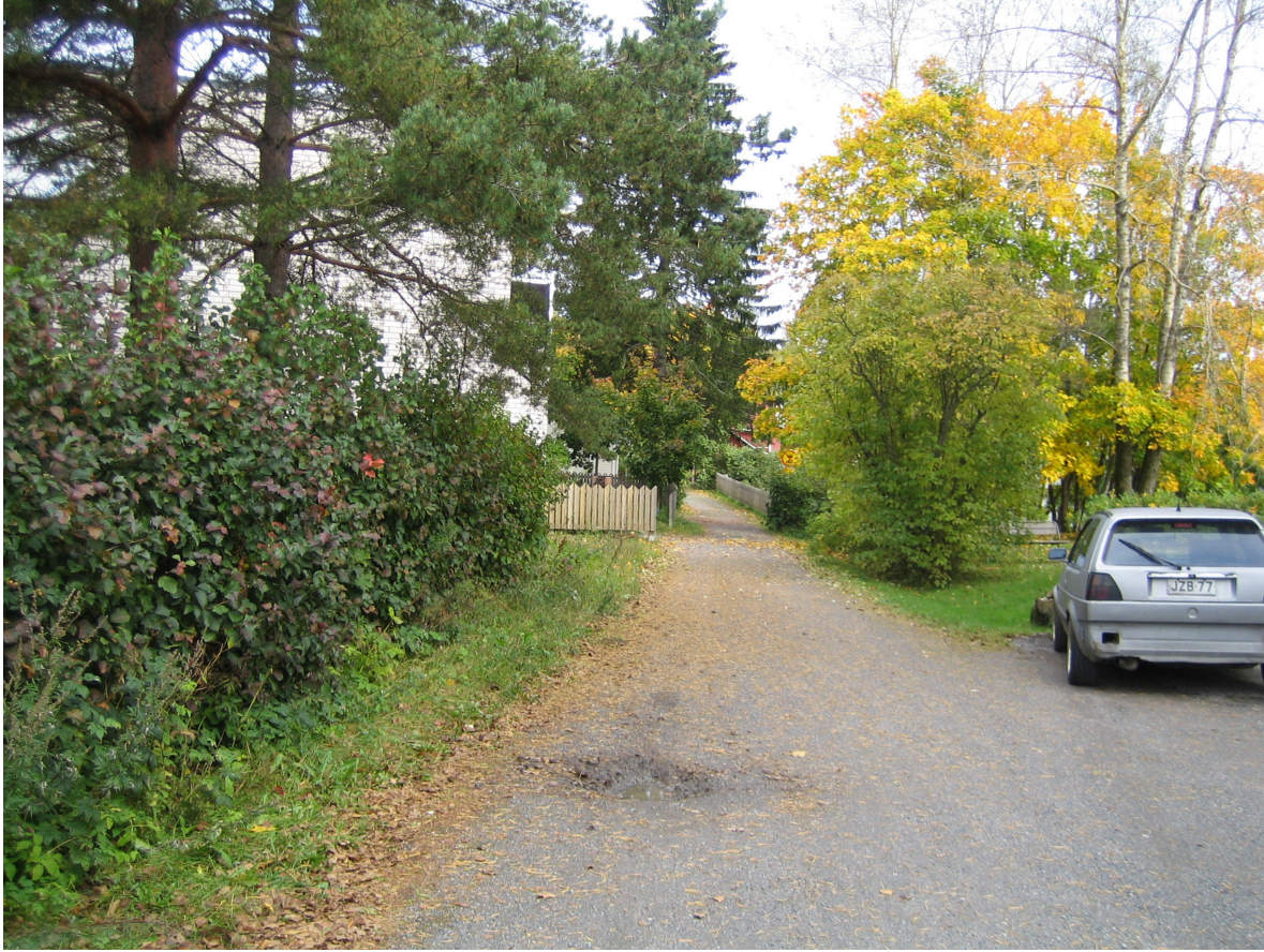
Kuva 3. Paavolan tonttia vasemmalla, Sukkavartaankujan päässä.