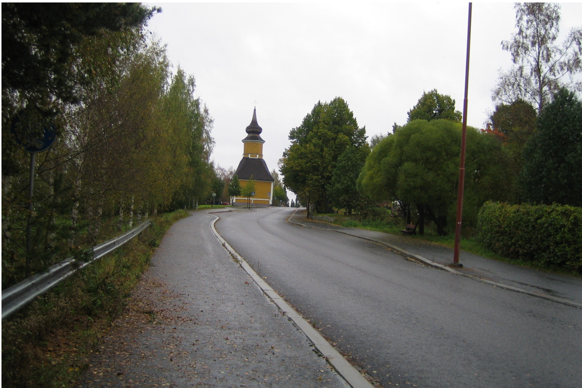
Kuva 8. Kangasalta tuleva vanha Orivedentie nousee kirkolle.

Etelästä Orivettä lähestyvä Kangasalantie on todennäköisesti seudun vanhin tie. Sen nykyinen linjaus (tie 58) kulkee Oriveden keskustan länsipuolelta. Vanha reitti menee kuitenkin nykyisellä Keskustiellä alkaen Kirkkolahdelta, kulkien kirkon ohi yhtyäkseen keskustan jälkeen pohjoisessa taas Orivedentiehen (tie 58). Oriveden kirkko on valtakunnallisesti arvokas rakennettu kulttuuriympäristö. Tämä vanha linjaus haarautuu Oriveden keskustassa Sukkavartaan alueen eteläpuolella itään Jämsän suuntaan ja pohjoiseen Ruoveden suuntaan kulkeviksi maanteiksi.