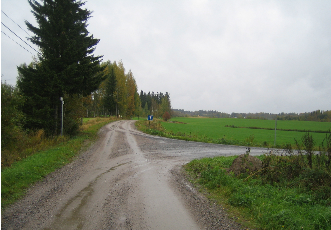
Kuva 10. Vanha Jämsäntie. Pohjantietä Paavolan suuntaan, jonne tie päättyy. Kuva T. Vasko.

Nyt inventoidulla suunnittelualueella ainoastaan Pohjantien lyhyt osuus (kts. kartta 5) on säilyttänyt edes osin alkuperäisen luonteensa. Tien ympärillä on vielä osin avointa peltomaisemaa osana Lyytikkälän Hirsilän maakunnallisesti arvokasta maisema-aluetta. Alueella tulisi rakentaa maisemavot huomioiden. Myös tällä tienosalla tulisi huomioida tiekerroksiin kajottaessa mahdollinen dokumentointi- ja näytteidenottotarve.