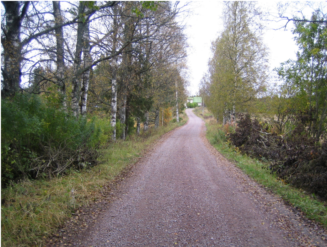
Kuva 9. Vanhaa Ruovedentien linjaa nykyisellä Kömöntiellä.

Isojakokartassa vuodelta 1779 Sukkavartaan alueella näkyy merkintä mahdollisesta kulkureitistä (nyk. Sukkavartaankuja ja -tie). Vuoden 1842 pitäjänkartassa alueella on jo tie ja samoin vuoden 1900 isojaontäydennyskartassa. Isojakokartan perusteella näkyy että Ruovedentie on kulkenut kuitenkin Sukkavartaan alueen länsipuolelta, suurin piirtein nykyisellä Keskustien linjauksella ja Sukkavartaan kulkuväylä lienee syntynyt vasta 1800-luvun alussa. Tampere-Jyväskylä tie (valtatie 9) ja sen liittymä ovat katkaisseet vanhan tien. Se jatkuu liittymän pohjoispuolella nykyisellä Ahteentiellä liittyen Oriahteen alueella kulkevaan Ruovedentiehen. Pohjoisessa tie ylittää Enokunnantien ja jatkuu sorapintaisena Kömöntienä.