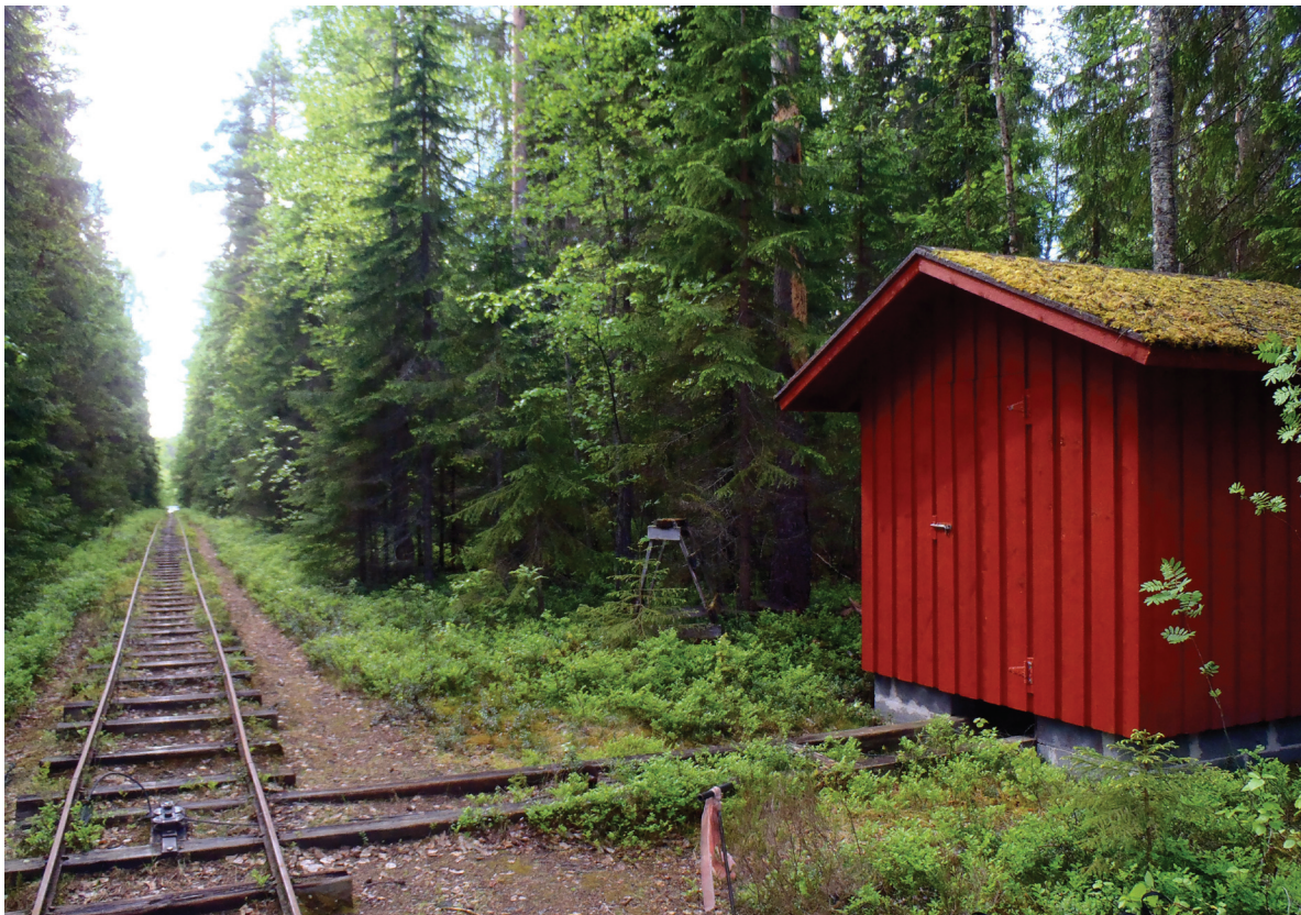
P6130084: Lentuankosken YSA-alueen kenttärata ja vaja. Rata on käytössä, ja sen avulla voidaan vetää veneet yli koskipaikan.