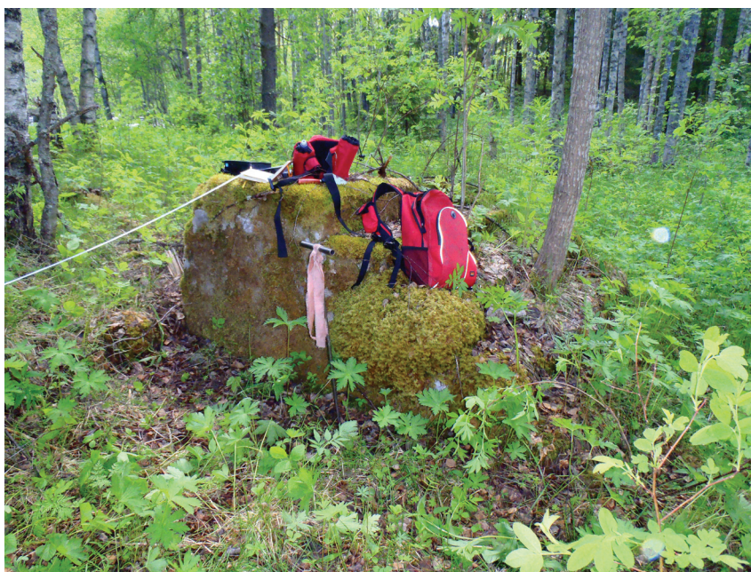
P6130102: Lentuankosken torpan portaat ovat ohuella laastikerroksella päällystetyt mutta luonnonkivitäytteiset. Ne sijaitsivat aivan rakennuksen eteläpäässä. Portaille on kasautunut lähes koko tutkimusrekvisiitta.

Niityalue rajautuu kauttaaltaan rehevään sekametsään, idässä pauhaa koski.