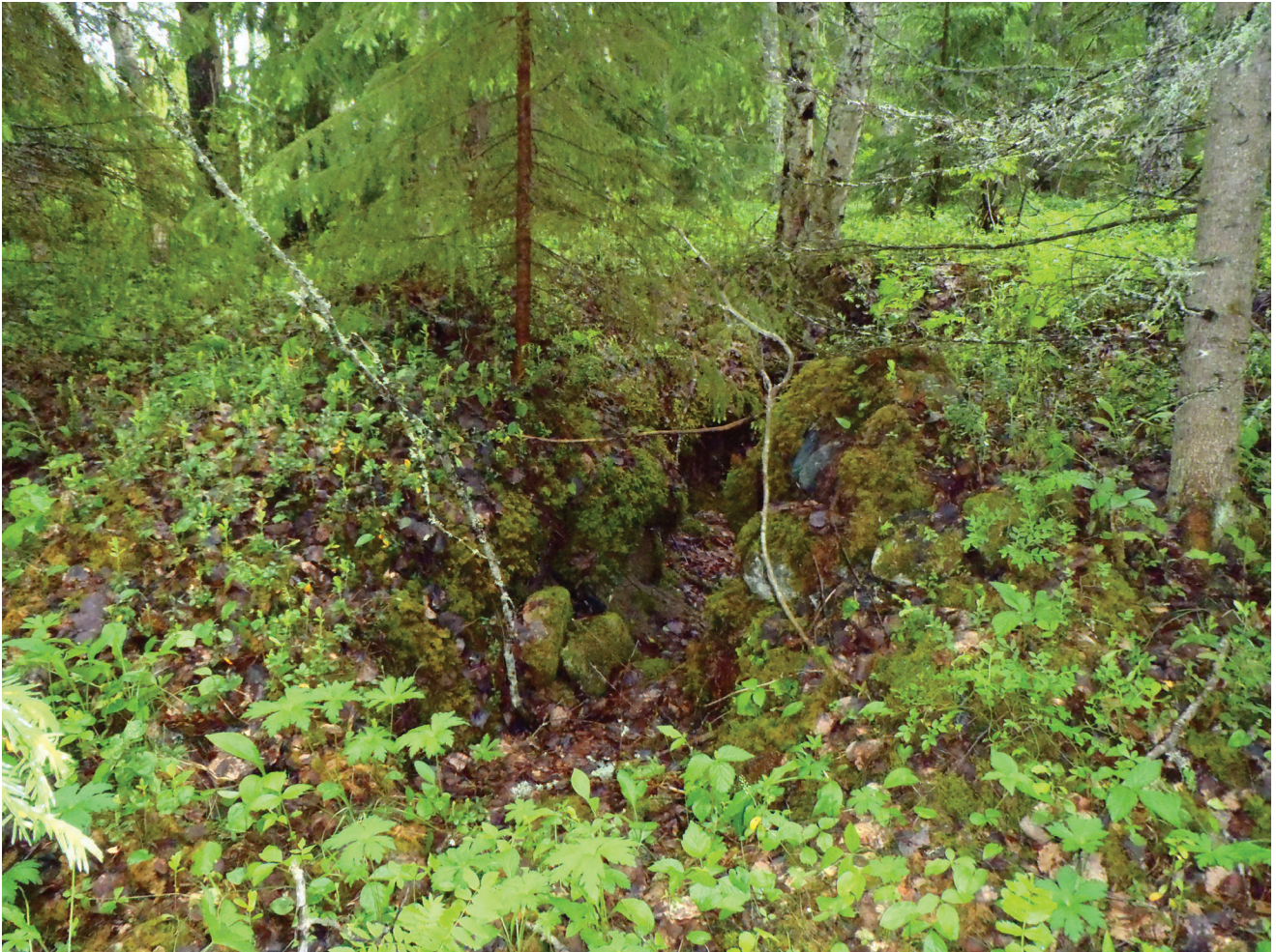
P6180179: Kellarin jäännökset Lentuankosken YSA-alueella, torpan eteläpuolella.