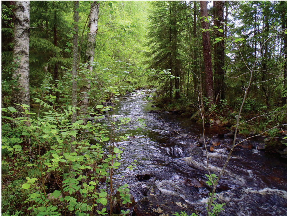
P6180192: Lentuankosken sivuhaara torpan kaakkoispuolella. Näillä paikkein lienee sijainnut mylly.