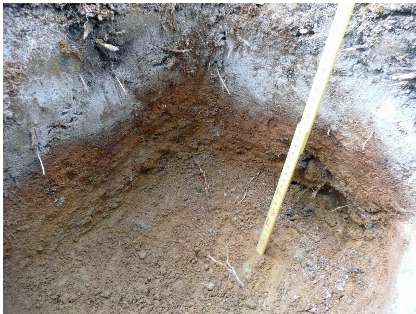
Kuva 4. Koekuoppa 4. Häiriintymättömiä maakerroksia löytyi lähinnä vain inventointialueen luoteisosasta yli 75 m mpy olevalta korkeudelta. Kuvassa kokeissa havaittu tyypillinen maannos; huuht.kerroksen alla esiintyy ruskea karkea hiekka ja sen alla kellertävä hienojakoinen hieta.