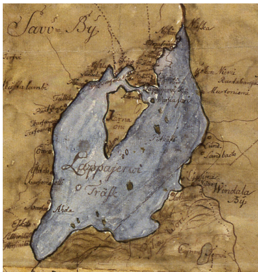
Kartta 3. Lappajärvi maanmittari Nils Röringin kuvaamana. 1770-luvun pitäjänkartta. 5