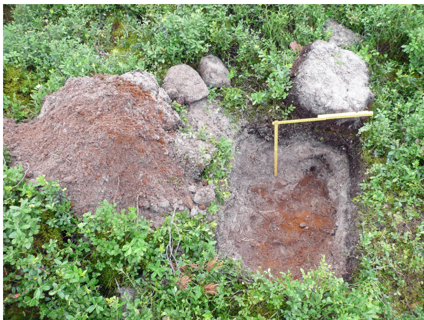
Kuva 5. Koekuoppa 7. Luoteisimmassa alueelle kaivetussa kokeessa esiintyi kiviä ja niiden värjäämää maata.