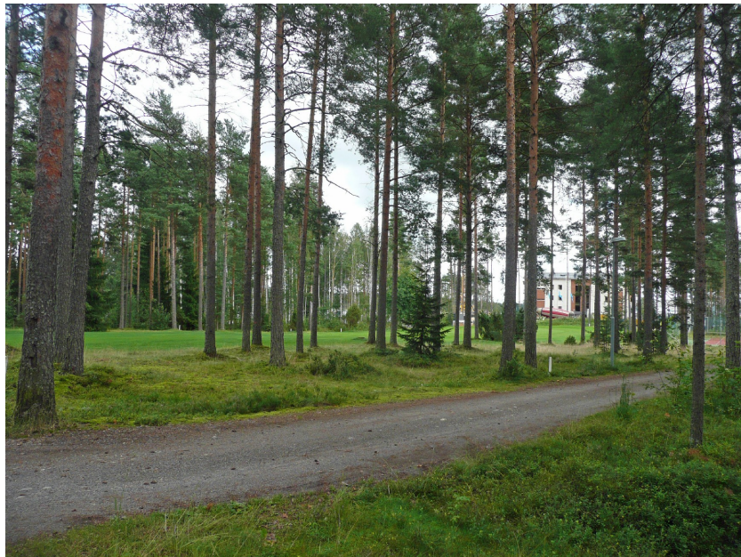
Kuva 3. Inventointikohteen länsipuolella sijaitseva golfväylä ja metsää.