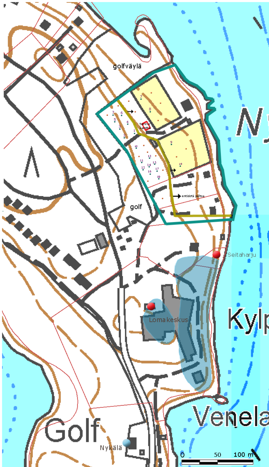
Kartta 2. Hankealue rajattuna. Koekuoppa/koepisto; vihr./oranssi neliö. Kiinteä muinaisjännös; pun.ympyrä, löytöpaikka; sin.ympyrä. Lomakeskuksen tuhoutunut asuinpaikan alue skemaattisesti sinisellä.