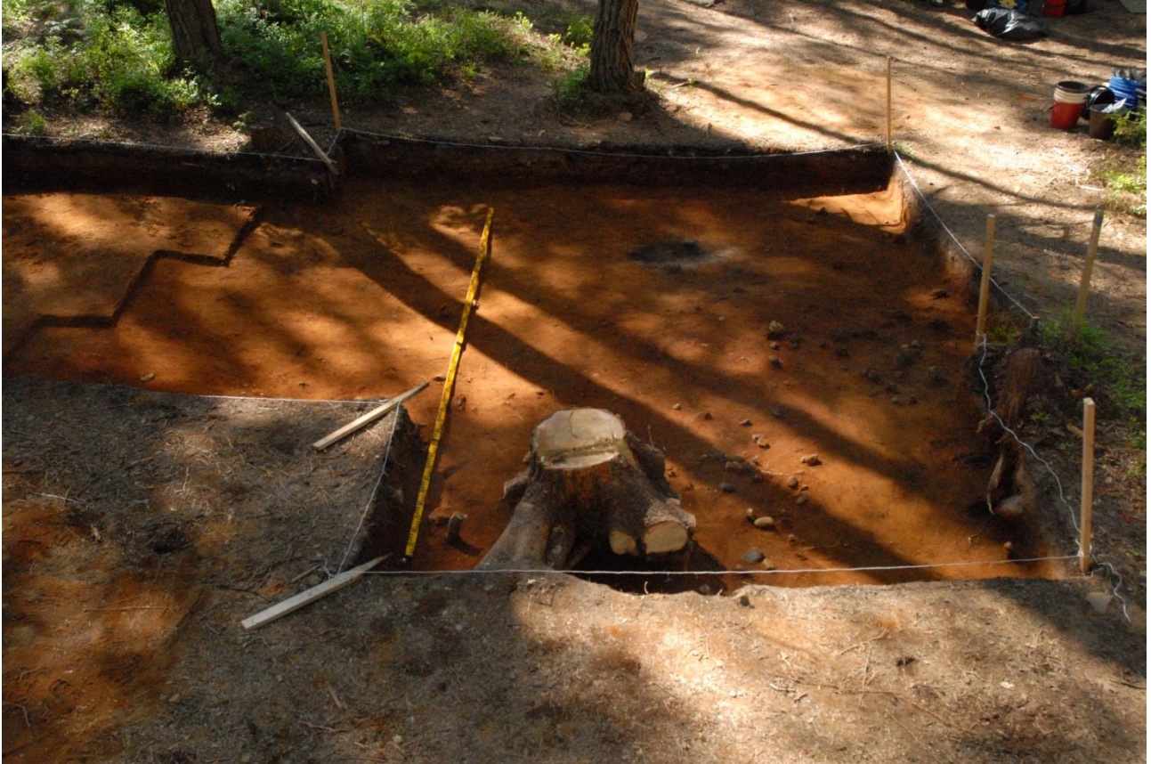
Kuva 208, Kaivausalue 7, taso 6, Nstä