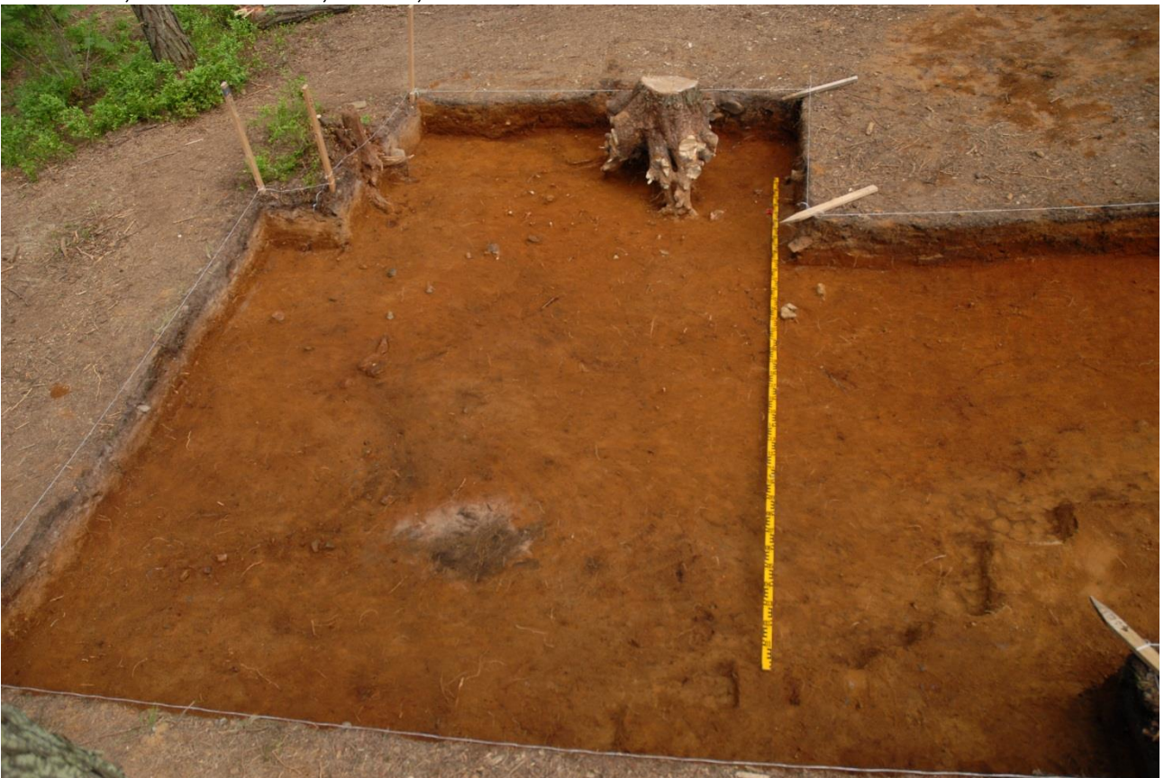
Kuva 217, Kaivausalue 7, taso 7, Sstä