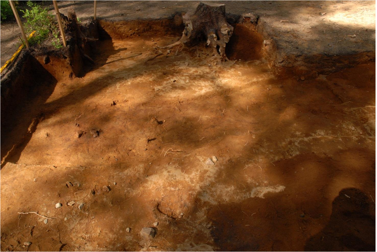
Kuva 240, Kaivausalue 7, taso 9, Sstä