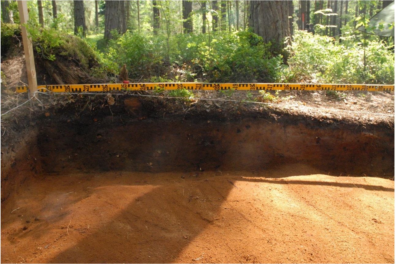
Kuva 201, Kaivausalue 7, profiili 87,00/102,00-105,00, Nstä