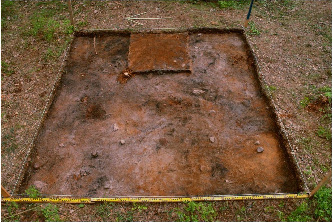
Kuva 161, Kaivausalue 8, taso 2, Wstä