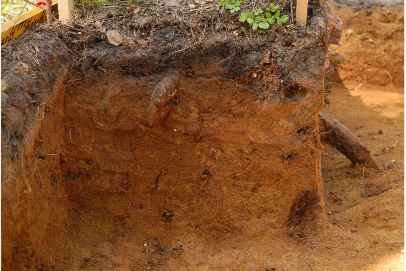
Kuva 238, Kaivausalue 7, profiili 90,00/97,50-98,00, Sstä