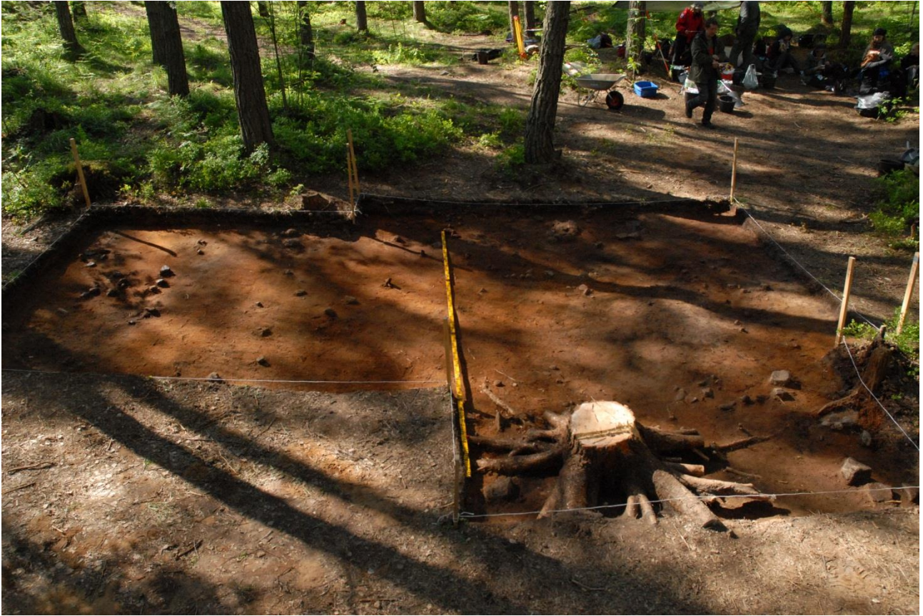
Kuva 173, Kaivausalue 7, taso 3, Nstä