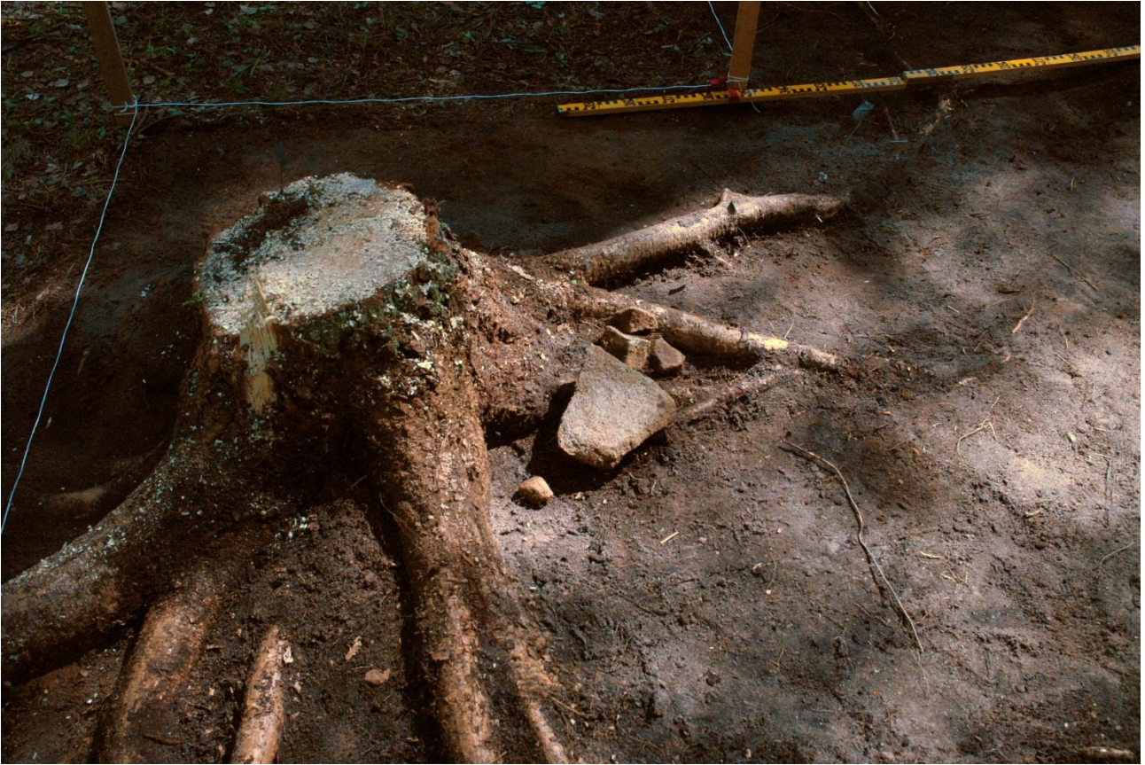
Kuva 158, Kaivausalue 7, taso 1, kivet ruudussa 90/99, Nstä