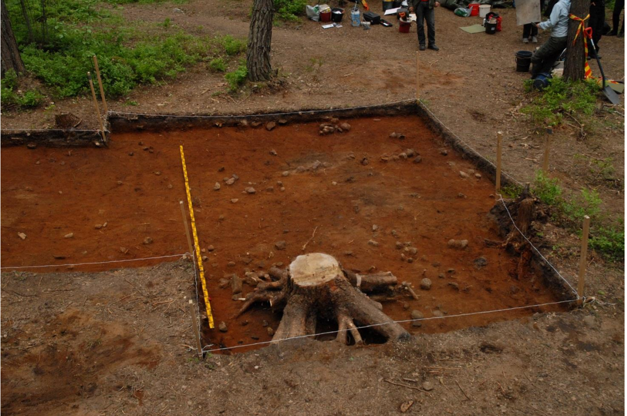
Kuva 186, Kaivausalue 1, taso 4, Nstä