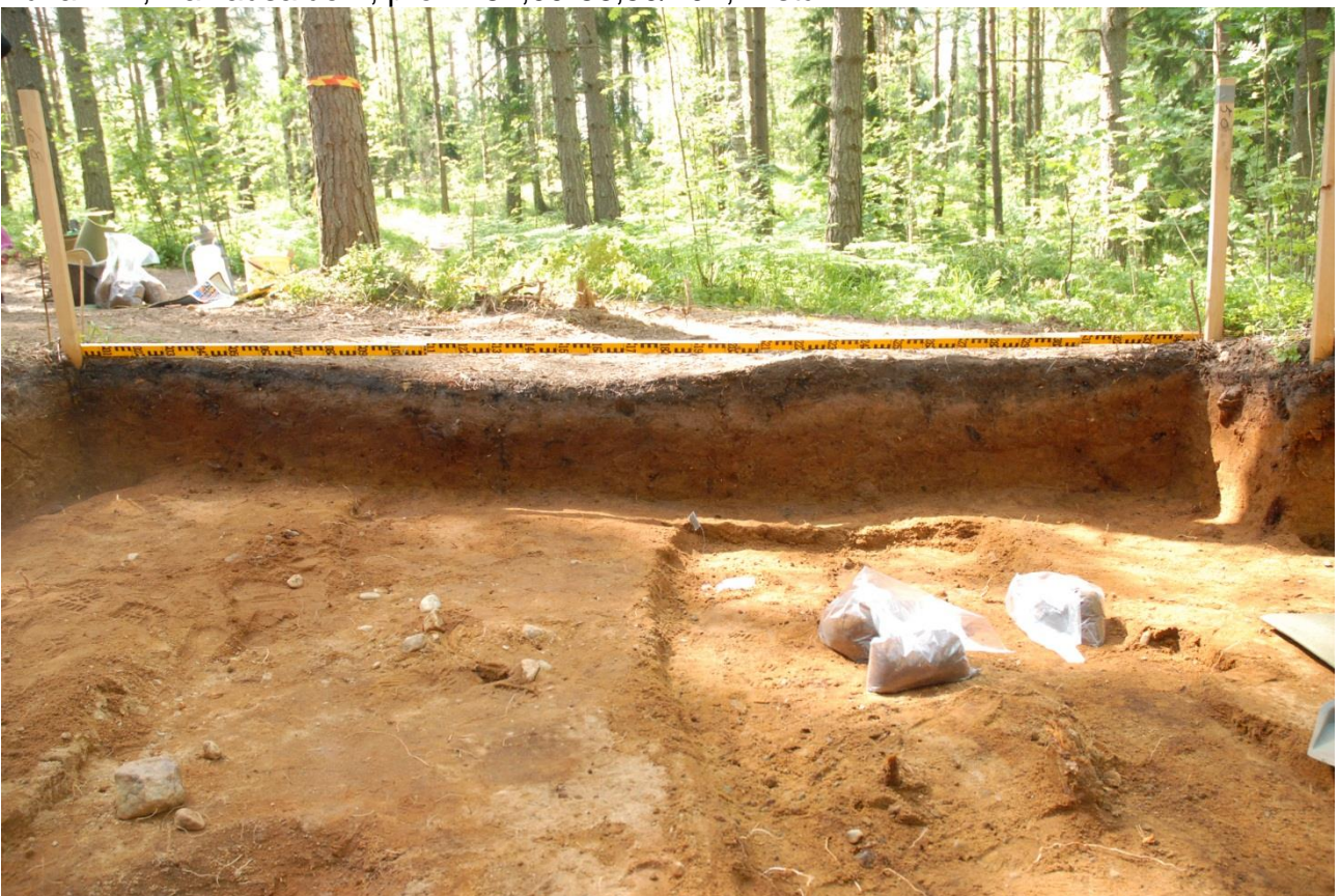
Kuva 237, Kaivausalue 7, profiili 86,50-90,00/97,00, Estä