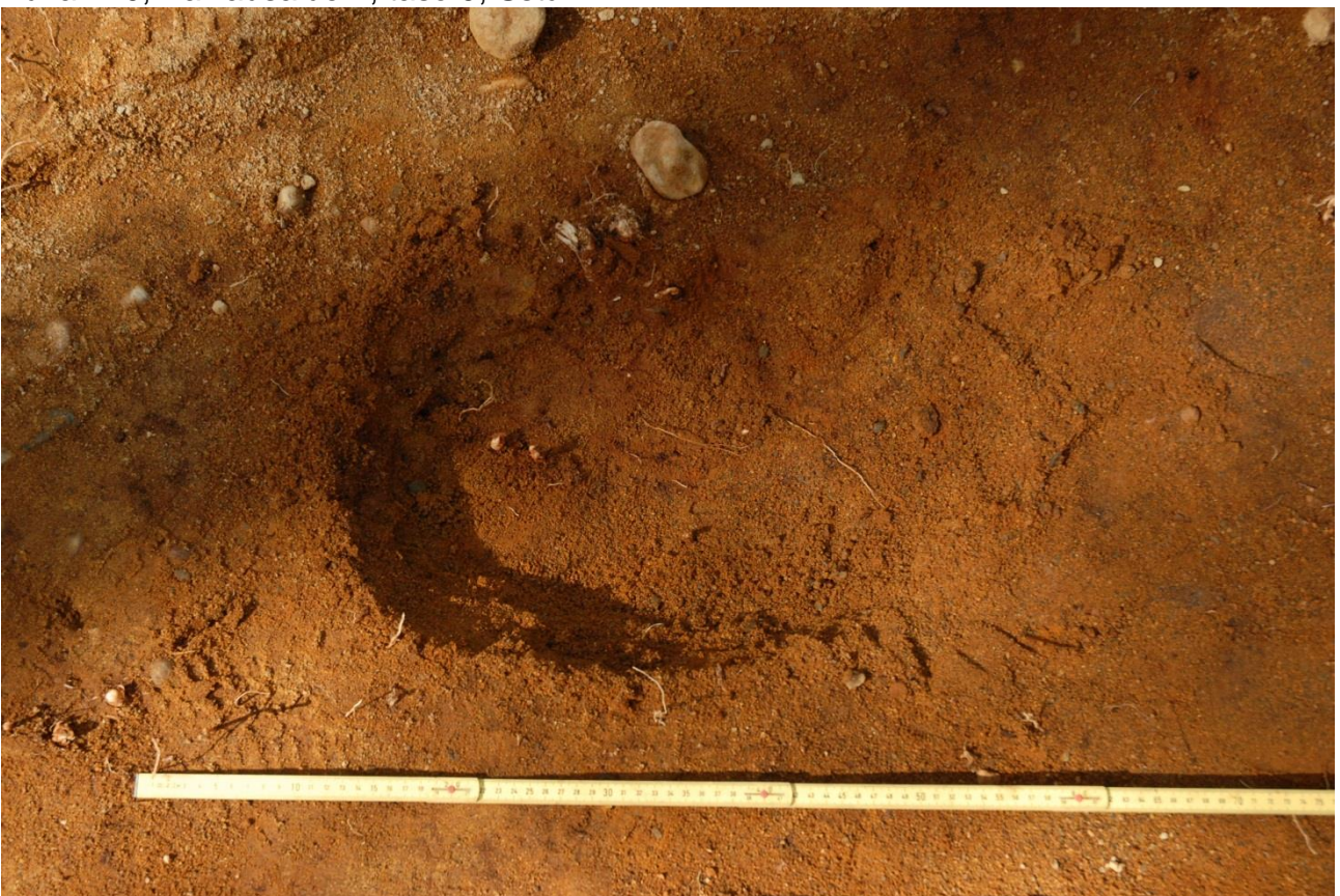
Kuva 241, Kaivausalue 7, taso 10, itäinen kuoppa, Sstä