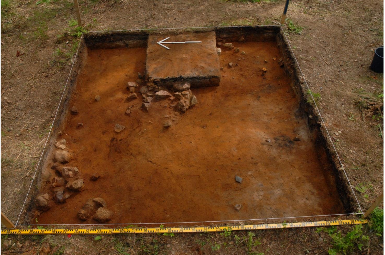
Kuva 182, Kaivausalue 8, taso 5, Wstä