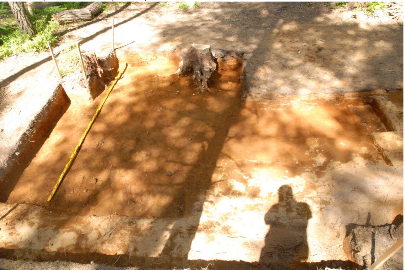
Kuva 236, Kaivausalue 7, taso 8, Sstä