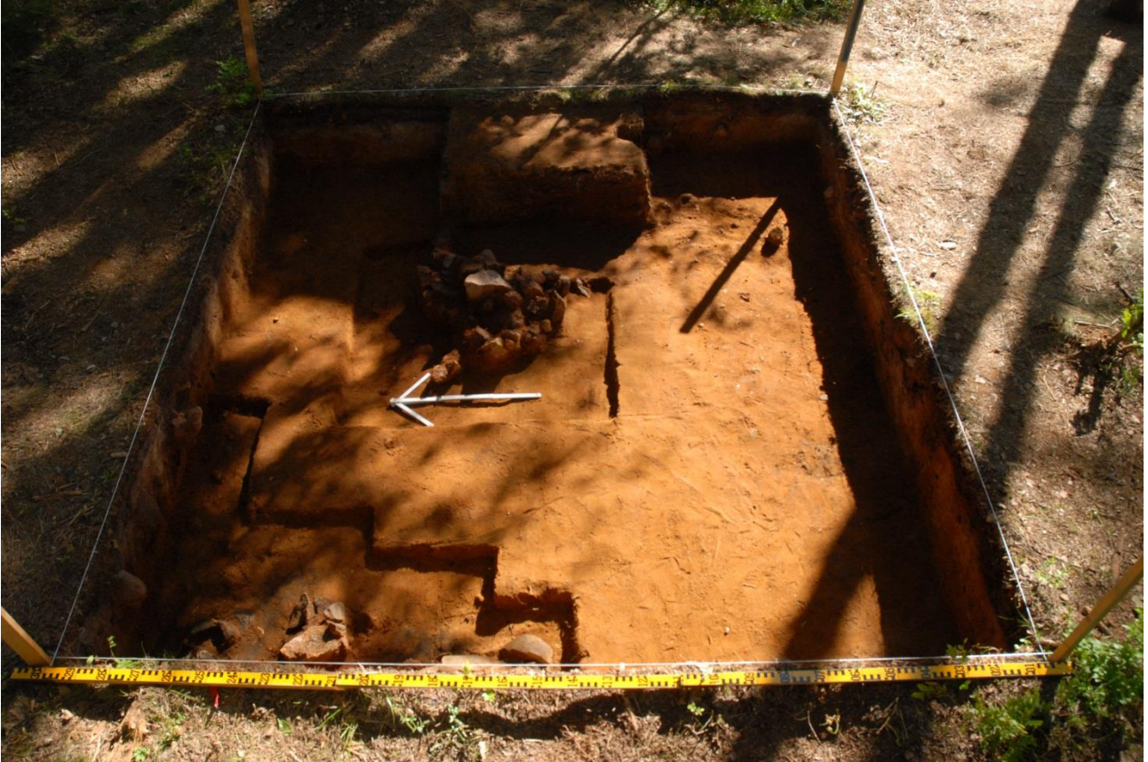
Kuva 205, Kaivausalue 8, taso 8, Wstä