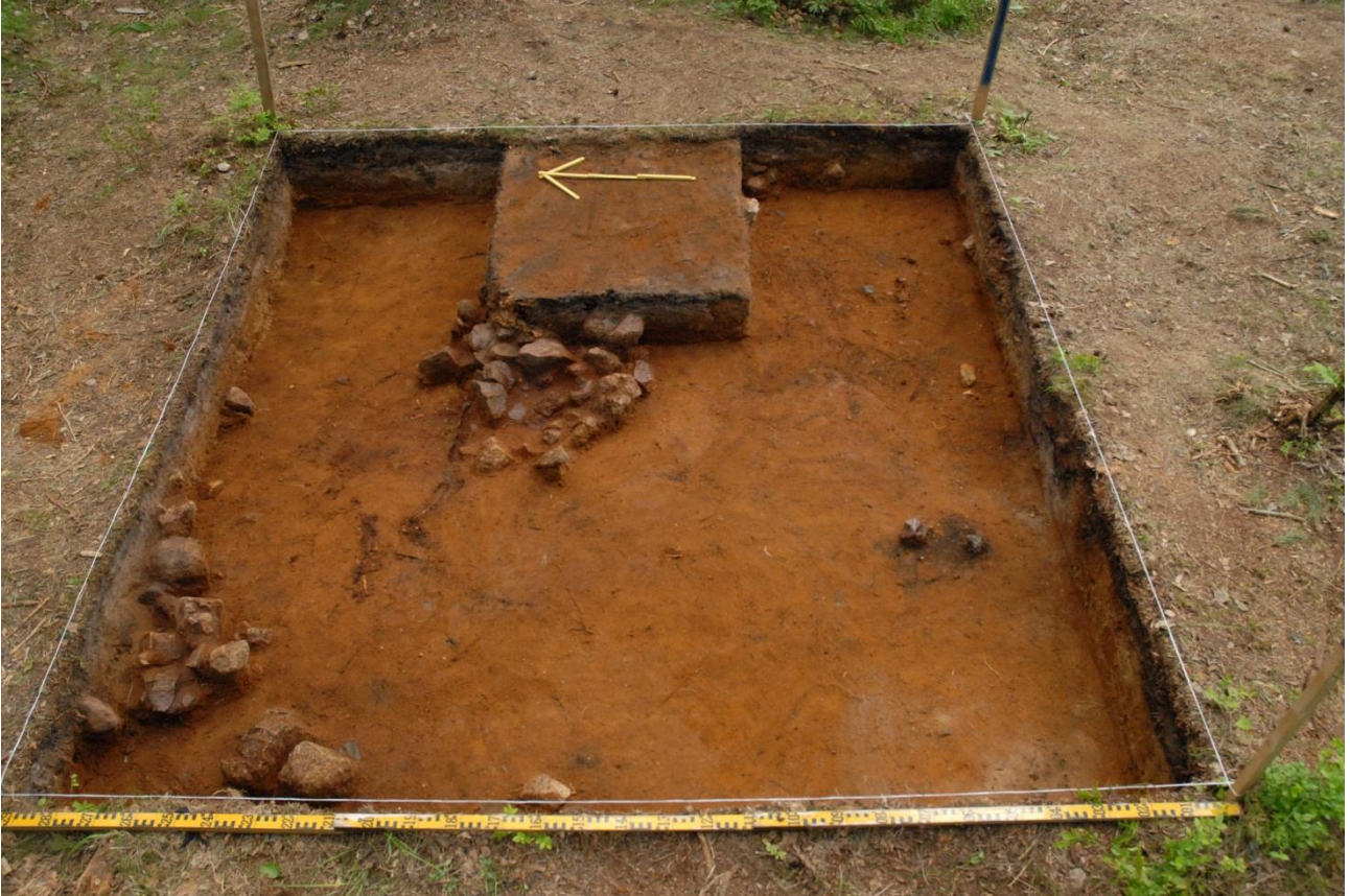
Kuva 190, Kaivausalue 8, taso 6, Wstä