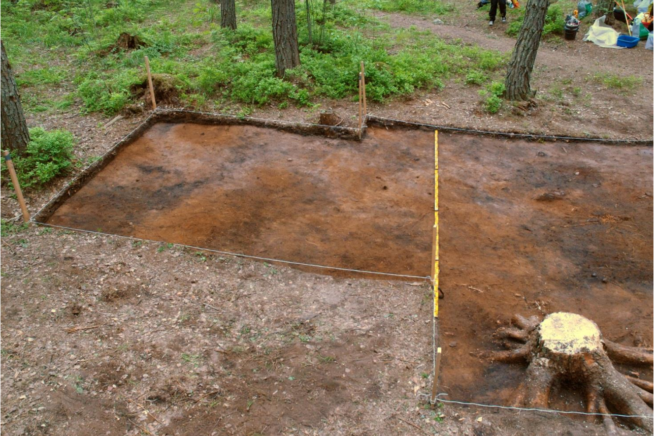
Kuva 164, Kaivausalue 7, taso 2, Nstä