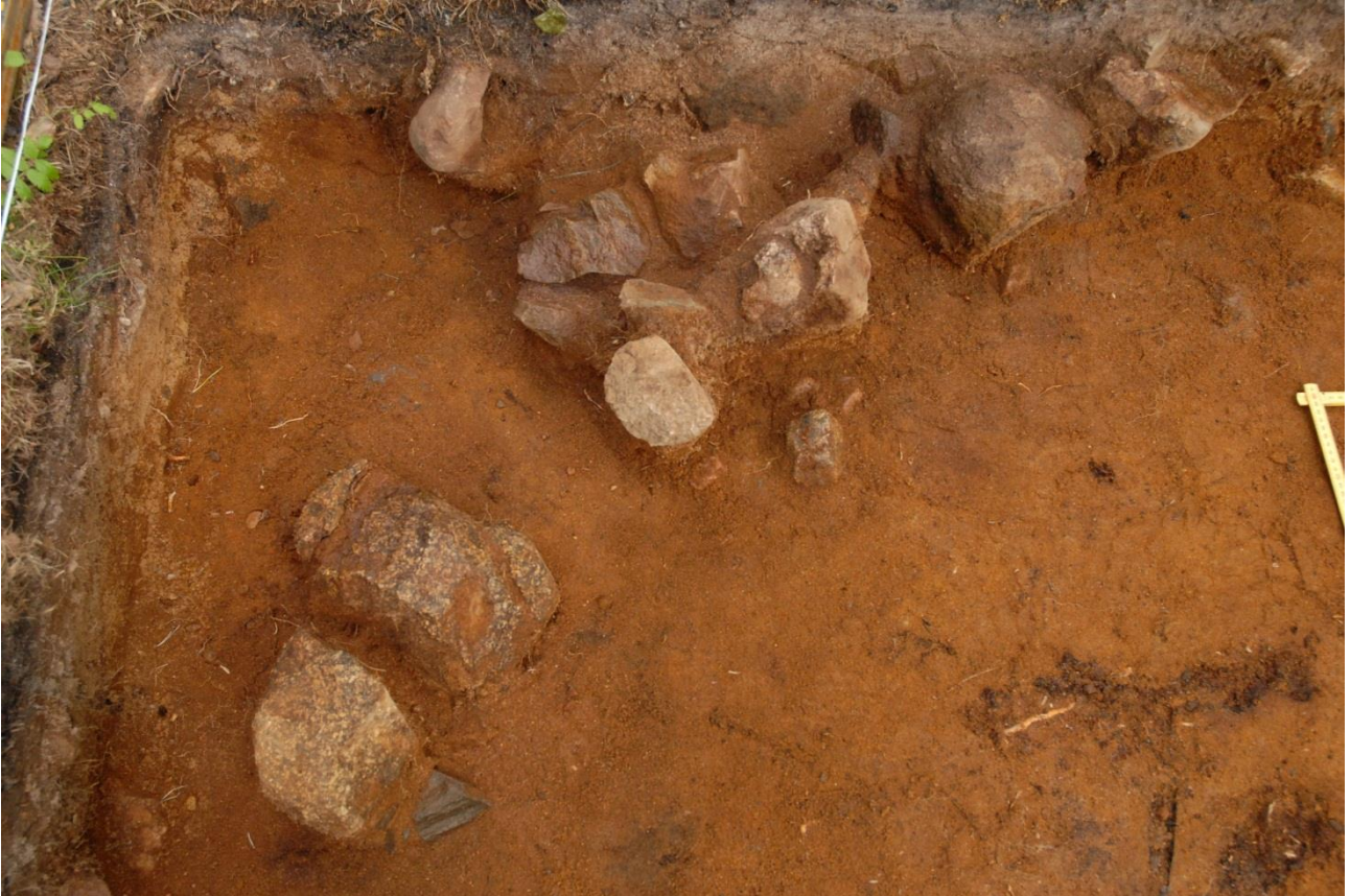
Kuva 192, Kaivausalue 8, taso 6, liesi 2, Sstä