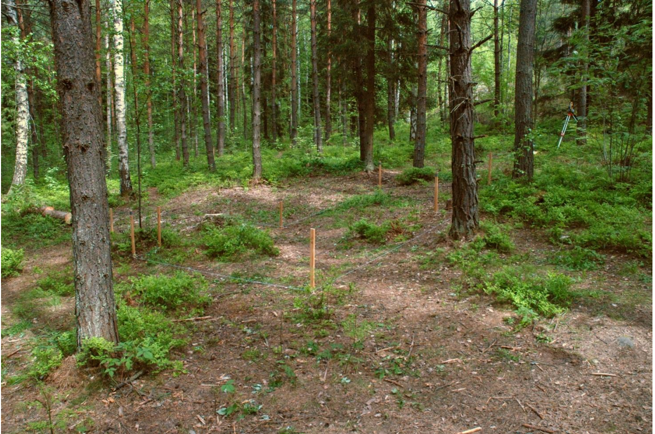
Kuva 152, Kaivausalue 7 paaluttamisen jälkeen, SWstä