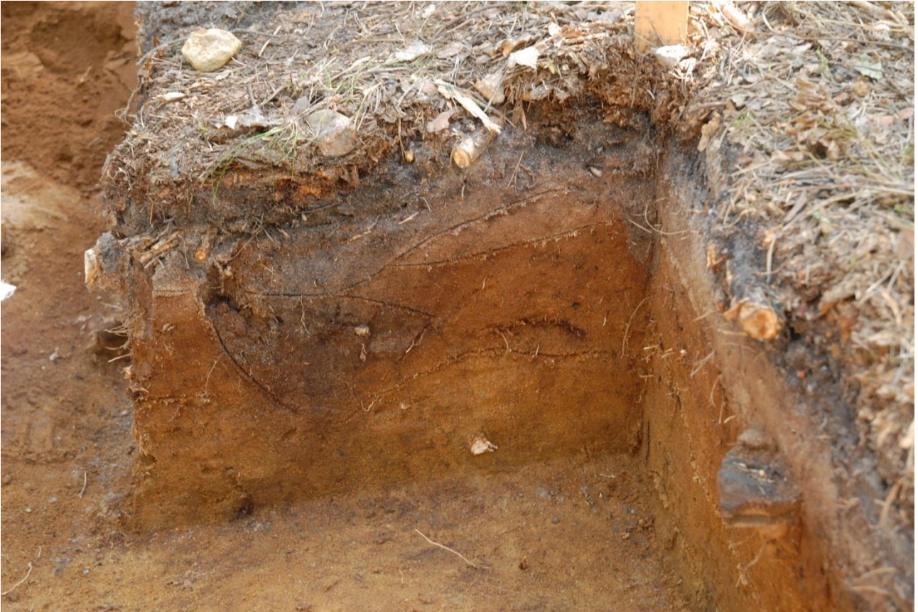
Kuva 224, Kaivausalue 7, profiili 87,00-86,50/102, Wstä