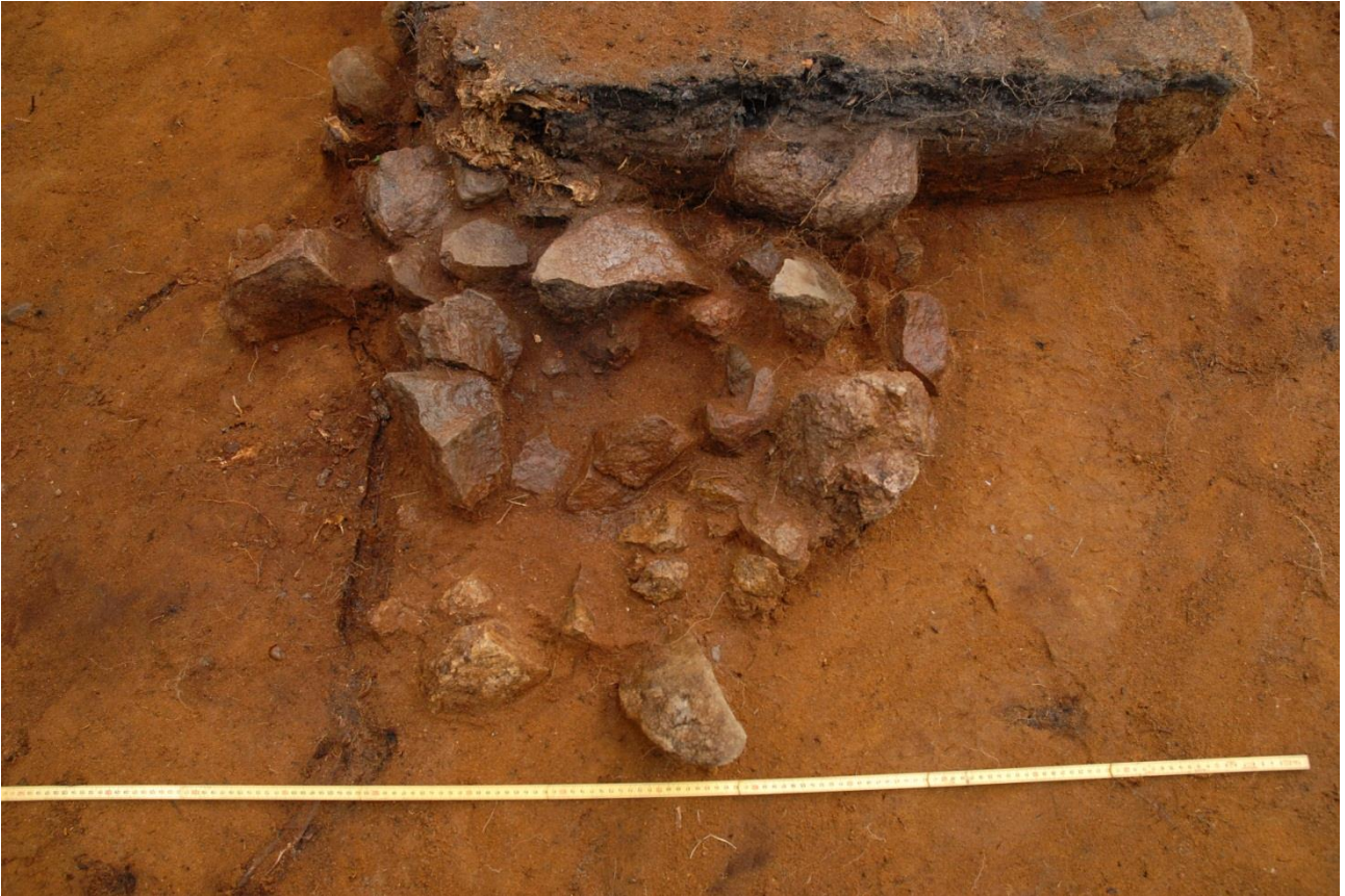
Kuva 191, Kaivausalue 8, taso 6, liesi 1, Wstä