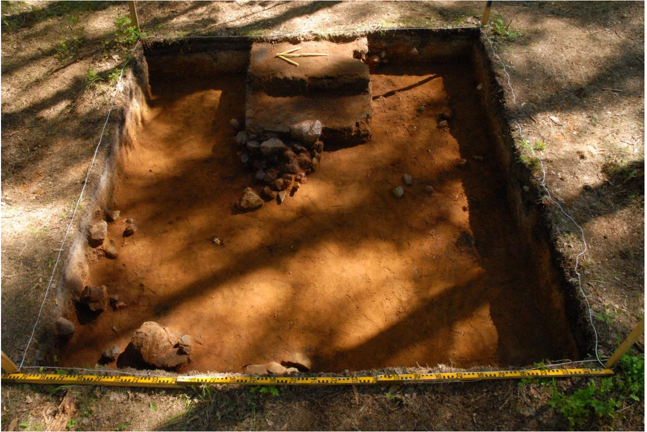
Kuva 198, Kaivausalue 8, taso 7, Wstä