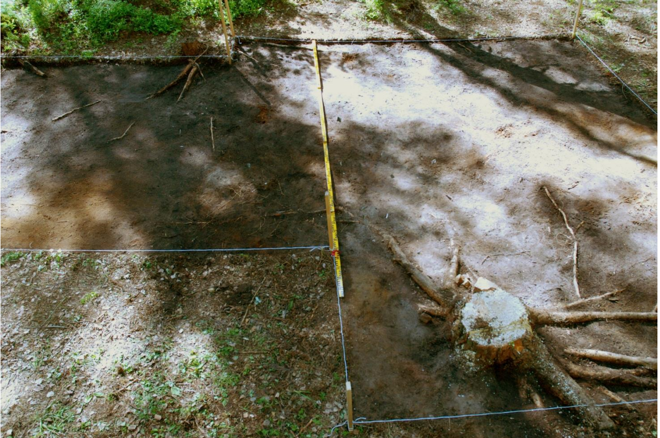
Kuva 157, Kaivausalue 7, taso 1, Nstä