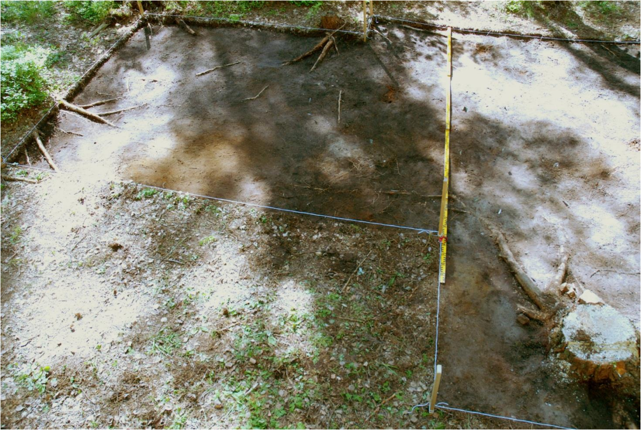
Kuva 155, Kaivausalue 7, taso 1, Nstä