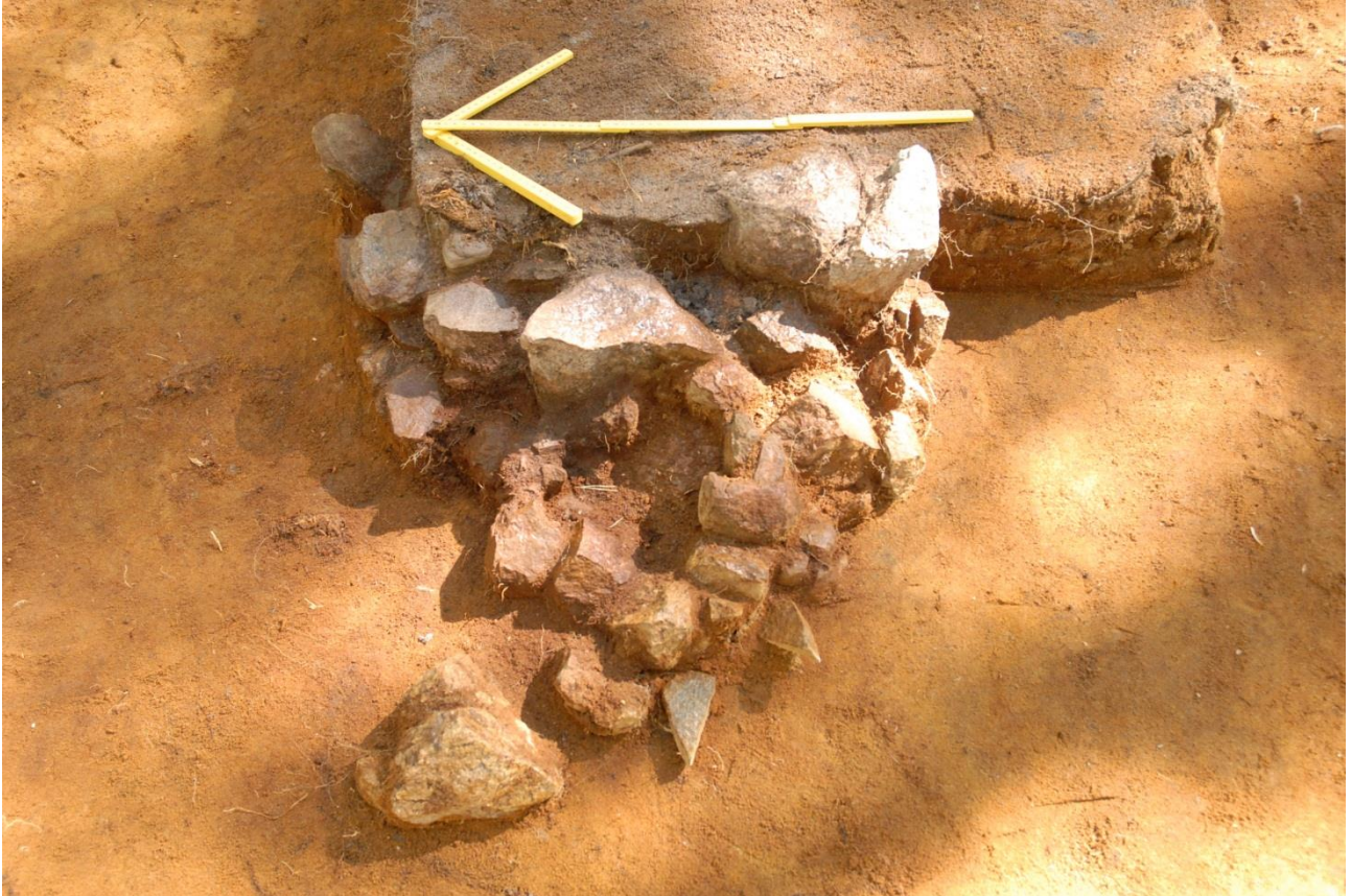
Kuva 199, Kaivausalue 8, taso 7, liesi 1, Wstä