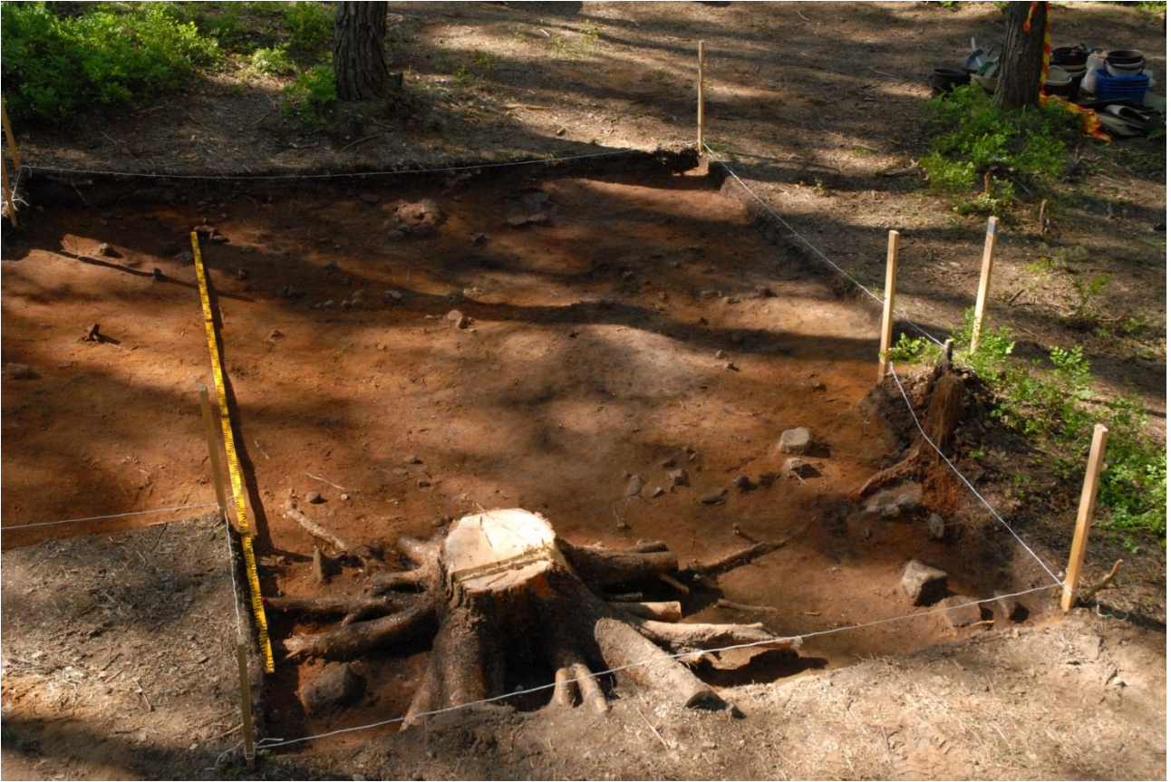
Kuva 175, Kaivausalue 7, taso 3, Nstä