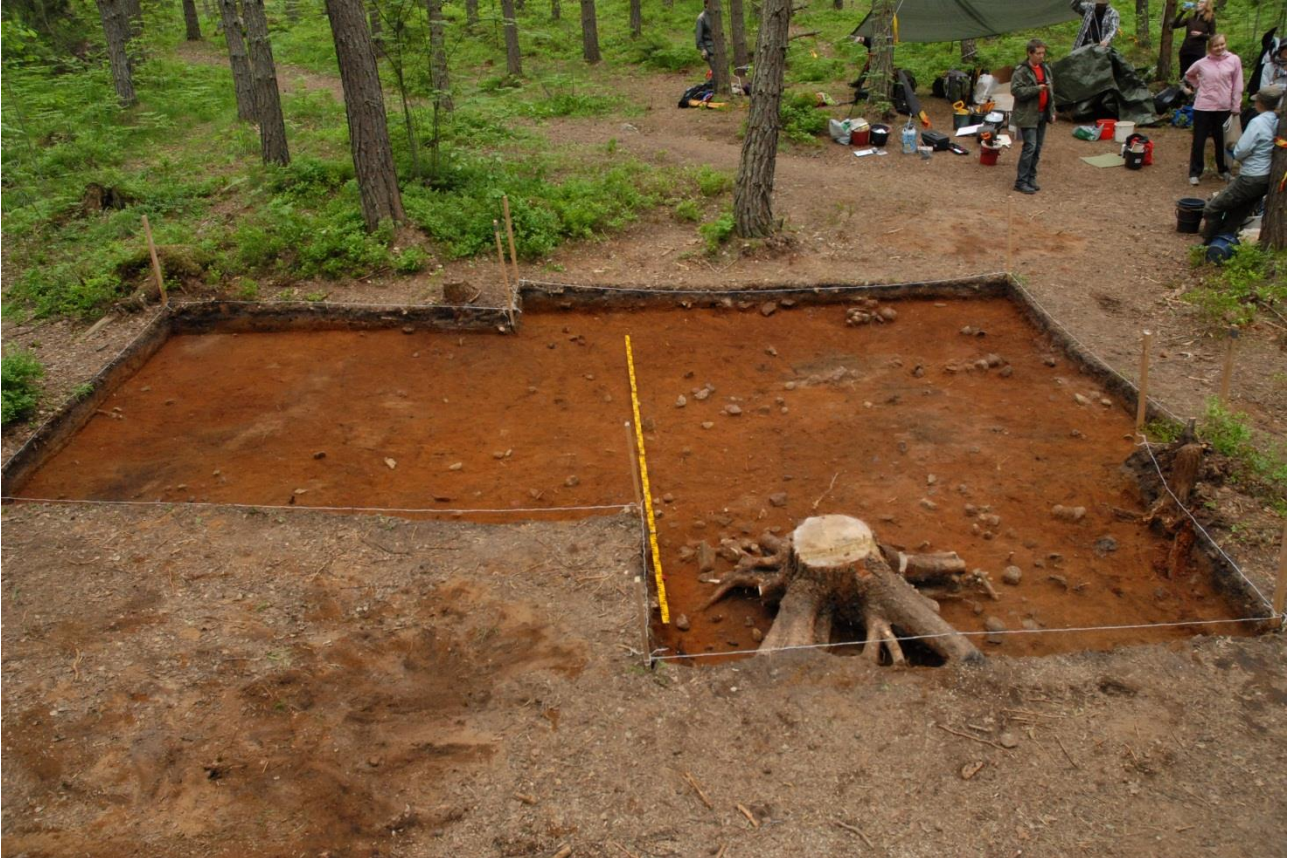
Kuva 184, Kaivausalue 7, taso 4, Nstä