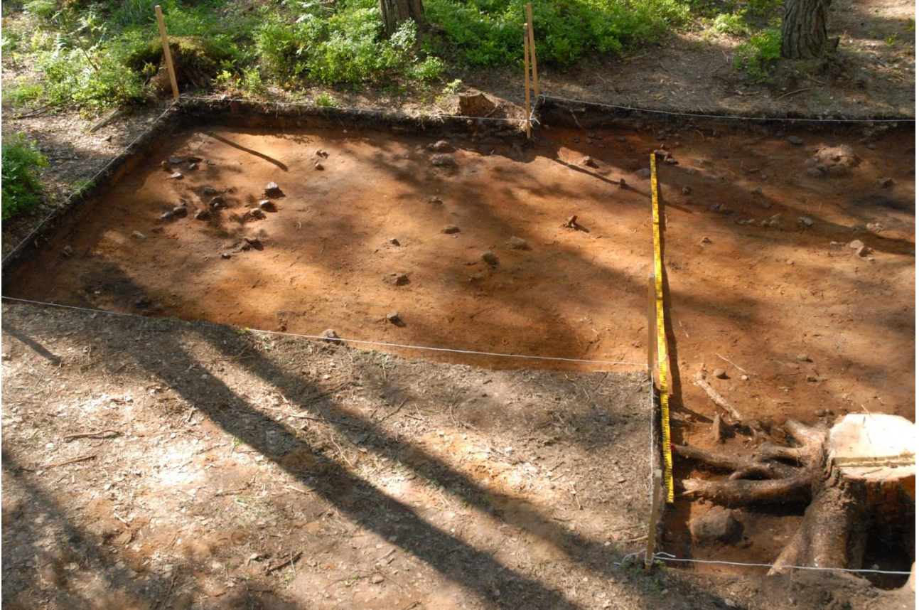
Kuva 174, Kaivausalue 7, taso 3, Nstä