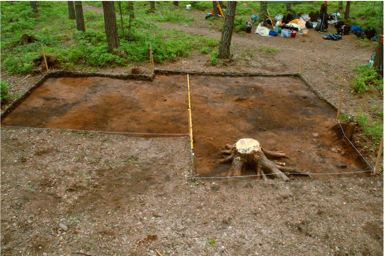
Kuva 167, Kaivausalue 7, taso 2, Nstä