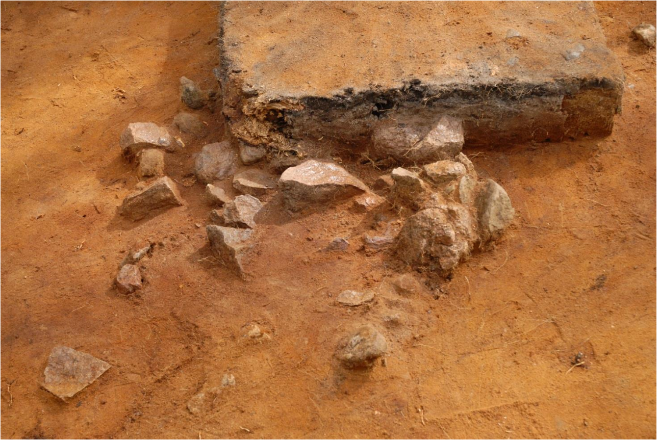
Kuva 183, Kaivausalue 8, taso 5, liesi 1, Wstä