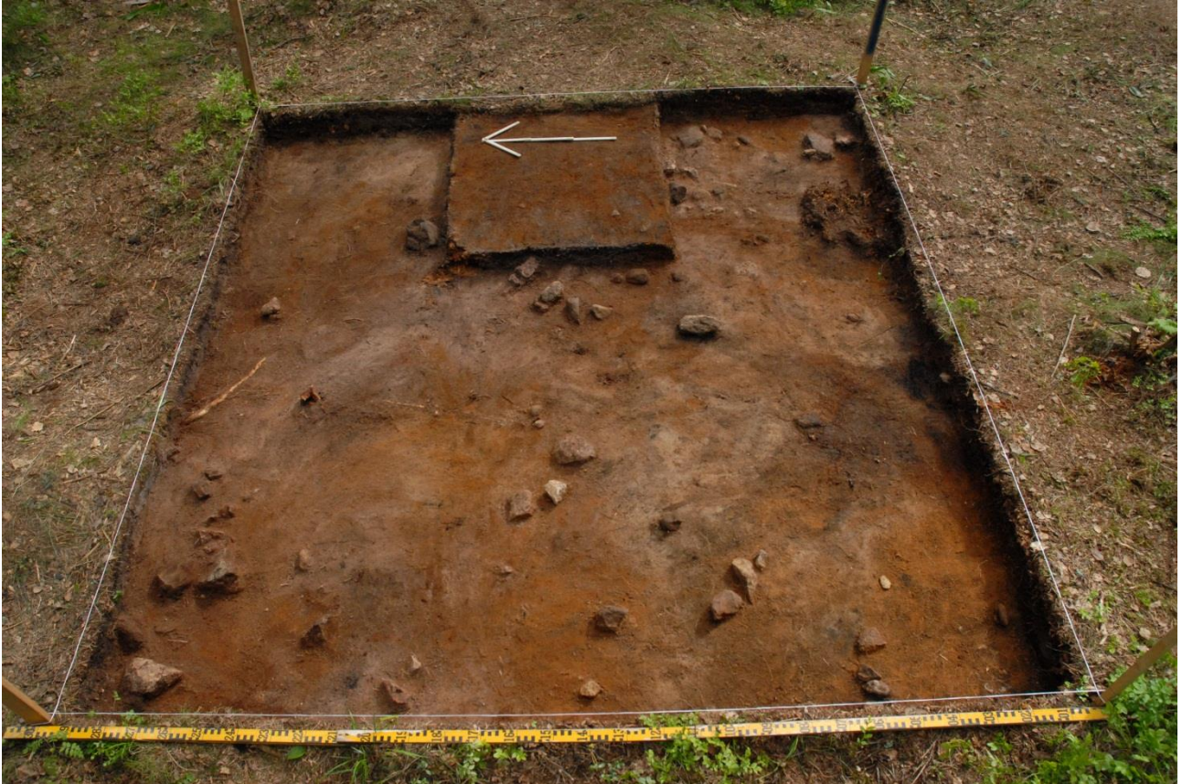
Kuva 170, Kaivausalue 8, taso 3, Wstä