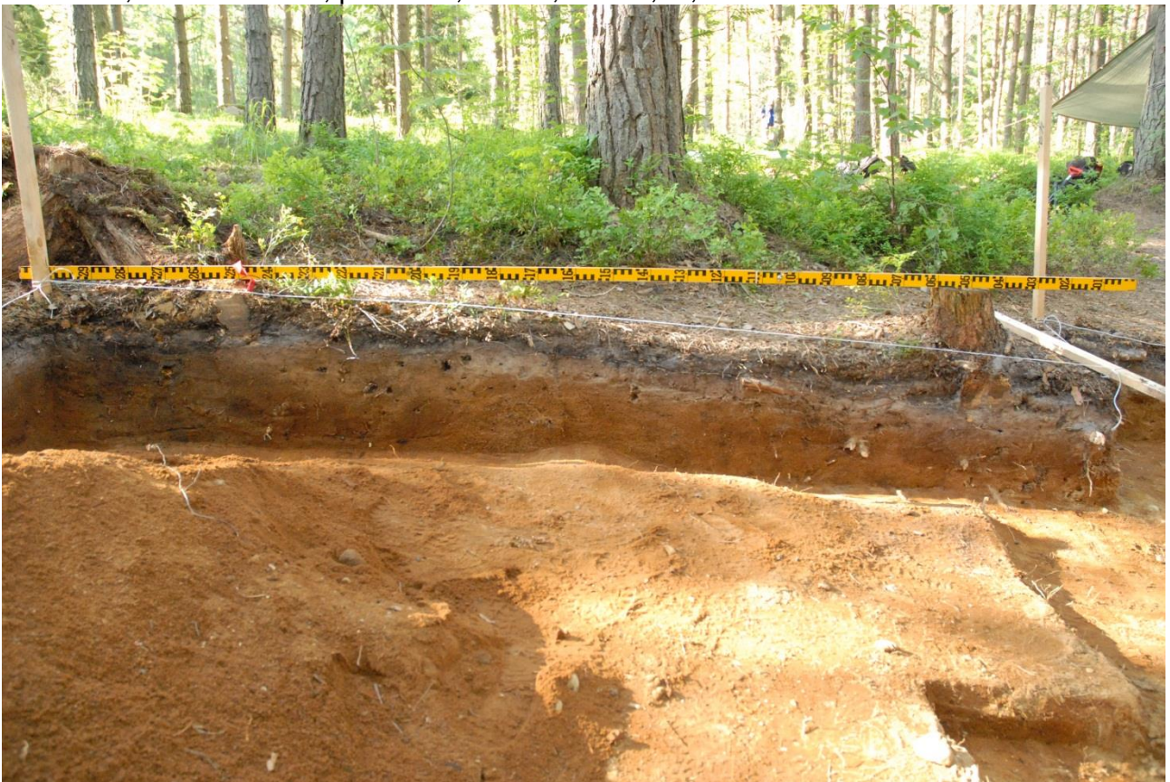
Kuva 212, Kaivausalue 7, profiili 87/105-102, Nstä