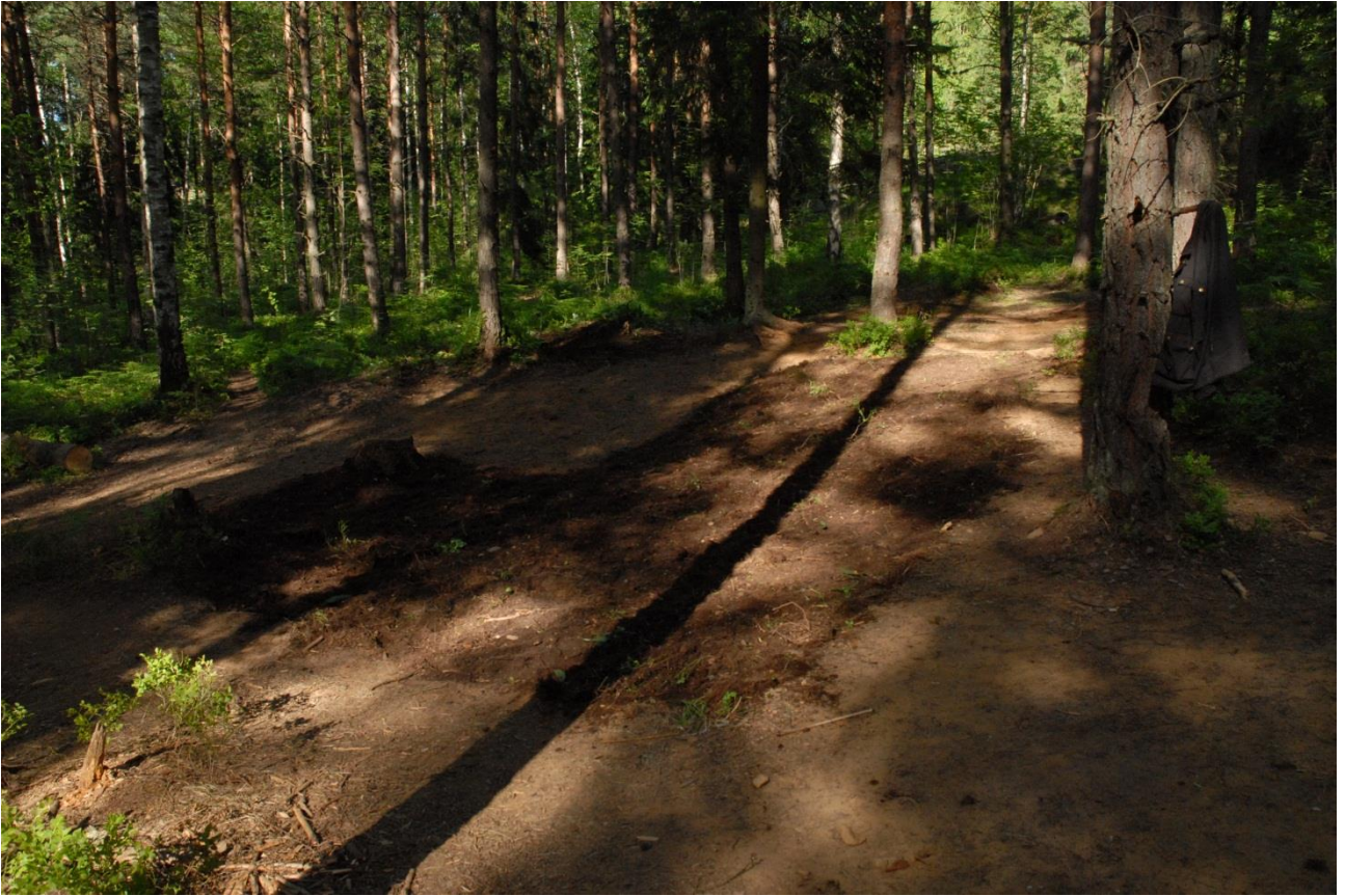
Kuva 246, Kaivausalue 8, peitettynä, SWstä