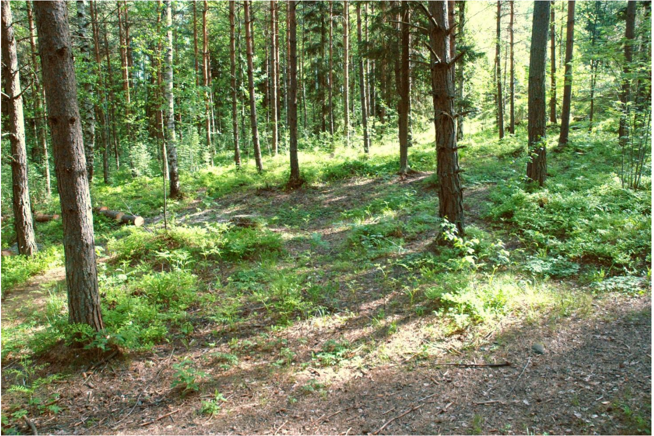
Kuva 151, Kaivausalue 7 ennen paaluttamista, SWstä