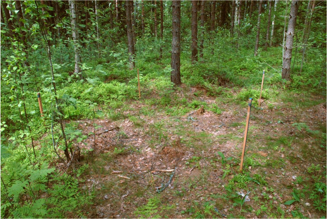
Kuva 153, Kaivausalue 8 paalutettuna, SEstä