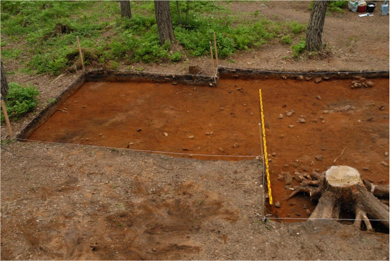
Kuva 185, Kaivausalue 7, taso 4, Nstä