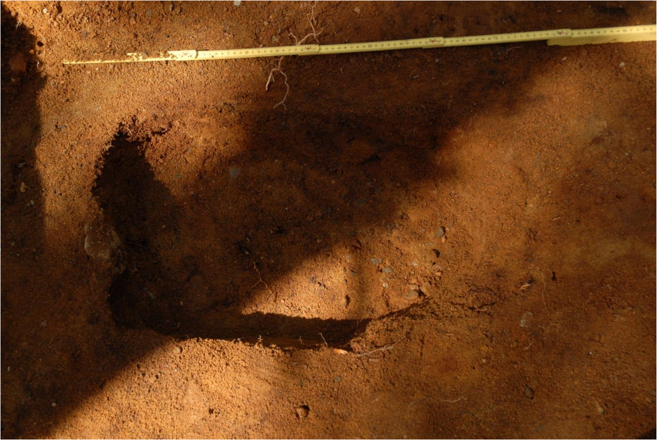
Kuva 242, Kaivausalue 7, taso 10, läntinen kuoppa, Sstä