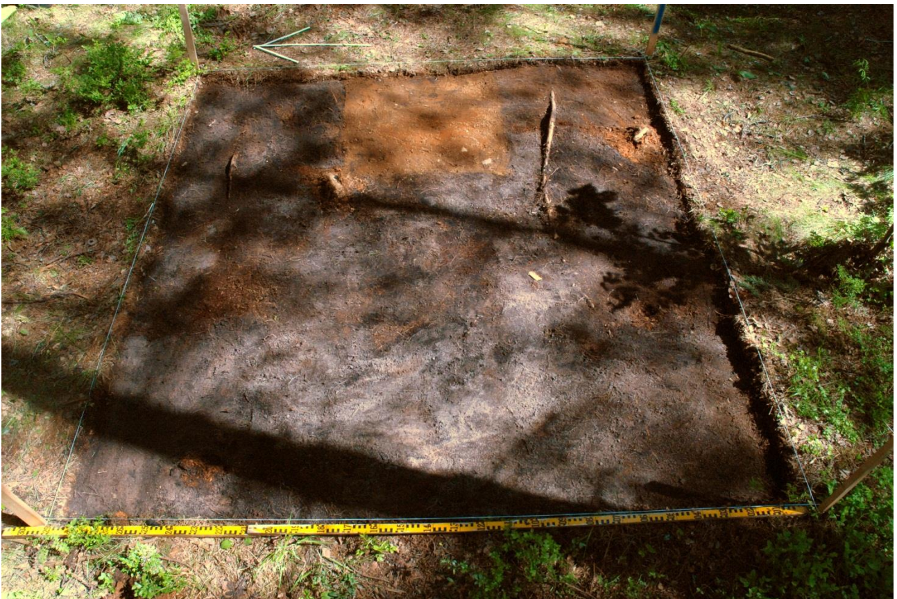
Kuva 159, Kaivausalue 8, taso 1, Wstä