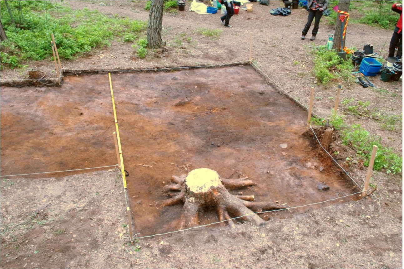
Kuva 165, Kaivausalue 7, taso 2, Nstä