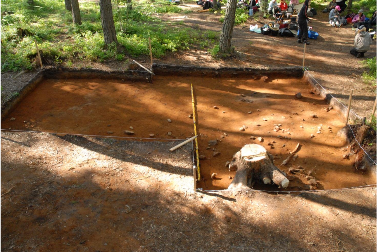
Kuva 197, Kaivausalue 7, taso 5, Nstä