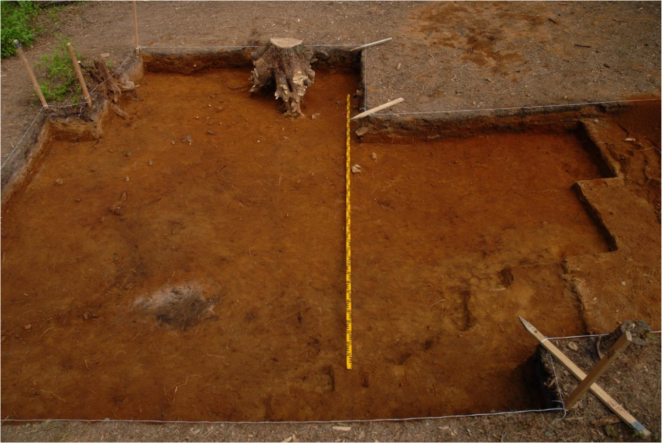
Kuva 218, Kaivausalue 7, taso 7, Sstä