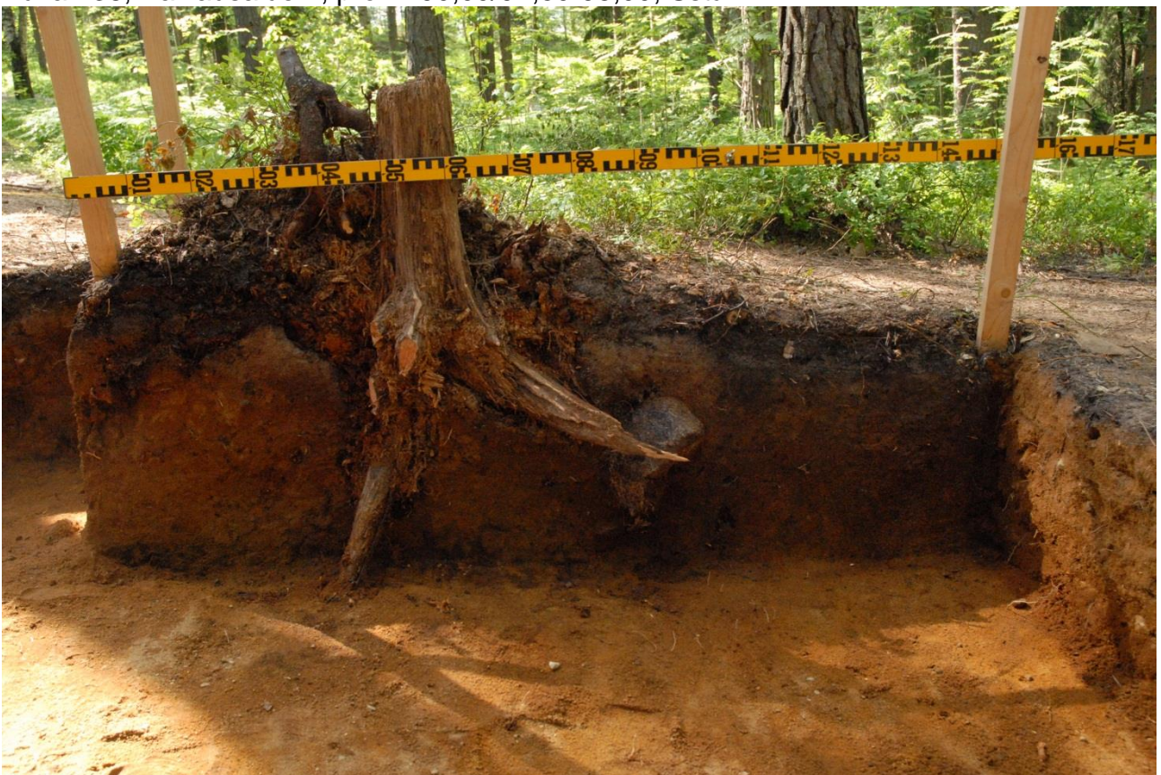
Kuva 239, Kaivausalue 7, profiili 90,00-91,50/98,00, Estä