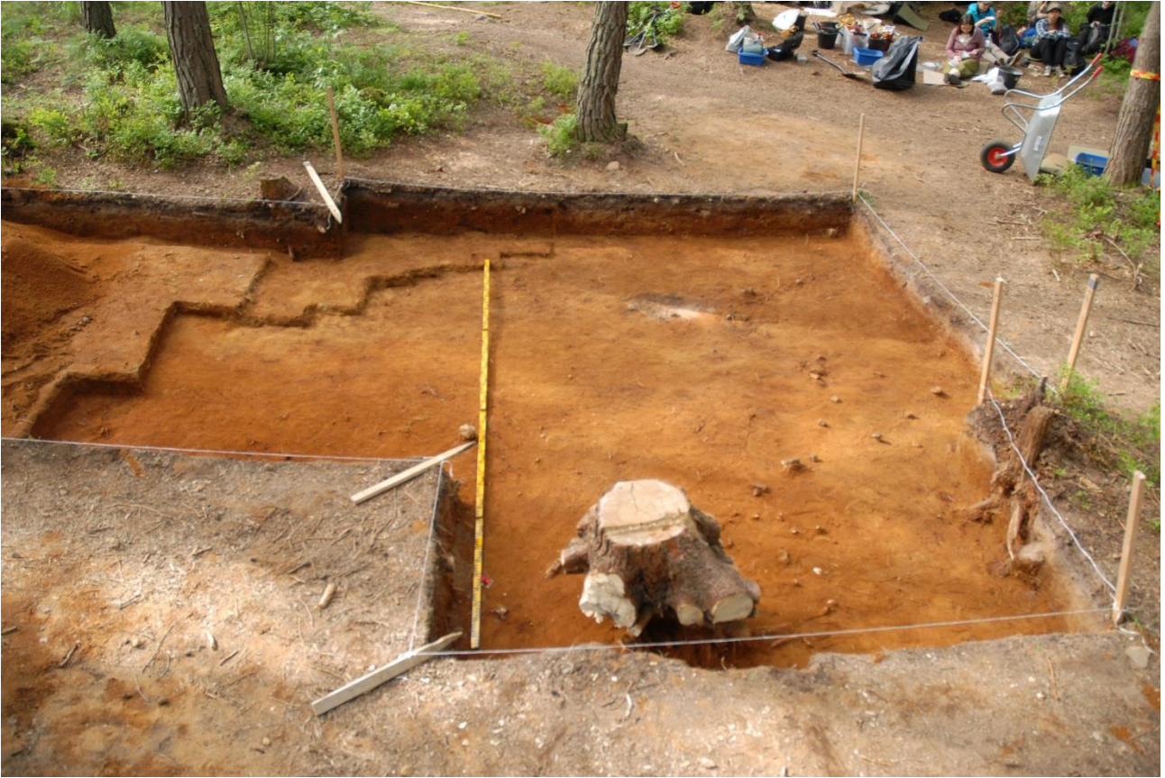
Kuva 216, Kaivausalue 7, taso 7, Nstä