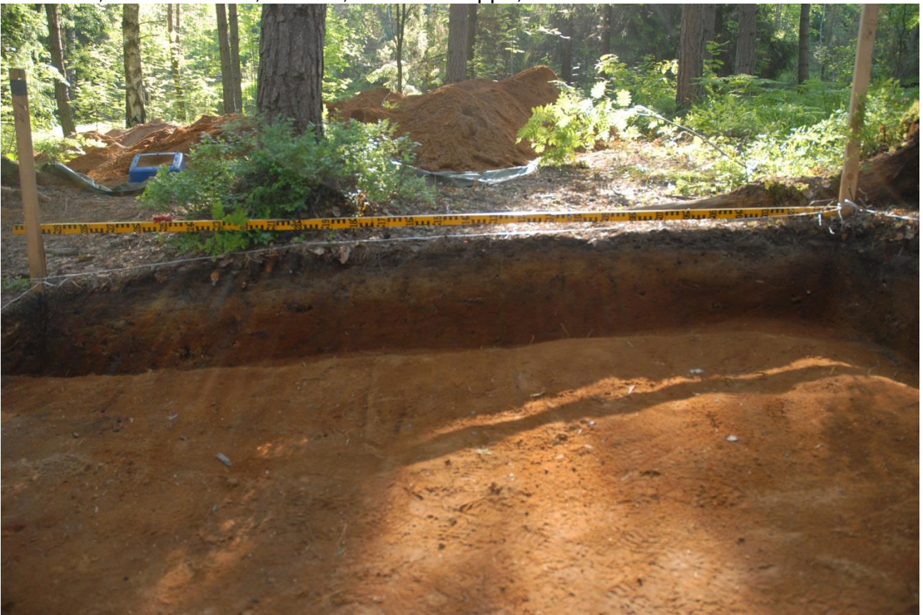
Kuva 202, Kaivausalue 7, profiili 90-87/105, Wstä