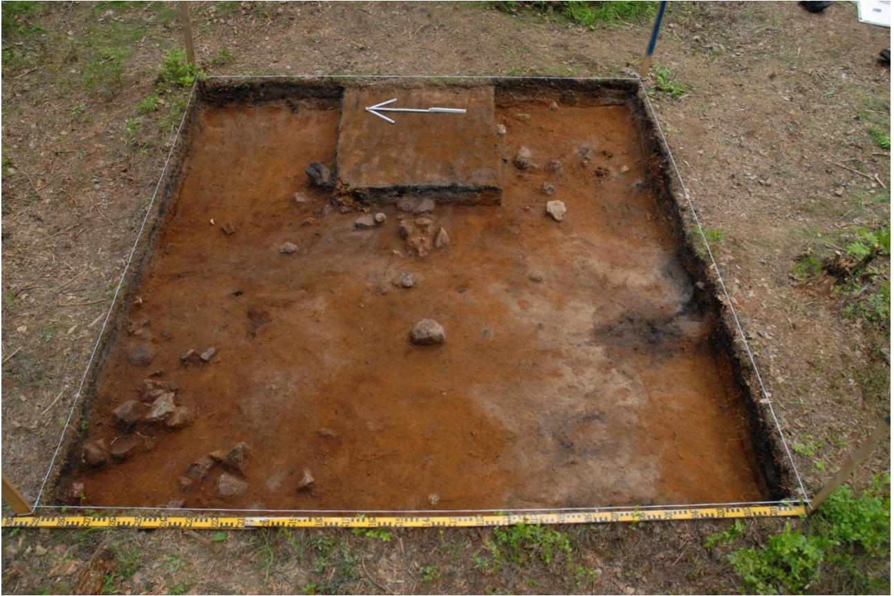
Kuva 178, Kaivausalue 8, taso 4, Wstä