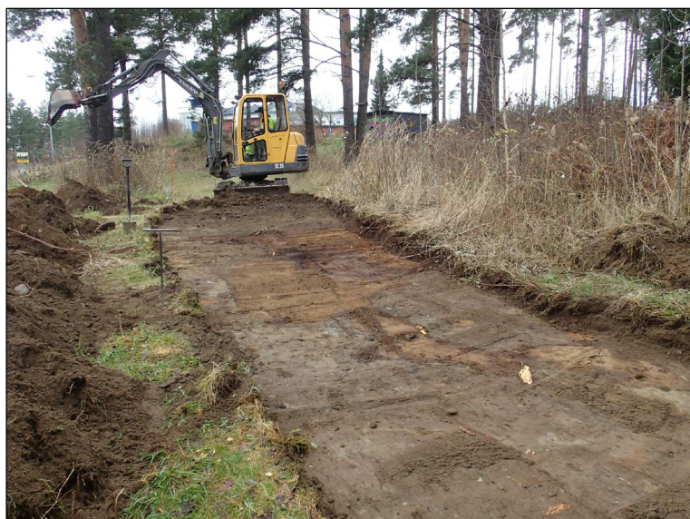
Puistokäytävän kaakkoisosaa kaivettuna määräsyyvyteen.