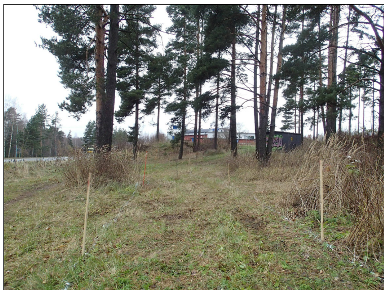
Maastoon merkittyä puistokäytävän linjaa ennen kaivamista