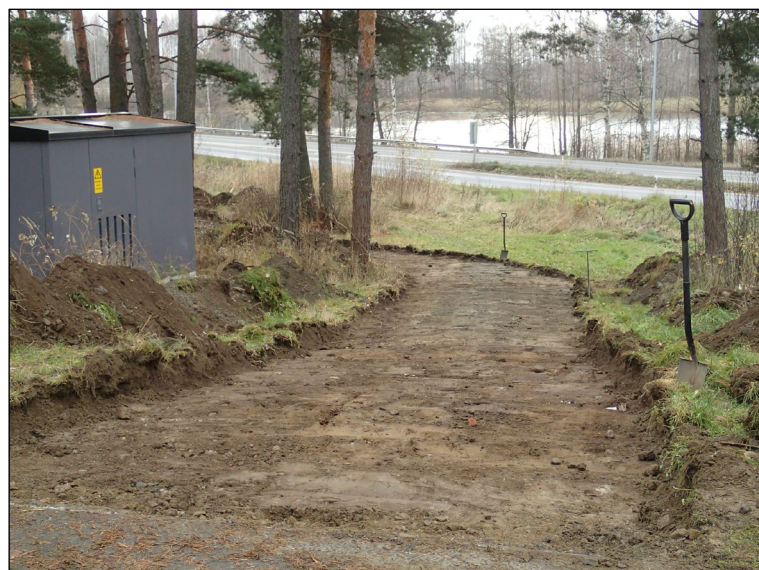
Puistokäytävän luoteisosaa kaivettuna määräsyytyteen