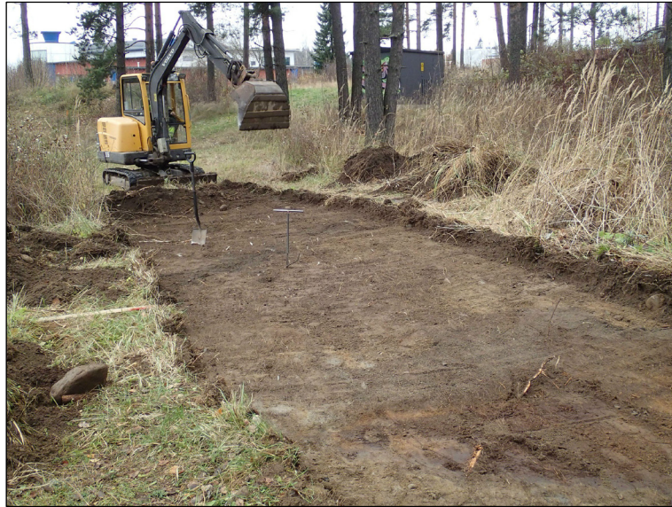
Puistokäytävän keskiosaa kaivettuna määräsyytyteen