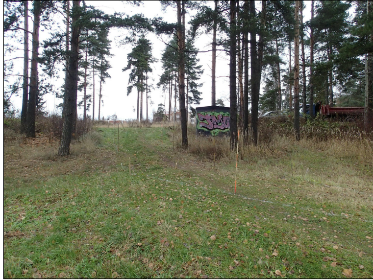
Maastoon merkittyä puistokäytävän linjaa ennen kaivamista