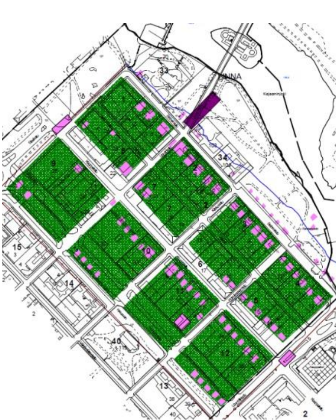
Kuvat 1. Vuoden 1659 kartta asemituna Kajaanin nykyisen asemakaavan päälle. Rakennukset merkitty vaalean punaisella ja rantaviiva sinisellä (Mökkönen 2001: Liite 3.1.)

Huomioitavaa on myös rantaviivan siirtyminen puiston alueella. Vuoden 1659 kartan perusteella rantaviiva on tuolloin sijoittunut kutakuinkin Eino Leinon muistomerkin paikkeilla kun taas satakunta vuotta myöhemmin 1764 ranta on asettunut jo varsin lähelle nykyistä. Nykyisellä paikallaan ranta on viimeistään 1800-luvun alusta lähtien (Mökkönen 2001).