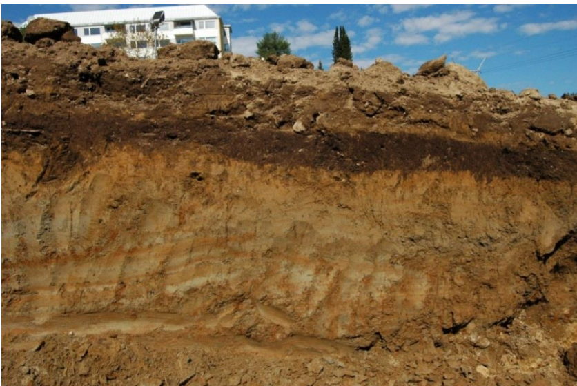
Kuva 4. Profiili 1: n maakerrokset, AKDG3231: 11.