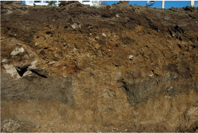
Kuva 3. Profiili 2 sekä havaittu kuoppailmiö, AKDG3231: 9.

Näiden lisäksi aivan kaivannon lopusta, Kajaanijoen rannalta, tavattiin yhden neliömetrin alalta epämääräinen joukko punatiilen kappaleita, sekä betonisia viemäriputkia, joiden rakenteellisuutta oli hankala todeta. Kyseessä oli todennäköisesti melko tuore ilmiö, sillä tiilten seassa havaittiin moderneja esinelöytöjä, mm. Alkon logolla varustettu pullon korkki. Ilmiö dokumentoitiin valokuvaamalla. Kaivanto saatiin pian tämän jälkeen päätökseensä, eikä valvonnalle enää nähty tarvetta.