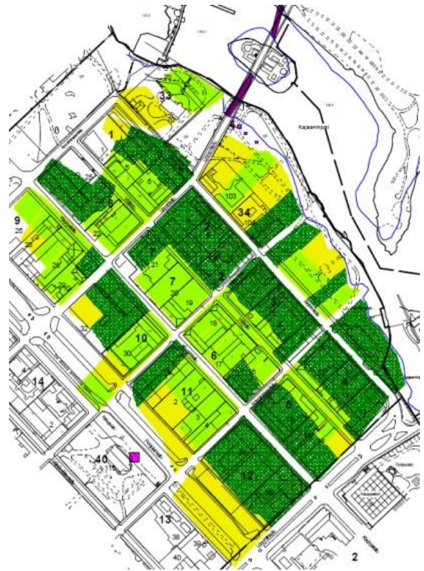
Kuva 2. Vuoden 1764 kartta asemituna Kajaanin nykyisen asemakaavan päälle. Korttelialueet merkitty tumman vihreällä. Keltainen ja vaalean vihreä ovat peltoja/niittyjä (Mökkönen 2001: 3.2.).