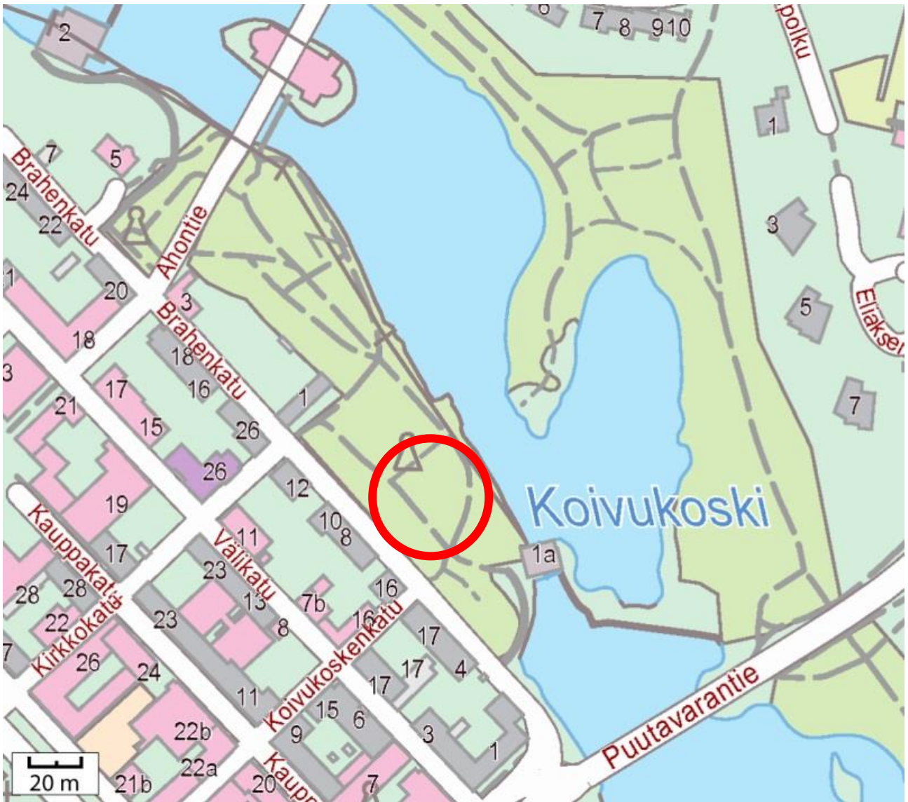
Peruskarttaote. Valvottu alue merkitty ympyrällä. Lisäykset: V. Hakamäki 29. toukokuuta 2013.