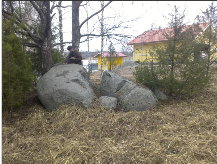
Merkkikivi. Sepänmaa tutkii merkkiä. Taustalla Kirkkojärvi.