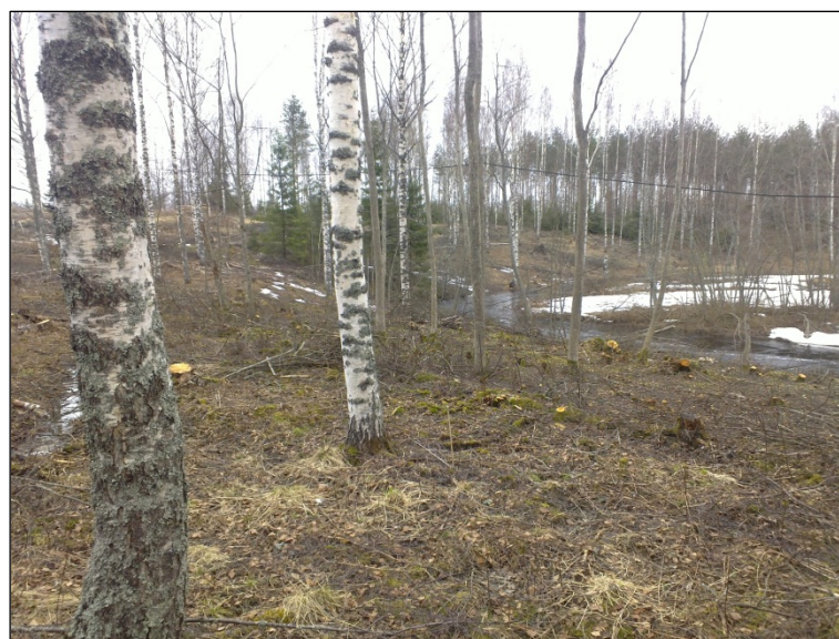
Maastoa alueen luoteisosassa, Kirkkojärveen laskevan joen etelärannalla.