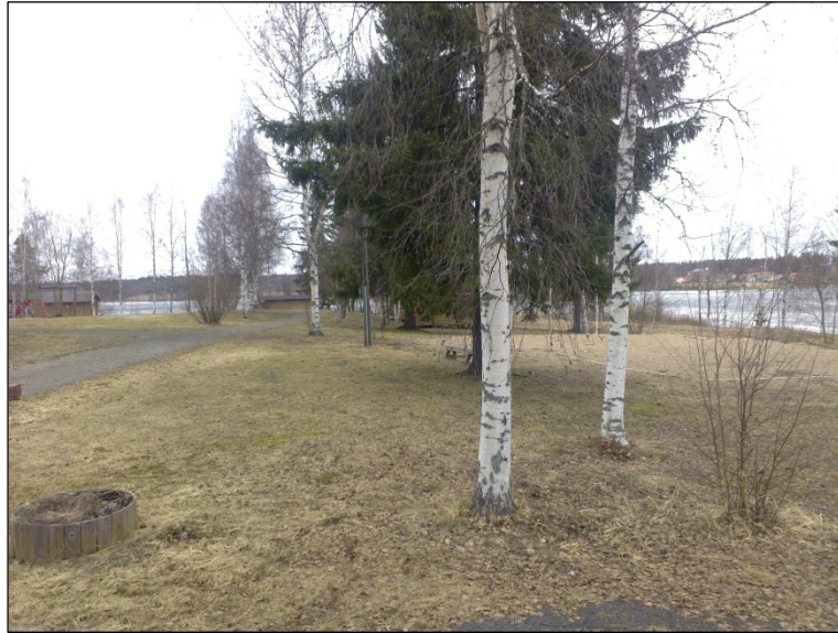
Leirintäalueen maastoa Kirkkojärven etelärannalla.