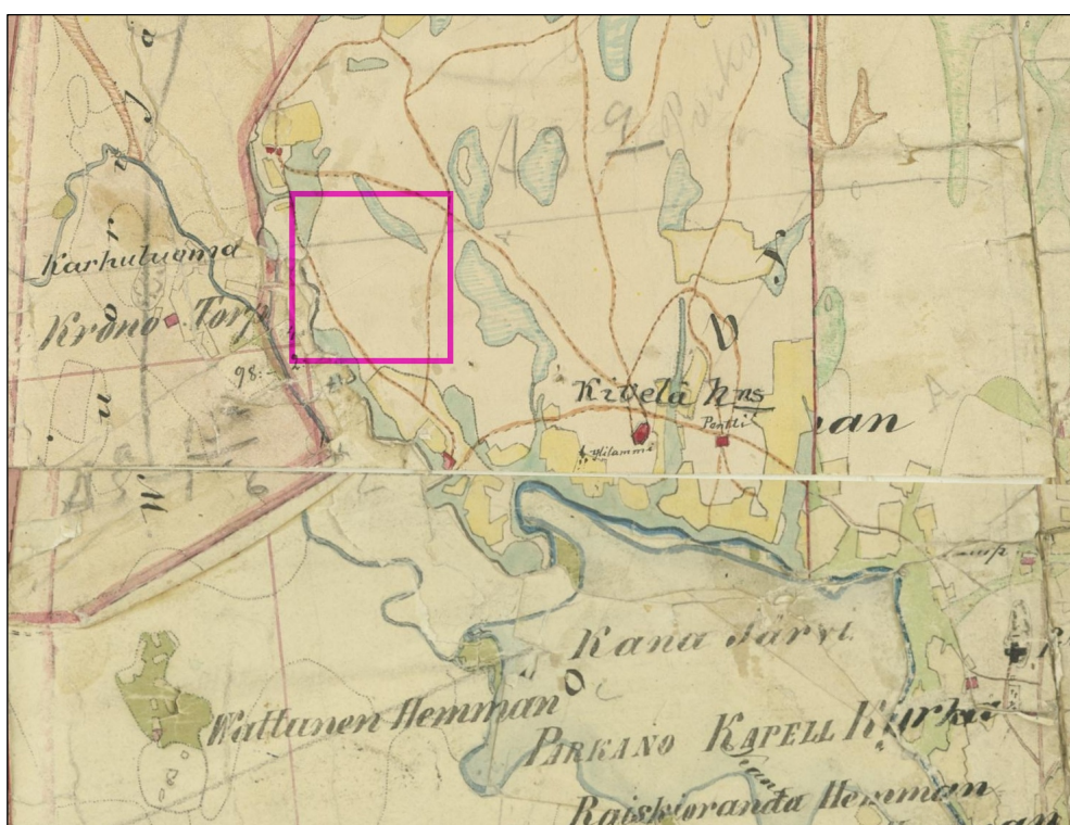
Ote pitäjänkartasta 1840-luvulta. Tutkimusalueen sijainti hahmoteltu päälle sinipunaisella.