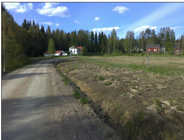
Alueen luoteisosaa pohjoiseen