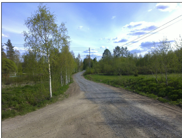
Alueen länsilaitaa missä linja tien varressa (oik. keskiosassa, vas. eteläosassa)