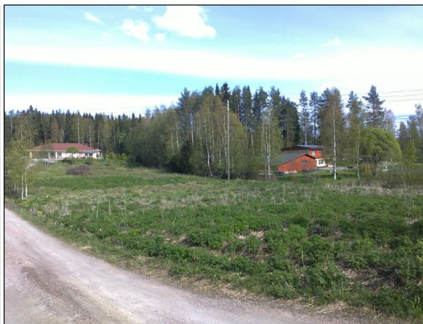
Alueen keskiosaa itään– linja pellon halki