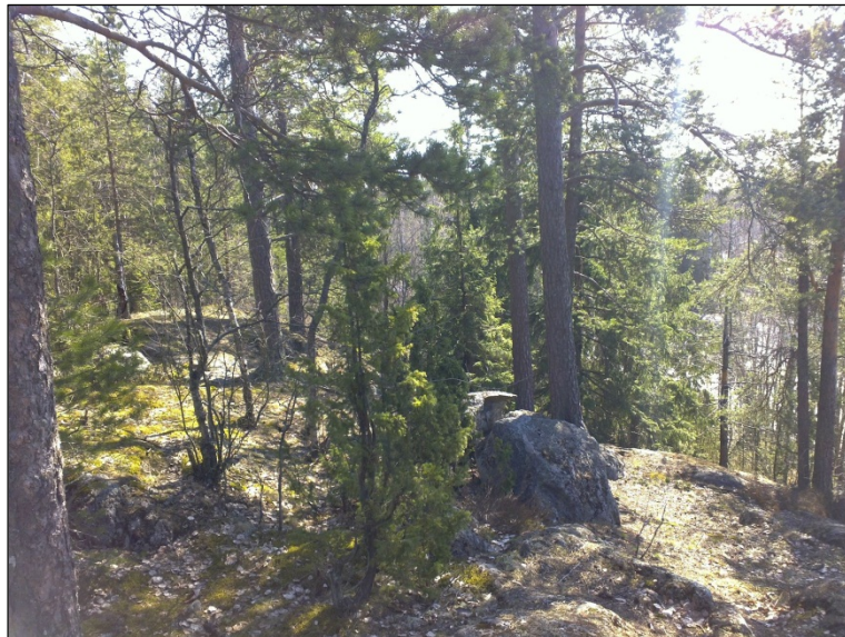
Eteläpään kalliota Alla mäen lounaisosaa