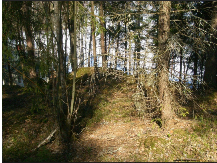
Pohjoisosan laen reunaa