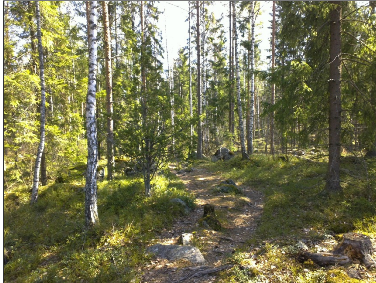
Pohjoisosassa laen yli kulkeva polku