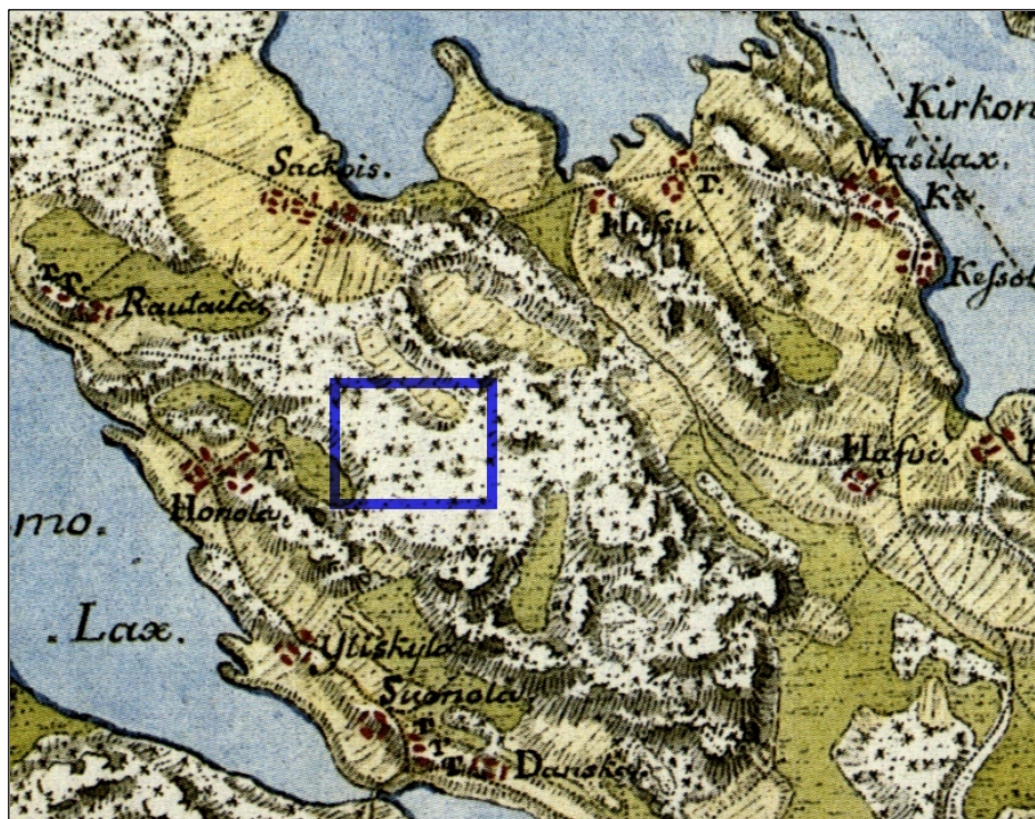
Ote ns. Kuninkaankartasta 1790-luvulta

Tutkimusalueen sijainti hahmotettu kartoille sinisellä suorakaiteella