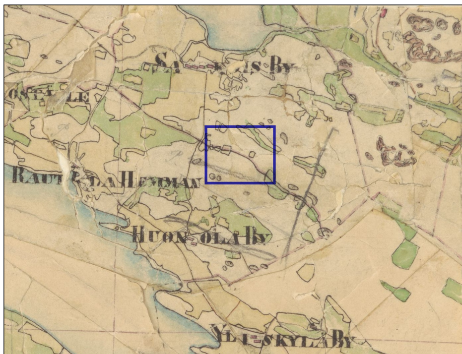
Ote pitäjänkartasta 1840-l