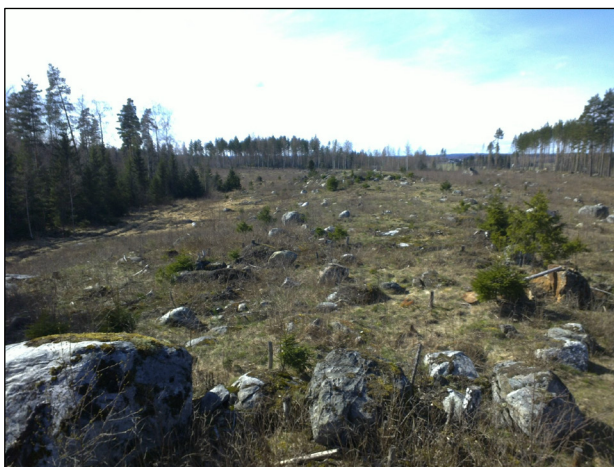
Alueen pohjoisosaa länteen