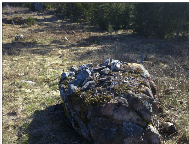
maakiven päälle nosteltu pikkukiviä