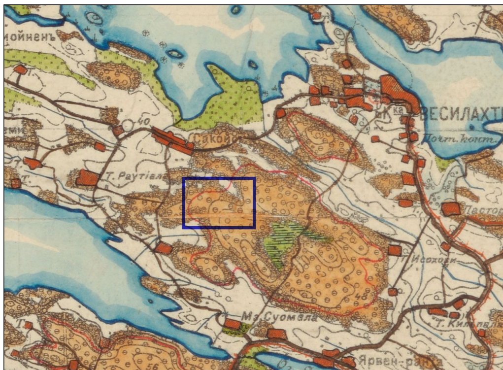
Ote ns. Senaatinkartasta v. 1909