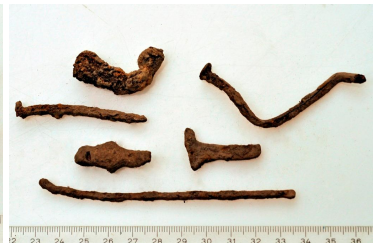
167 (ylh.), 168, 169, 170 ja 171