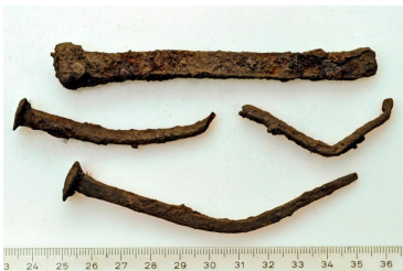
103 (ylh.) ja 104