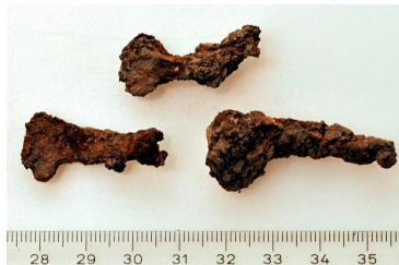
161 (ylh.), 162 ja 163