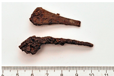
13 ja 17(ylh.)