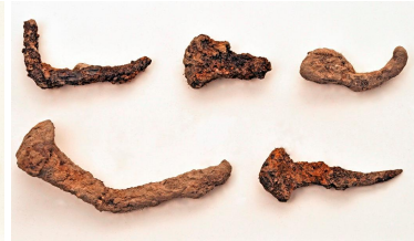
47(ylh. oik), 48 ja 49