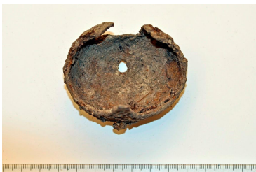
34 LÖYTÖ SÄÄSTETTY