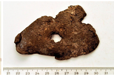
110 LÖYTÖ SÄÄSTETTY