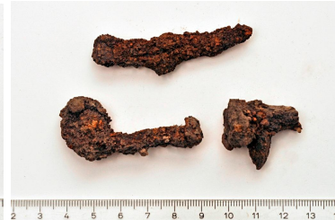
7 (ylh.) ja 8