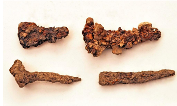
44 (ylh. oik.), 45, ja 46