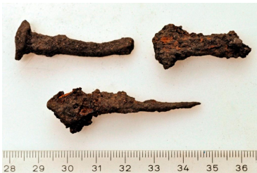
111 (ylh.vas.), 112 ja 113