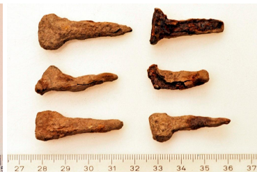
67 (ylh.) ja 68