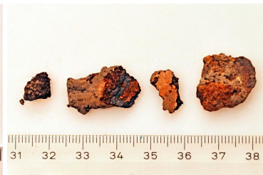
76 ja 77 (oik.)