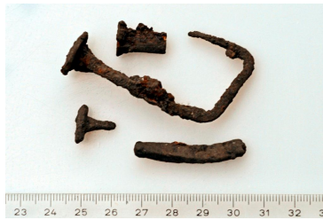
130 (ylh.), 131 ja 132