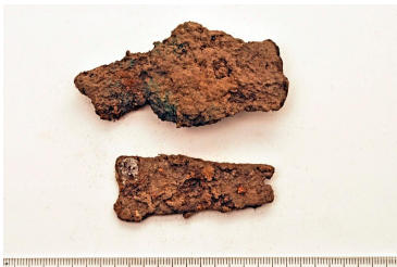
29 (alh.) ja 31