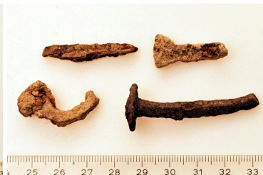
87 (ylh.), 88, 89 ja 90