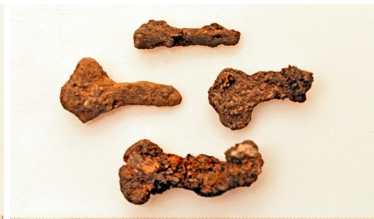
63 ja 64 (alh.)