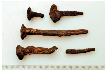
124 (ylh. vas.), 125 ja 126