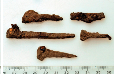
151 (ylh.) ja 152