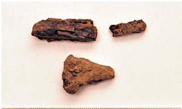
38 (ylh.) ja 39