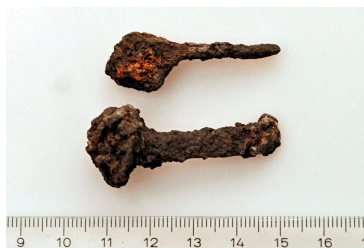
136 (ylh.) ja 137