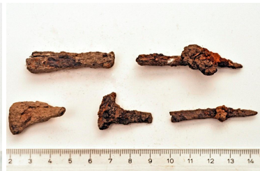
28 (ylh.) ja 30