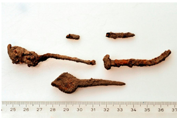
153 (ylh.), 154 ja 155