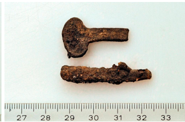
127 (ylh.) ja 128