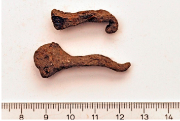
21 (ylh.) ja 23