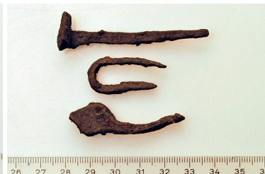
106 ja 107 (alh.)