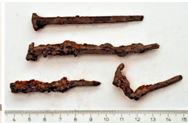
11 ja 12 (ylh.)