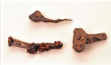
41 (ylh.) ja 42