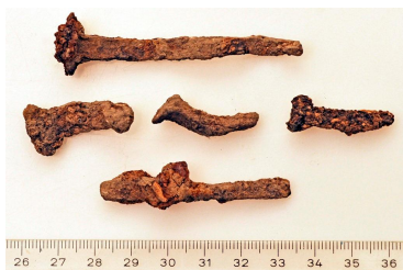
78 ja 79 (alh.)