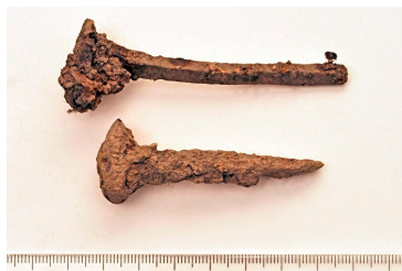
35 (ylh.) ja 37