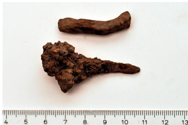
4 (ylh.) ja 5