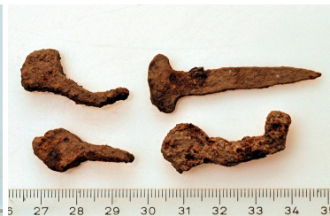
157 (ylh.), 158 ja 159