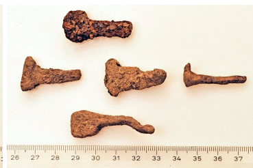
83 ja 84 (alh.)