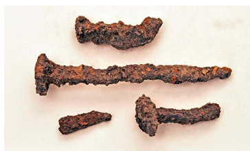
52 (ylh.), 53, 54 ja 55