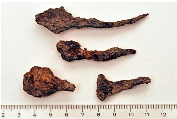
25 (ylh.) ja 27