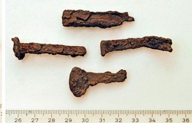
100 (ylh.), 101 ja 102