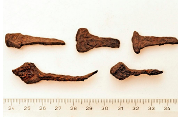
95 (ylh.), 96, 97, 98 ja 99