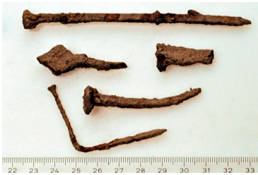
139 (ylh.), 140 ja 141