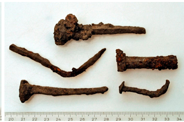
133 (ylh.) ja 134