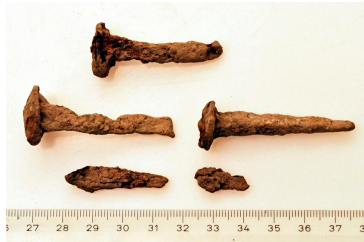
70 (ylh.), 71 ja 72