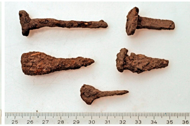
145 (ylh.), 146, 147 ja 148