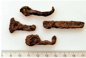
142 (ylh.), 143 ja 144