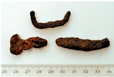
122 (ylh.) ja 123