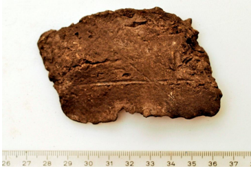
91 LÖYTÖ SÄÄSTETTY