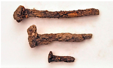
50 (ylh.) ja 51