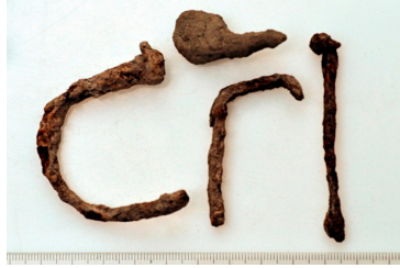
176 (ylh.) ja 177