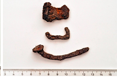
19 ja 20 (ylh.)