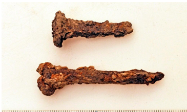
60 (ylh.) ja 61