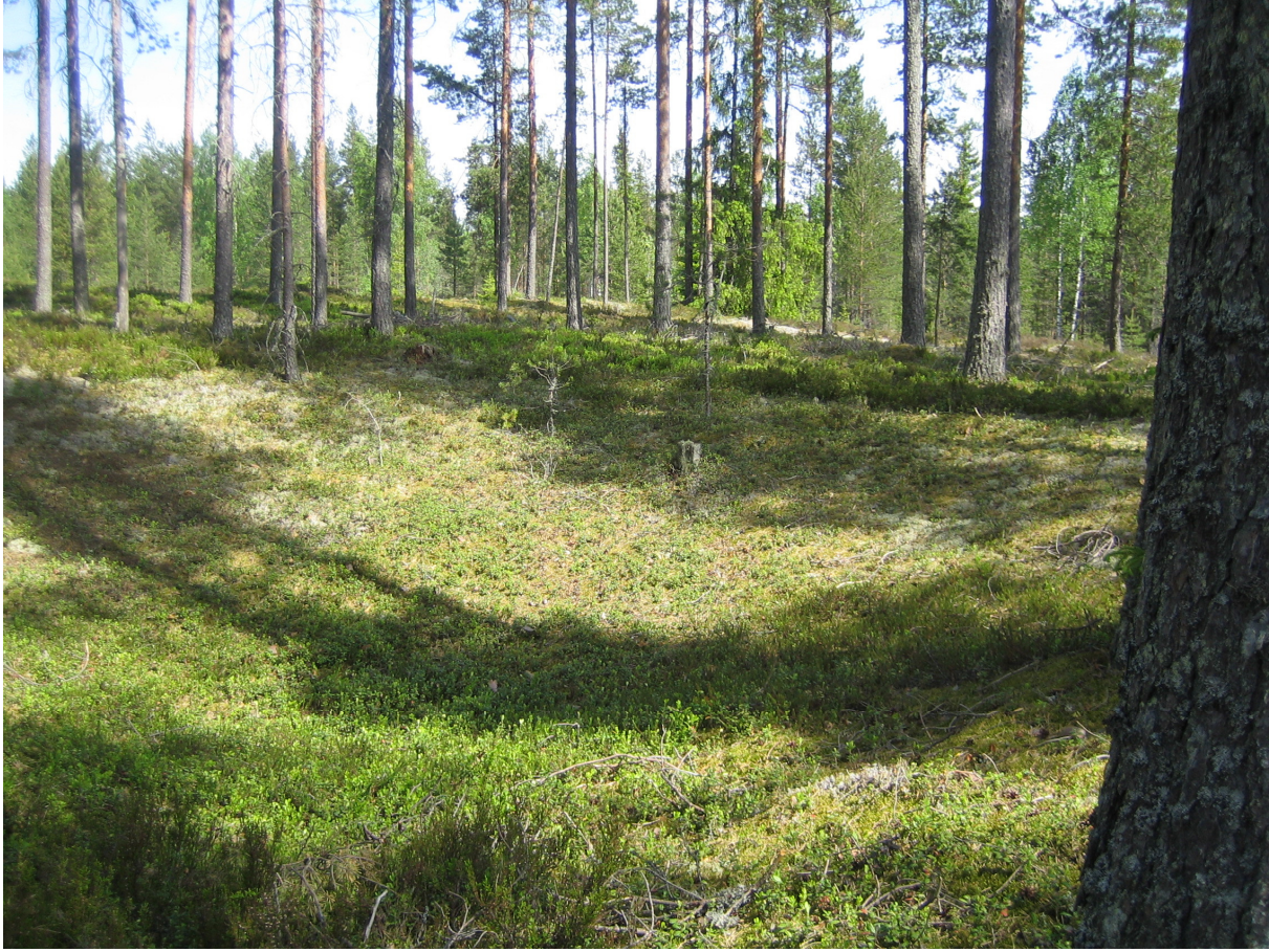
Kuva 2. Malkanevan tervahauta. Lounaasta.