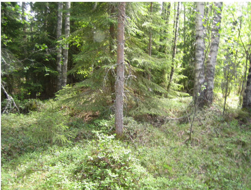
Kuva 3. Kärmeskallio. Tervahauta puiden keskellä.