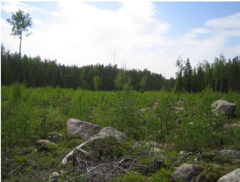
Kuva 4. Lähdekangas. Tervahauta on kadonnut maanmuokkauksessa.