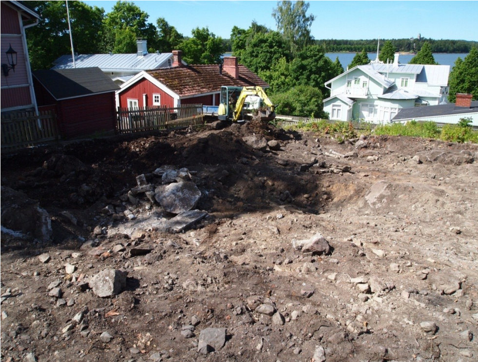
Kuva 2. Rakennuksen luoteisosa. Keskellä kuvassa rakennuksen tuleva perustuslinja ja vasemmalla mahdollinen kellarin ulkoseinä. E. K. Uotila