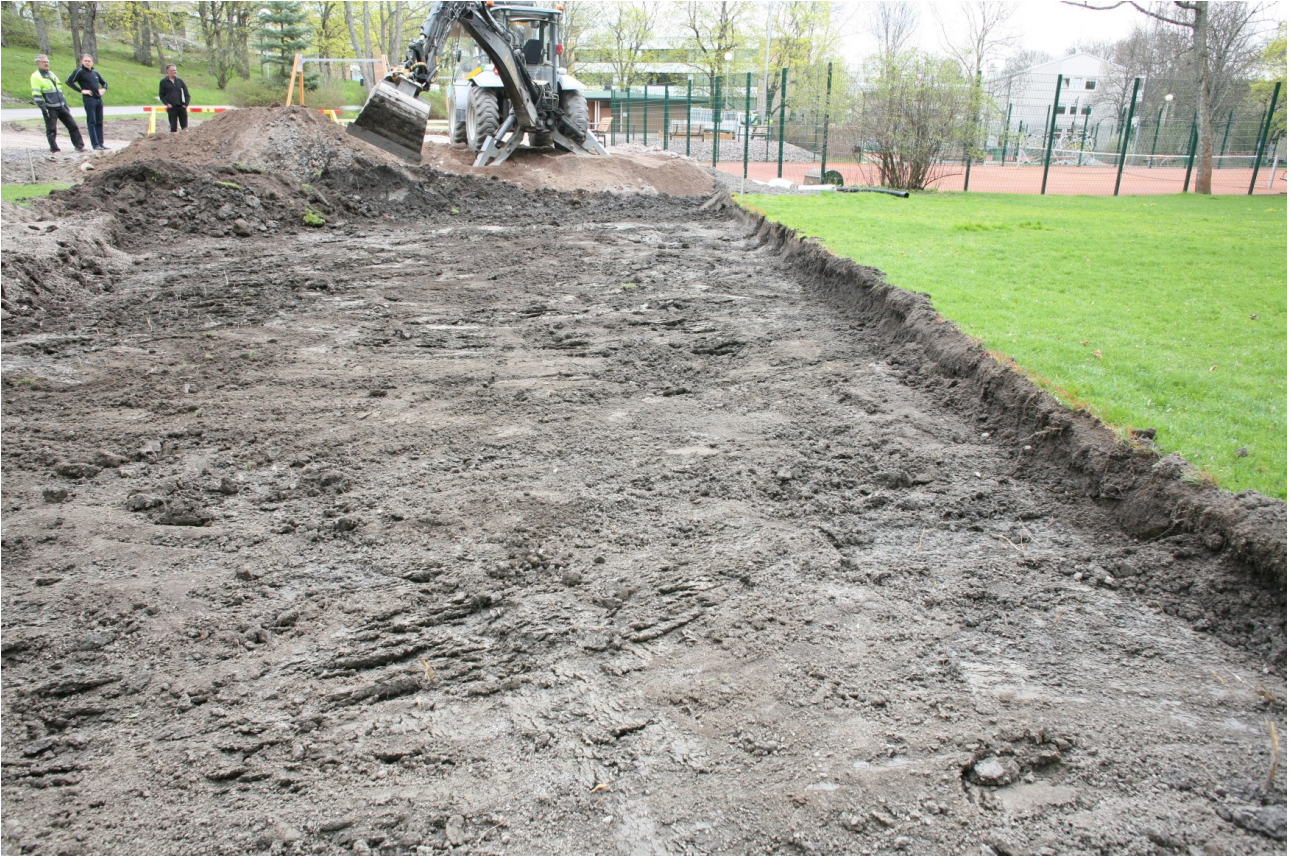
Kuva 1. Yleiskuva. Petanquekentän alue toukokuussa 2012.