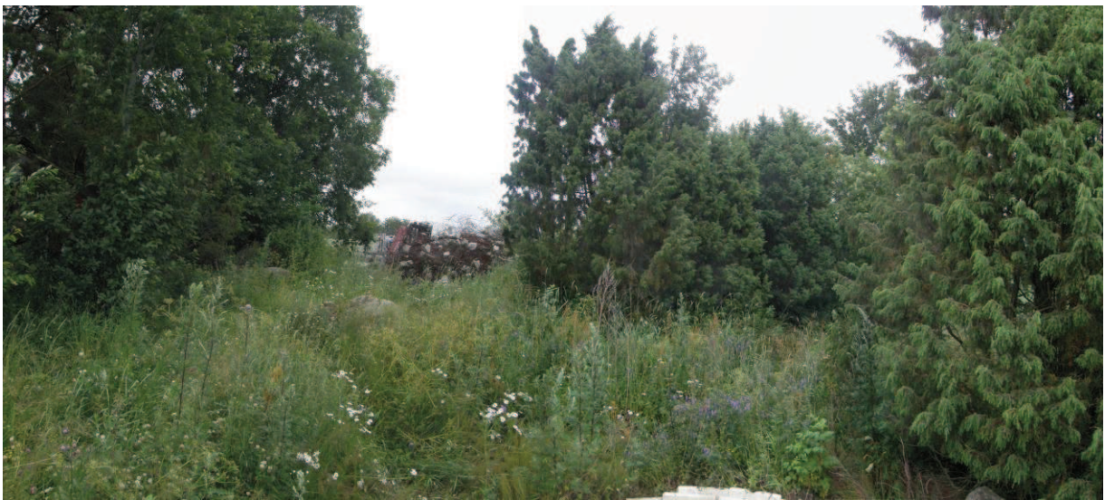
AKDG 3282:2 Tutkimusalue, kuvattu etelästä.