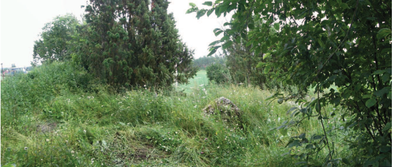
AKDG 3282:4 Tutkimusalue, kuvattu lännestä.