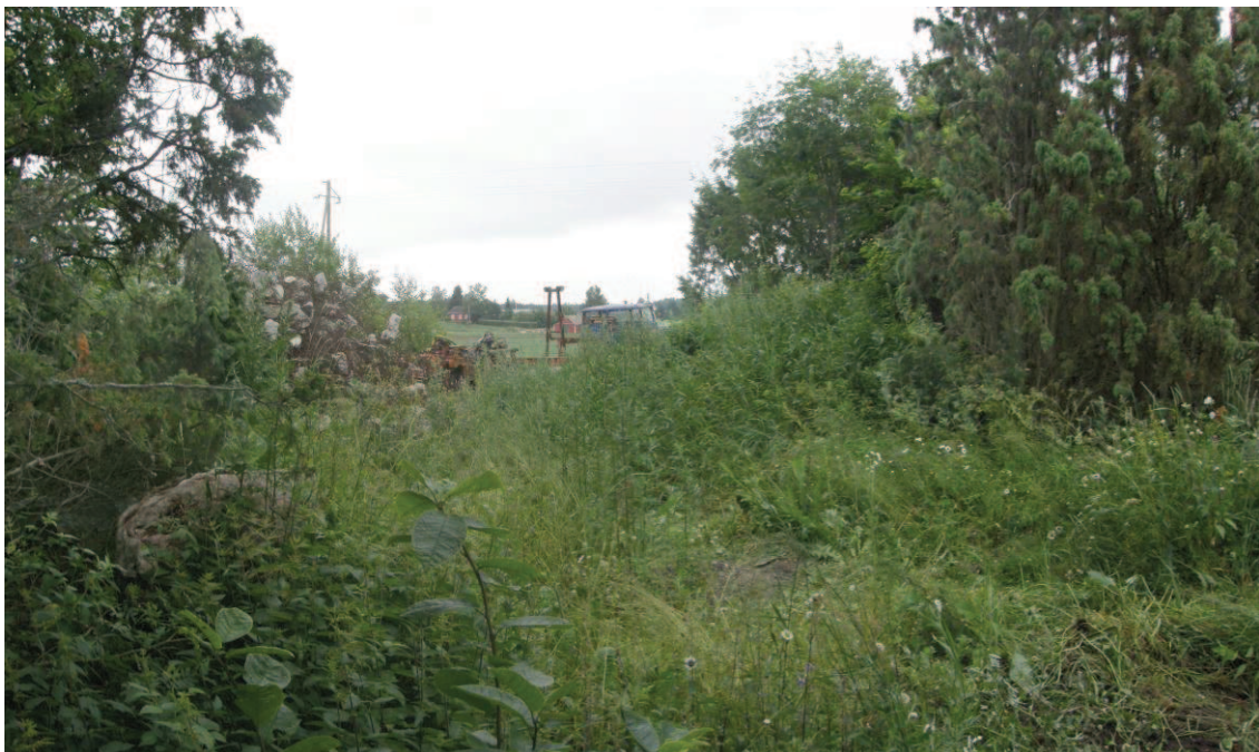
AKDG 3282:3 Tutkimusalue, kuvattu lounaasta.