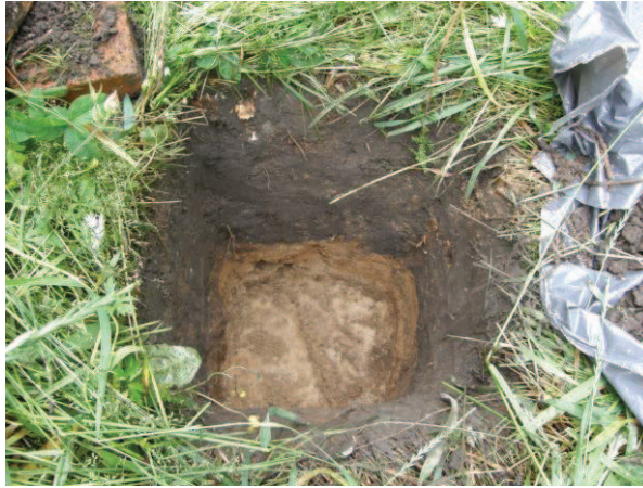
AKDG 3282:1 Koekuoppa 1, kuvattu etelästä.