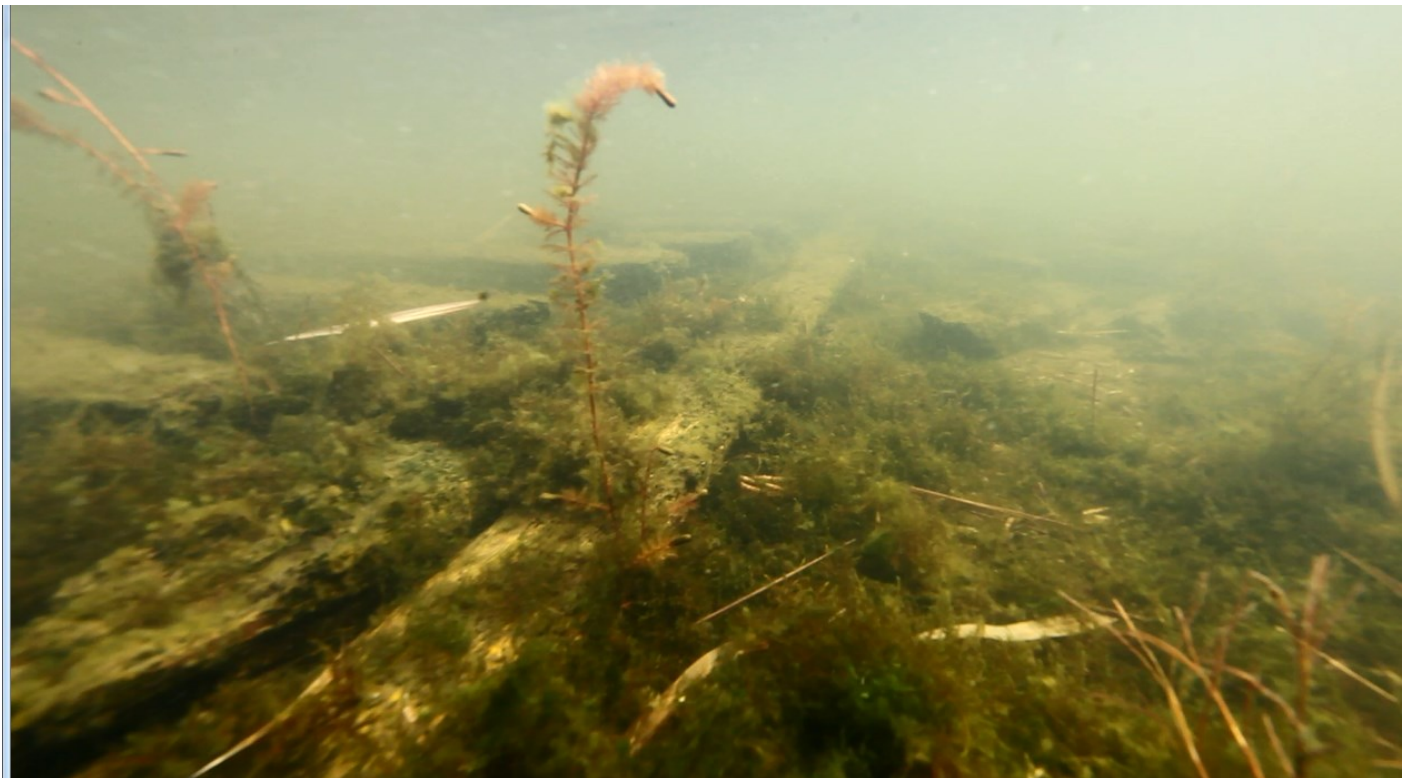
Kohdasta 08:33. Palkkien molemmilla sivuilla (pohjois- ja etelä) kulkee pitkä lauta, ei kuitenkaan ylety kohteen päästä toiseen päähän.