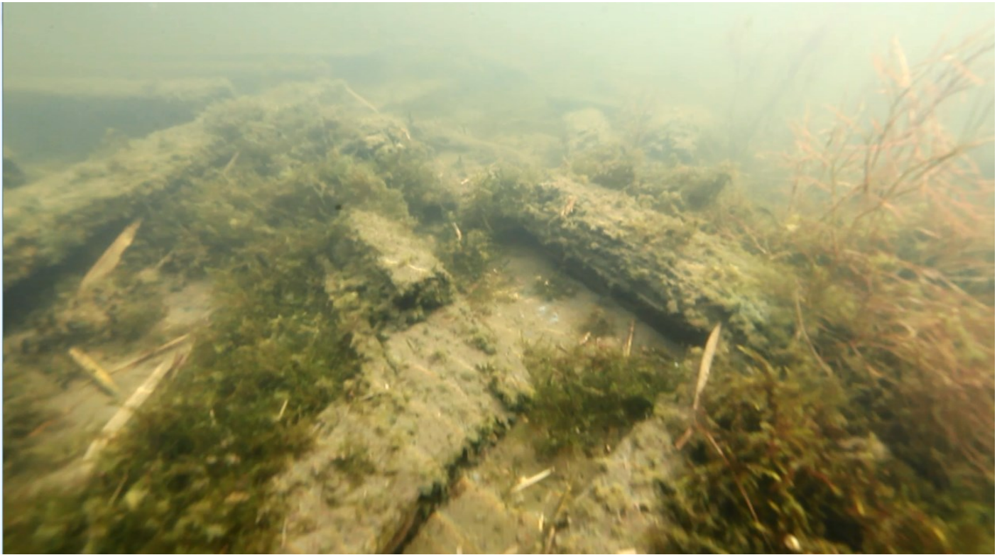
Kohdasta 08:57. Rakenneosia hyllyn eteläpuolella. Esimerkiksi suuria polven näköisiä osia.