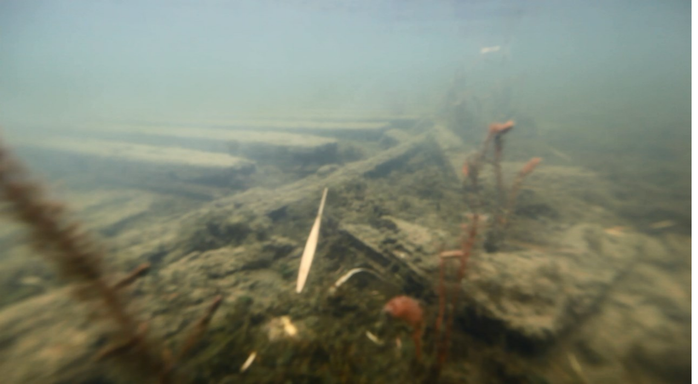
Kohdasta 00:18. Kohteen pohjoispuoli. Mahdollisesti aluksen kansipalkkeja, palkkien vieressä irtonaisia rakenneosia.