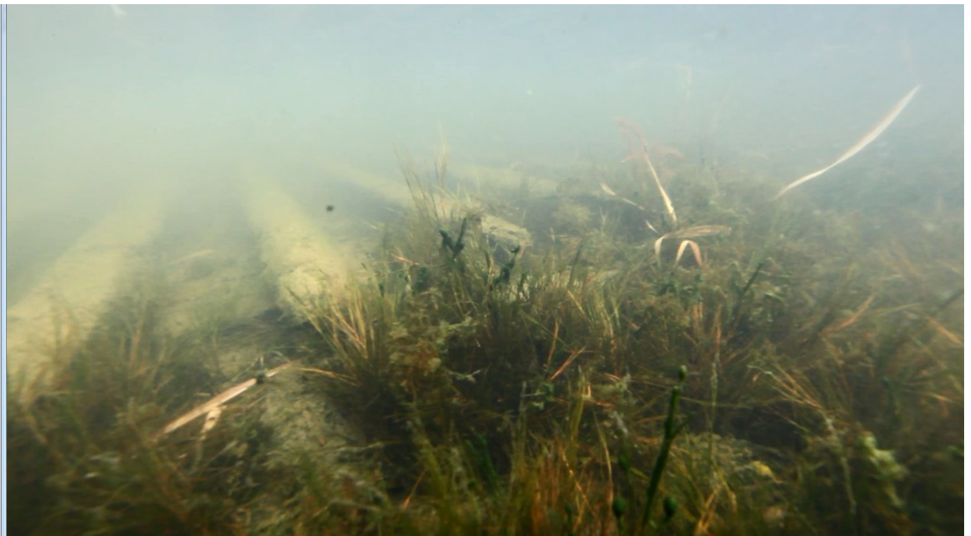
Kohdasta 09:37. Palkkien idän puoleinen päätyosa.